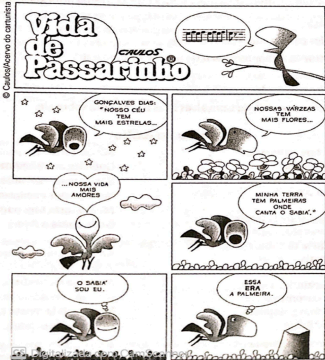
Figura 3 – Atividade de interpretação do texto “vida de passarinho”

b) Qual pode ser a intenção de Caulos ao citar a “Canção do exílio”? Justifique sua resposta com elementos dos textos.