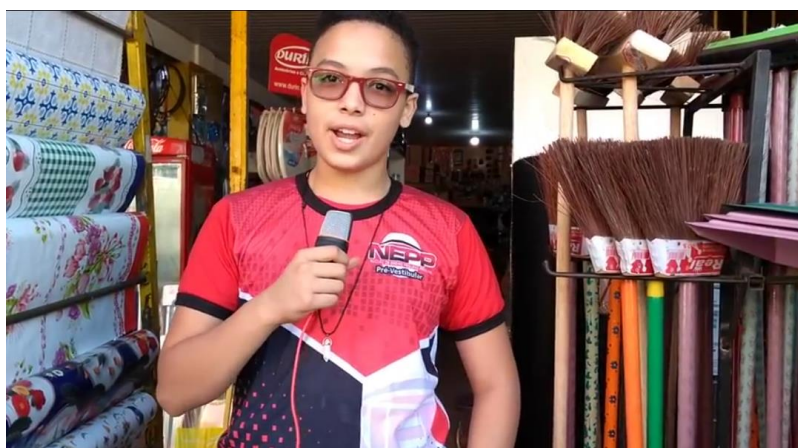
FIGURA 11: Visita a feira do Distrito Industrial, Ananindeua.

riqueza da feira, enquanto vivências e histórias e com isso, puderam analisar aspectos da que norteiam a vida rural e urbana de uma forma significativa e palpável. Alguns alunos perceberam além das dinâmicas diferentes as contradições, ora criticando e questionando, fazendo comparações das várias situações, entre eles a venda dos produtos pelas grandes empresas e as dificuldades do pequeno agricultor que muitas vezes não tem possibilidades de ascensão econômica, ainda assim sendo o grupo que sustenta as comunidades do Estado do Pará.