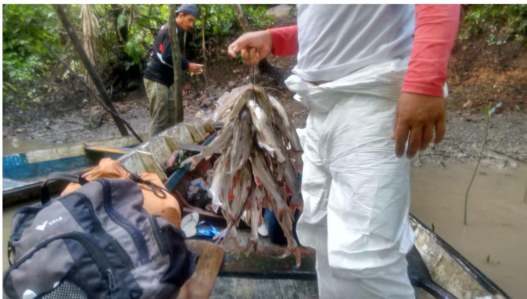
FIGURA 9-Pescadores, vila de Pedrinhas.