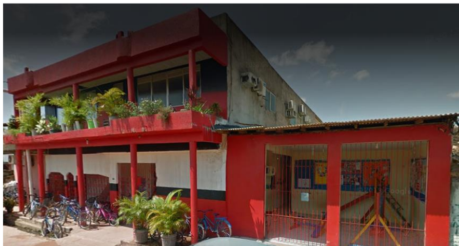
FIGURA 09: Núcleo de Ensino Pequeno Príncipe.

aprendizado e fomentar o interesse dos alunos pela sua própria história e contribuir para o apreço da história local, ou conhecimento de especificidades da sua localidade. Atentando para as memórias coletivas, características e organização social, reafirmando assim, o papel da escola, professor e da comunidade estudantil em apreciar suas raízes.