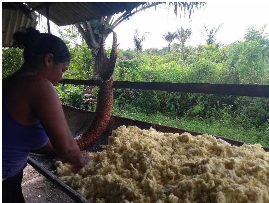
FIGURA 6- Preparo da mandioca no tipiti, vila Pedrinhas.