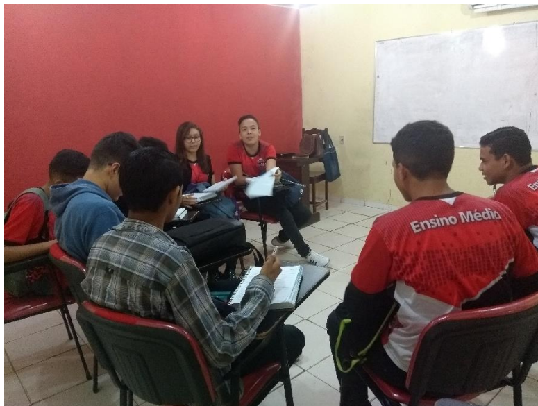
FIGURA 10: Socialização da pesquisa