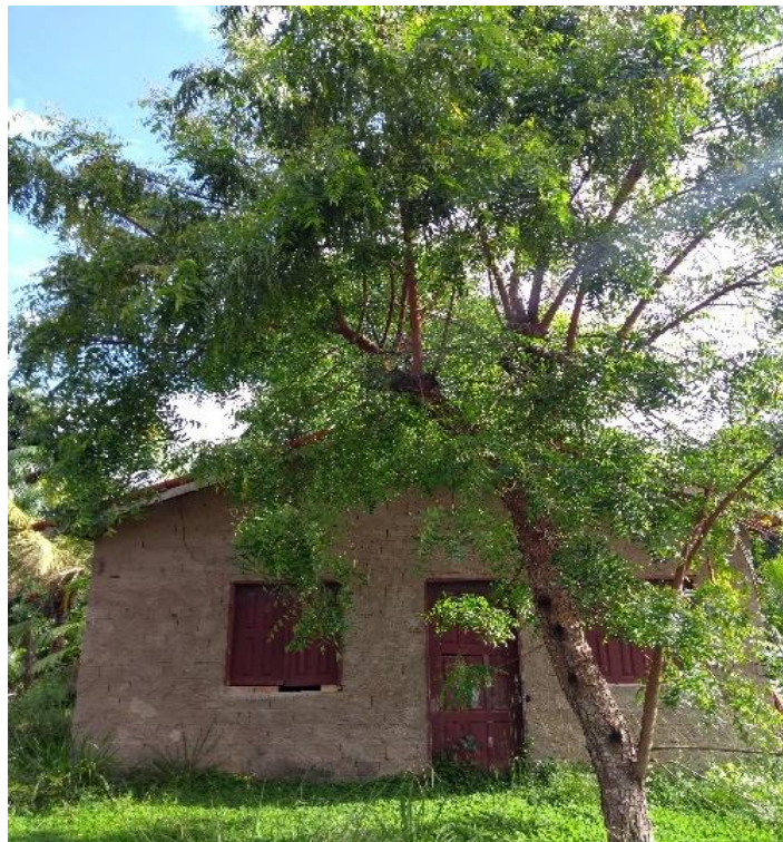
FIGURA 2- Casa de alvenaria, vila Pedrinhas.