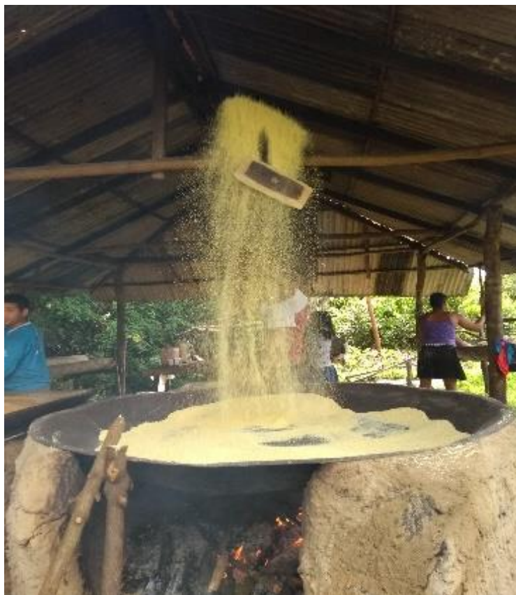
FIGURA 7-Farinha sendo torrada, vila de Pedrinhas.

fotografia abaixo, representa uma casa de forno, momento em final do processo de feitura da farinha.