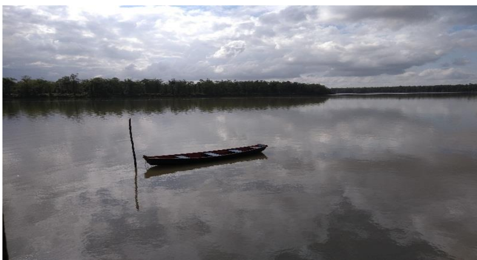
FIGURA 5- Rio Maracanã

A economia da vila é baseada na pesca artesanal, agricultura de subsistência. De acordo com Augusto Manuel Correia (2013, p. 53), “os sistemas de subsistência, como o nome indica, são sistemas que visam fundamentalmente a sobrevivência do agregado familiar o que os torna muito mais resistentes a qualquer mudança”, como se observa na comunidade de Pedrinhas. Além da agricultura, a extração de caranguejo é também observada. A maioria dos moradores são pescadores e retiram sua sobrevivência dos mangais do rio Maracanã, outros são aposentados que se refugiam na vila em busca de paz e tranquilidade.