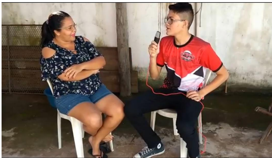
FIGURA – 12: Entrevista com feirantes.

as pequenas comunidades, que estas possuem um valor para a sociedade, e por muitas vezes são ignoradas e afastadas das políticas públicas, ou mesmo com a falta de acesso a saúde e educação, saneamento básico. Além de não contarem com suportes de crescimento e assim chegar ao desenvolvendo pleno de suas atividades agrarias, pastoris, extração de caranguejo. Os moradores estão em muitas vezes presos em laços como o caso do Quinhão , e não possuem meios para desvencilhar de tais práticas por desconhecimento.