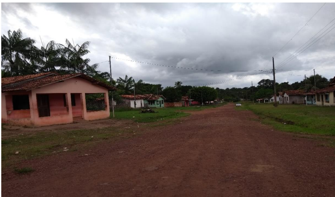
FIGURA 3- Rua Principal, vila Pedrinhas.

A comunidade possui 22 ruas de chão (terra batida), em sua maioria largas. O relevo da vila é formado por ladeiras e morros, onde é possível perceber matas originais com árvores, por todos os lados. A fotografia a seguir é de uma rua principal da comunidade.