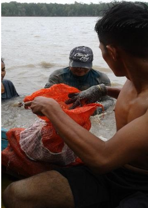
FIGURA 8 - Extração de Caranguejo, vila de Pedrinhas.