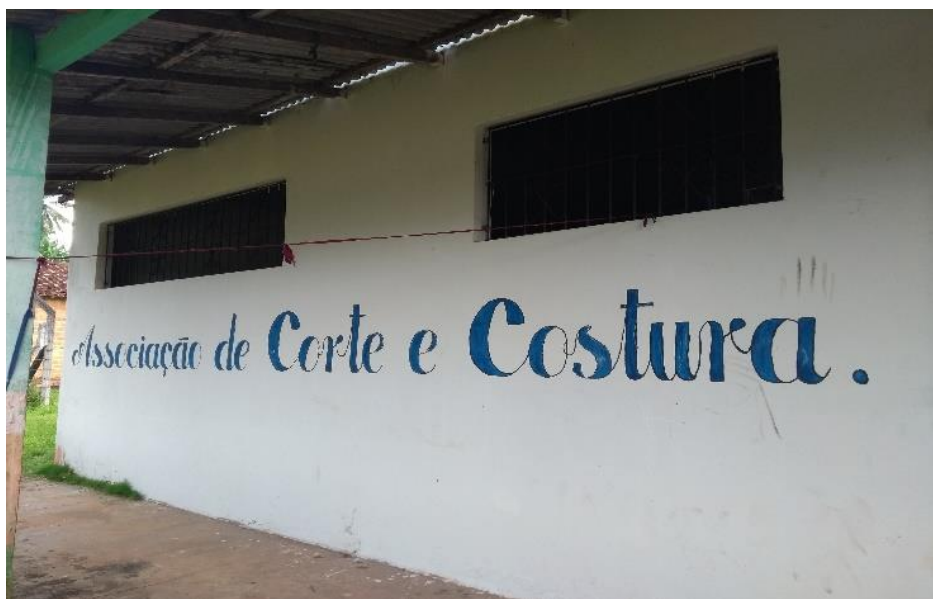
FIGURA 4- Associação de corte e costura, vila Pedrinhas.

Entre outros aspectos da estrutura da vila, possui uma Associação de Corte e Costura, atendendo 8 mulheres. Nesse local as mulheres da vila aprendem as técnicas para a costura, socializam experiências e etc. Para as comunidades que tem como base de sustentação a atividades agrícola e pesca, como demonstraremos posteriormente, a experiência da associação é fundamental. No caso, trata-se de um espaço que atenta para a profissionalização de mulheres e homens interessados com a arte do corte e costura, mas também se constitui como local importante para agregar pessoas, reunir amigos e compartilhar valores e experiências, dinamizando a vida em comunidades. A reprodução a seguir mostra fachada da frente do prédio que abriga as atividades da associação de corte e costura.