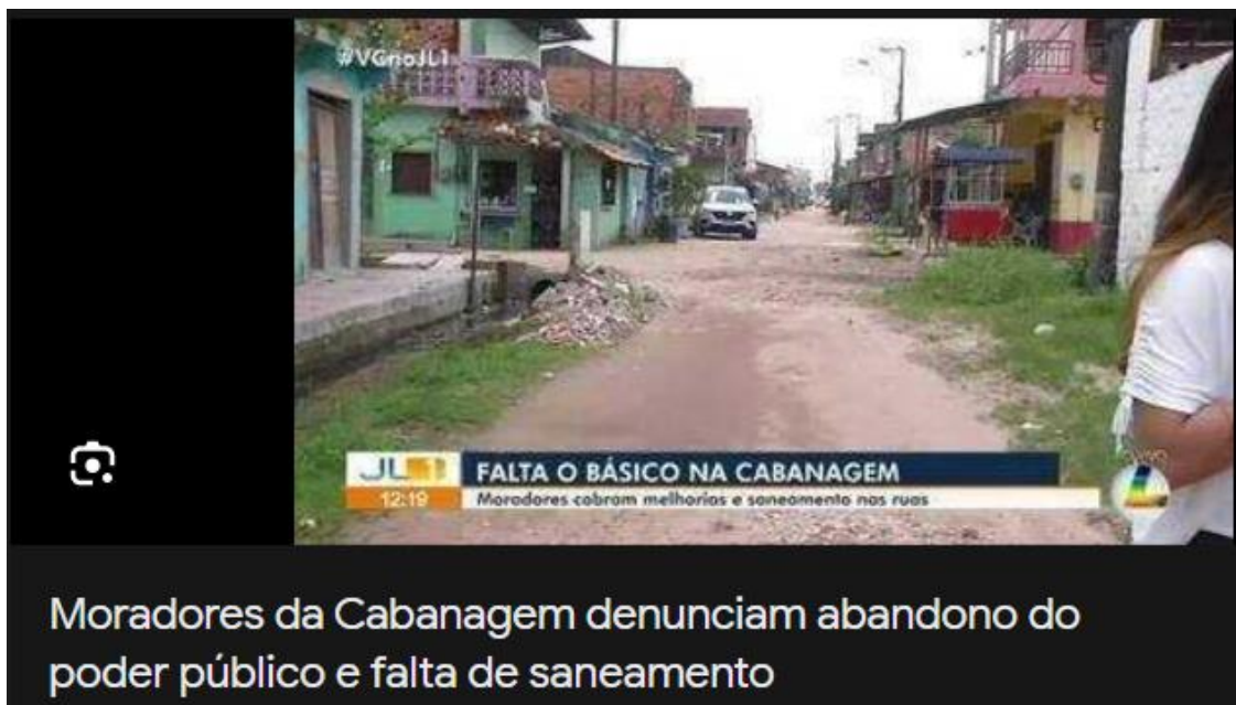
Figura 4. Gravação jornalística em rua no bairro da Cabanagem.