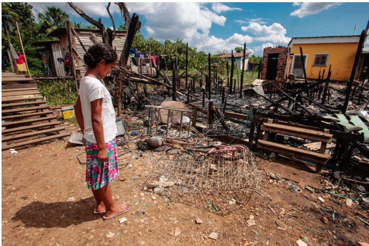
Figura 2. Criança olhando casa incendiada na invasão do sabão - Cabanagem.

familiares ter sido assassinado por dívidas de drogas e a polícia ter intimado a família a depor.