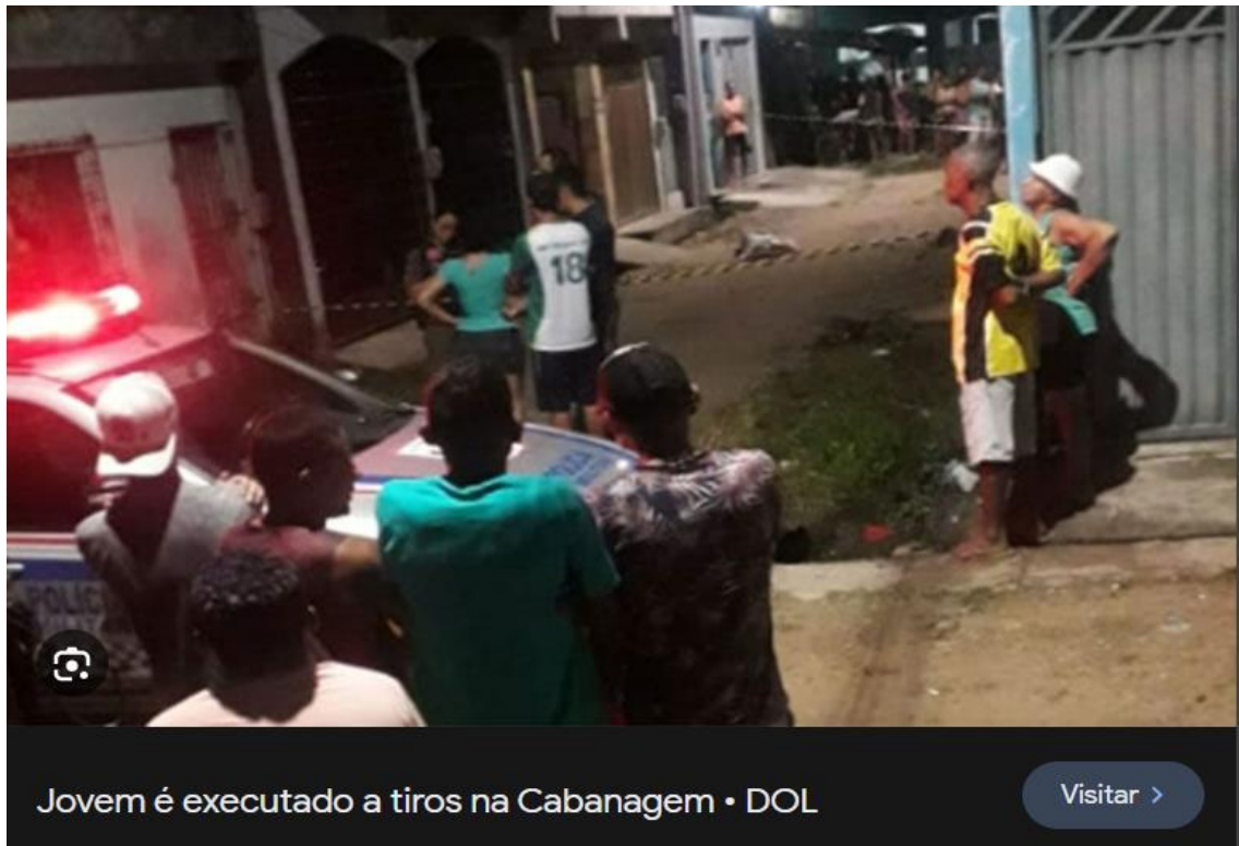
Figura 3. Pessoas reunidas em torno de um carro de polícia.