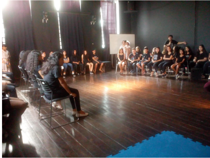
Figura 2 - Sala de Aula