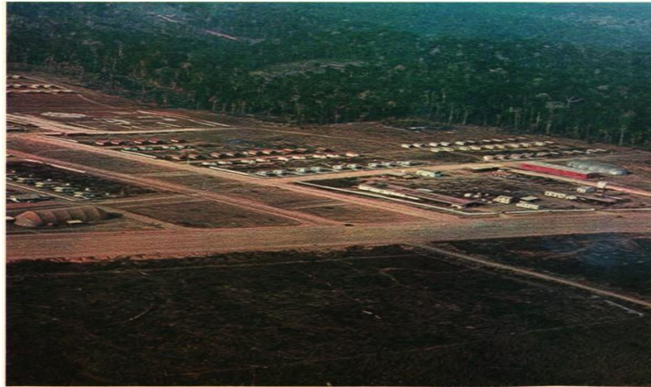
Imagem aérea do processo de construção de uma agrópolis, onde se pode ter a dimensão das extensas clareiras abertas para o processo de implementação dos diferentes núcleos urbanos das cidades rurais. Imagem retirada do livro Urbanismo Rural , publicado pela editora Gutenberg em 1973.

E estes são somente alguns dos exemplos dos diversos impactos que se estenderam desde o nível ambiental, até o social em diversos aspectos, e que afetaram não somente os povos indígenas, quilombolas e comunidades tradicionais, mas todos os seres compunham o ambiente amazônico e igualmente suas dinâmicas de existência e sobrevivência, e que repercutem até a atualidade. Deste modo, é preciso pensar que a abertura de uma nova frente de ocupação, calcada no discurso de vazio amazônico, e alegando fundar uma nova sociedade com indivíduos exógenos à região, introduziu também velhas relações de exploração e violência, e que todo esse processo correspondeu a interesses de expansão do capital, representado pelos grandes empreendimentos privados.