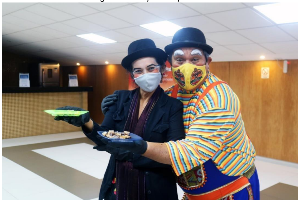
Figura 11 A espera do público