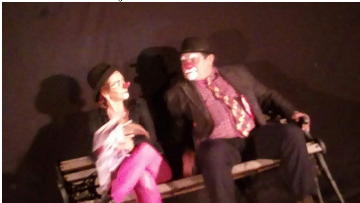
Figura 5 - Encontro com o meu Clown