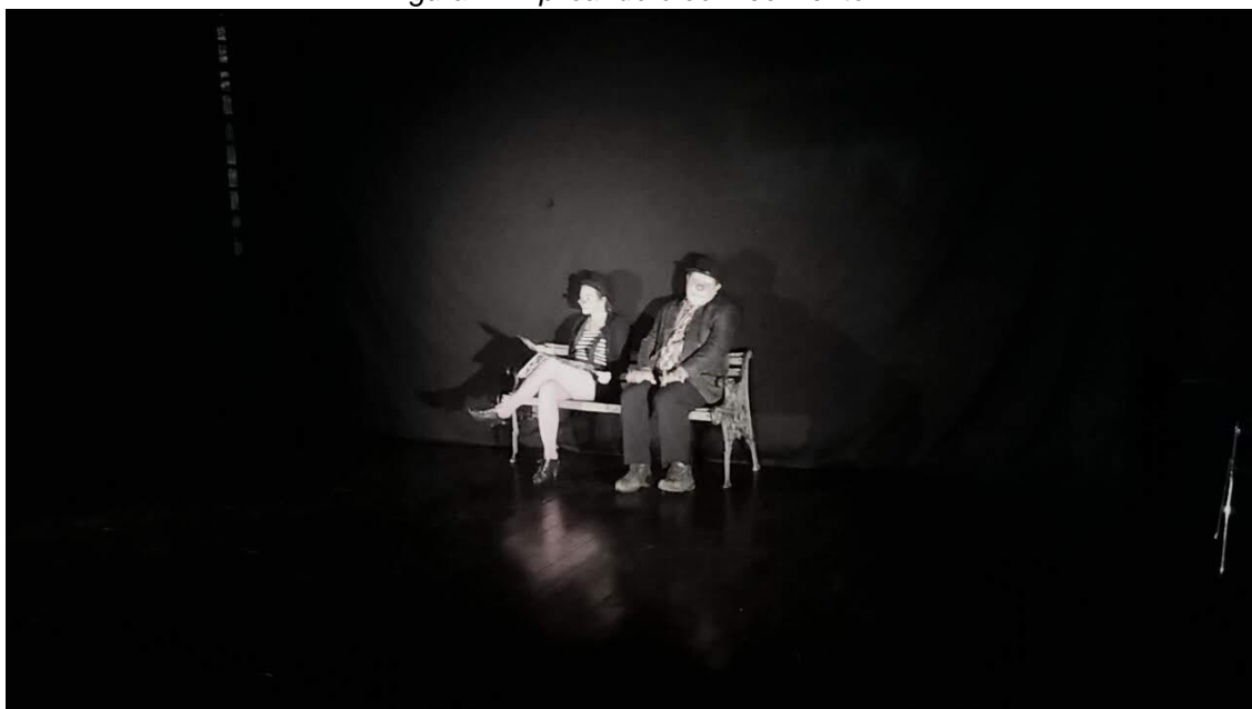
Figura 7 - Aplicando o conhecimento