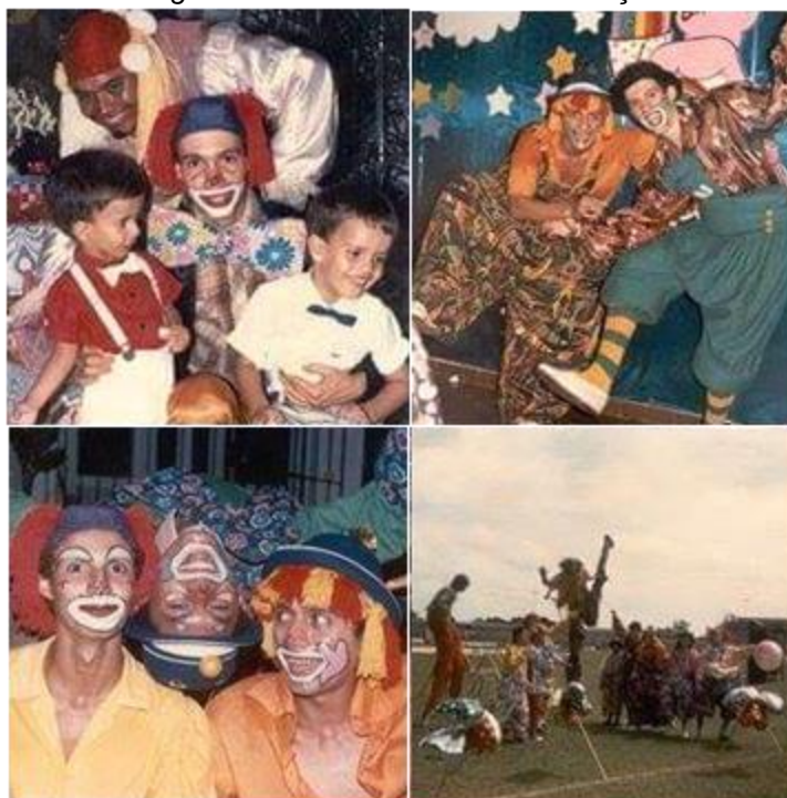
Figura 2 – Fotos na Festa de Animação