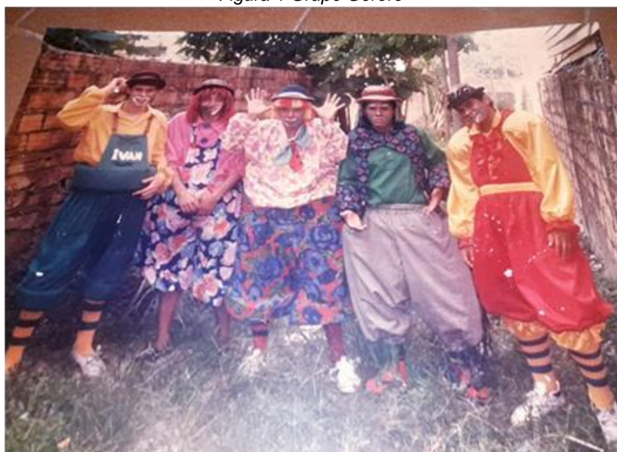
Figura 1 Grupo Gererê

Tio Padreco tinha se transformando em um palhaço rico em teoria, mas cada dia mais pobre em sentimento. O amor, o êxtase, o nervosismo foram sumindo e assim percebi que o circo tradicional não mais atendia minhas necessidades de atuação. Era hora do Tio Padreco voltar às origens. O antigo grupo de amigos palhaços que denominamos de Grupo Gererê. A seguir, Figura 1, a primeira foto oficial do Grupo Gererê, nos fundos do foto Souza no bairro de São Braz.