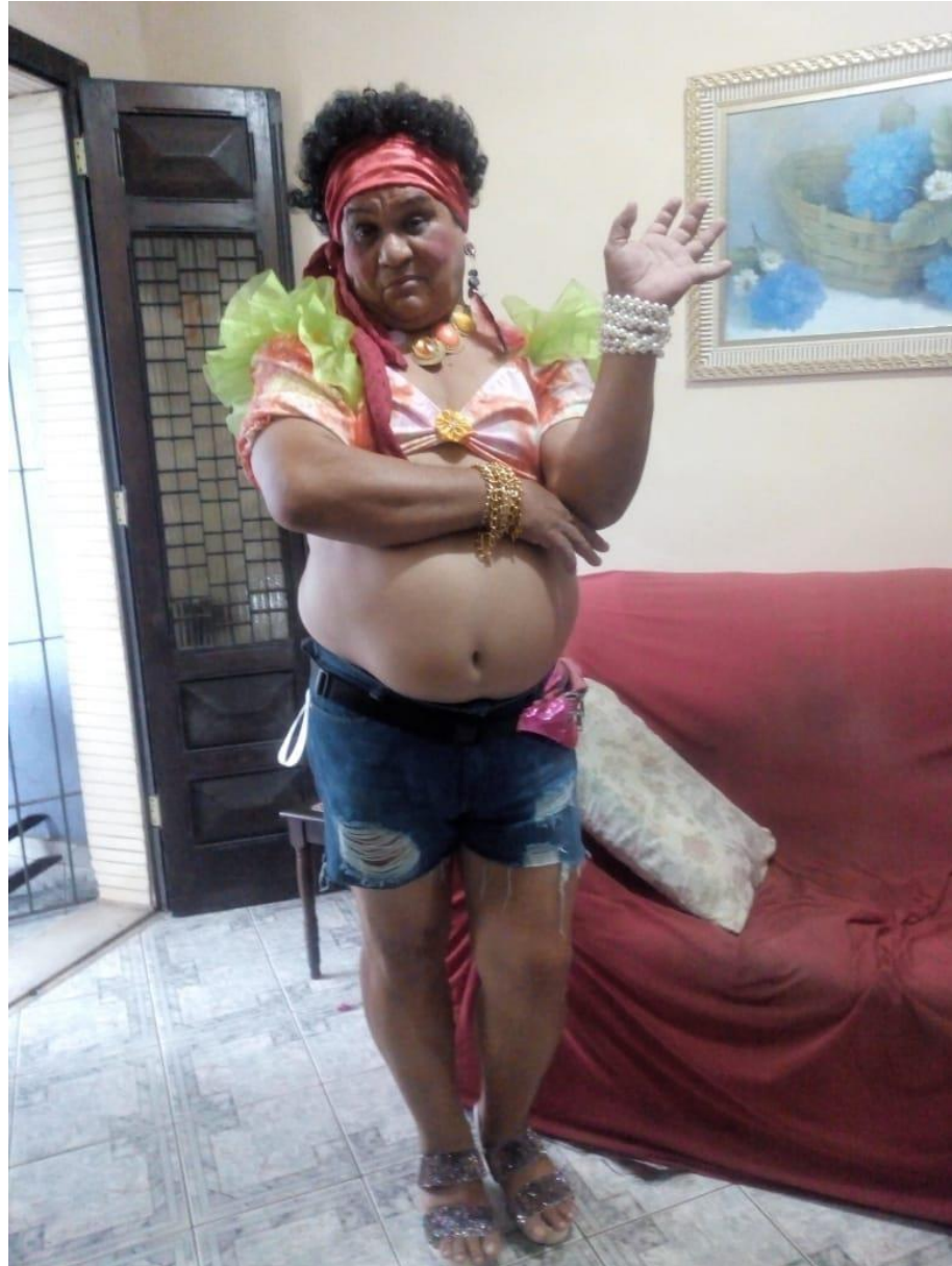
Figura 9 - Ensaio fotográfico do espetáculo "Pensão da Cotinha" (Grupo Experiência)