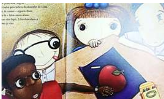
Figura 03: Lilás em seu primeiro dia de aula

Lilás era mesmo diferente. Em uma aula de artes pintou uma maçã em uma folha papel com fundo azul-marinho. Mostrou para seus colegas que era muito talentosa ao ponto de ser premiada por ter desenhado “ a maçã mais linda que toda a turma já vira ” (WITHCOMB, 2011 p. 14). As crianças ficaram epinotizadas com o que viram.