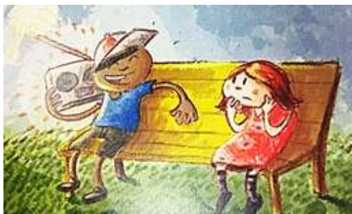
Figura 06: Flor e Téo.