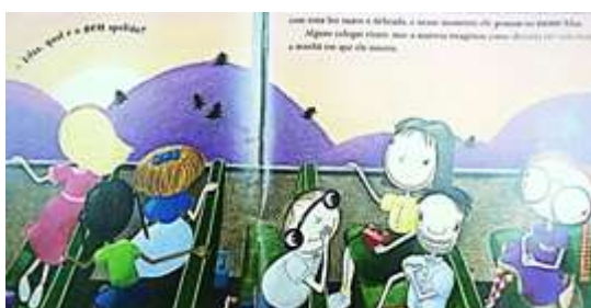
Figura 02: Lilás em seu primeiro dia de aula

A diferença explícita no comportamento de Lilás gerou indiferença por parte de seus colegas. Por exemplo, durante uma excursão escolar, enquanto todos socializavam, a garota Lilás era excluída e não tinha oportunidade de participar das brincadeiras e conversas no ônibus. Sempre ficava isolada, conforme figura abaixo.