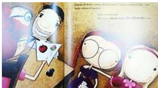
Figura 04: Lilás em seu primeiro dia de aula

A autora Mary Withcomb finaliza a narrativa com a afirmativa “ Lilás era diferente. Mas talvez ela não fosse tão diferente assim ”. Dessa forma, percebe-se na cena da figura 04 e no trecho retirado do livro que a inclusão escolar é possível e que nem todas as diferenças resultam em inferioridade entre as pessoas, pois da mesma forma que há igualdades, também há diferenças. Não obstante, ainda existem muitas barreiras para se mudar o paradigma educacional da homogeneidade, sobretudo, o exercício do direito de sermos diferentes quando a igualdade nos exclui.