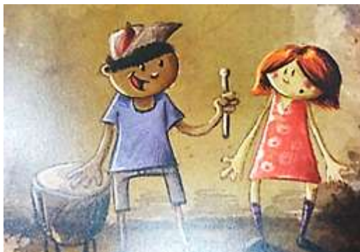
Figura 07: Flor é desafiada.

defendemos uma cultura do oralismo, mas uma prática pedagógica e social na perspectiva da inclusão.