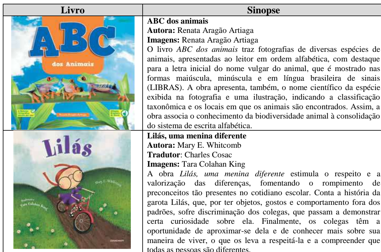
Quadro 01: Livros do acervo do PNAIC que abordam o tema Inclusão

No segundo momento foi realizado um estudo sobre os livros de literatura infantil do acervo do PNAIC que abordassem o tema inclusão. As obras encontradas traziam o tema inclusão em diversas perspectivas: social; étnico-racial e educacional, conforme quadro abaixo: