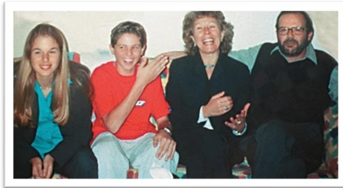
Imagem 1 – Família von Richthofen em 2001.