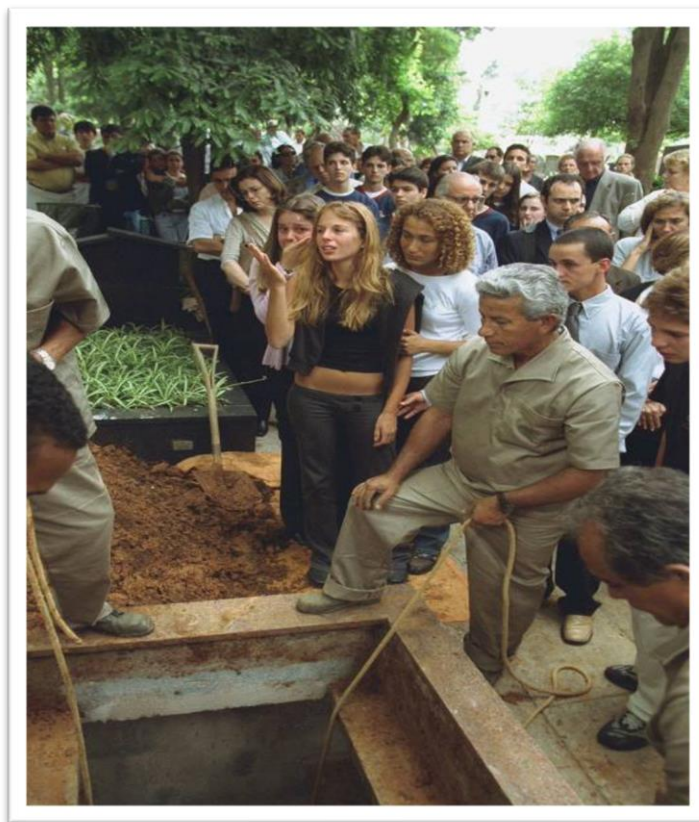
Imagem 14 – Suzane von Richthofen no enterro dos pais.