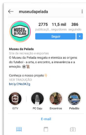
Imagem do perfil do Museu da Pelada no Instagram