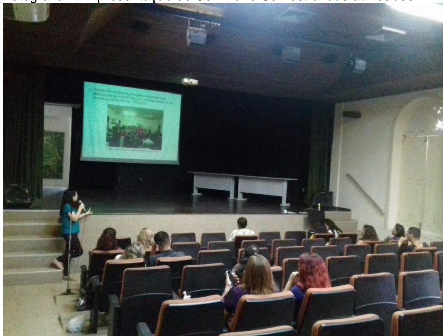
Fotografia 7 - Apresentação do Seminário Semestral das atividades

Os seminários, como mostrado na Fotografia 7, são apresentados para os próprios estagiários da instituição, pensado por uma pedagoga e servidora da instituição, este projeto funciona como uma troca de saberes e um exercício para apresentações orais. Além de ser um modo de organizar as ações realizadas ao longo dos semestres, para servir também como memórias e relatórios importantes sobre o fazer museal e biblioteconômico.