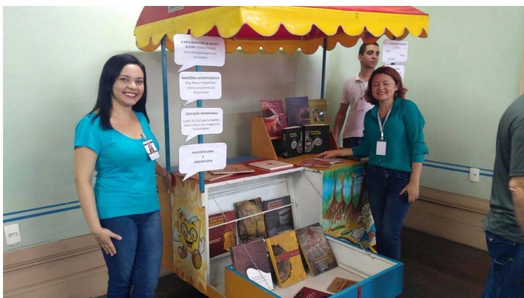
Fotografia 8 - Mediação arqueológica

O bibliotecário e seus estagiários estiveram a frente como mediadores no carro da leitura, que é um carrinho colorido e com pinturas, bem lúdico para mediar com crianças, jovens e adolescentes sobre as publicações que continham assuntos pertinentes a exposição (Fotografia 8). Por conterem publicações científicas também atraiu e foi atendido o público adulto, pesquisadores e comunidade em geral.