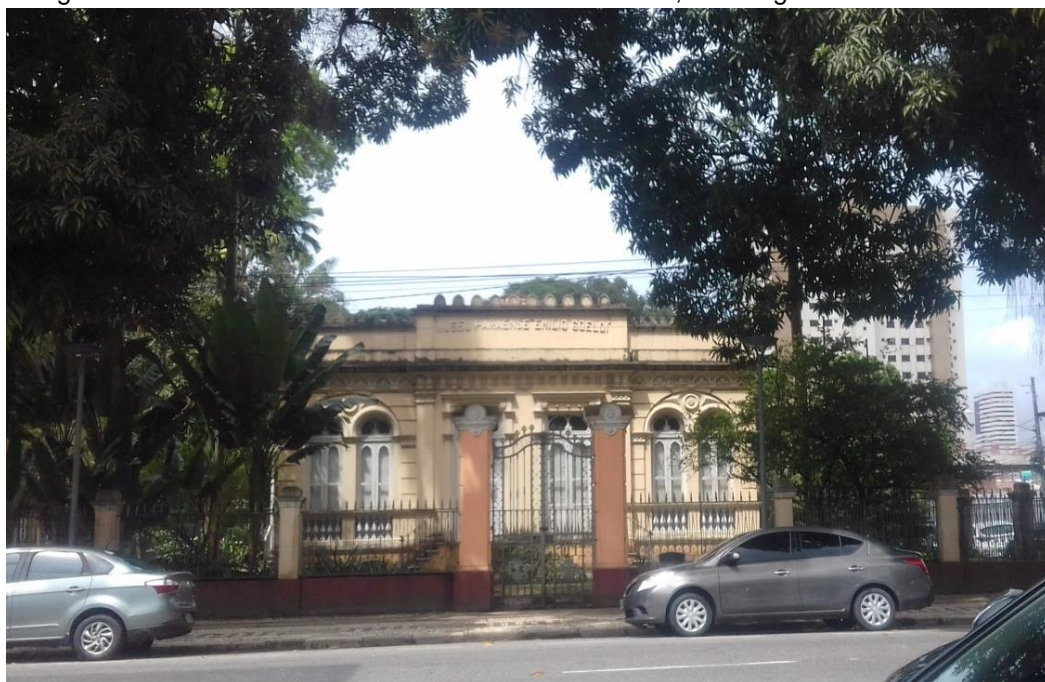
Fotografia 1 – Biblioteca de Ciências Clara Maria Galvão, Av. Magalhães Barata.

ônibus em grupos com seus devidos professores responsáveis. Pesquisadores e o público em geral também fazem visitas e são recebidos por monitores do Museu (estagiários e jovens aprendizes de nível médio) que apresentam a fauna e flora do parque, chegando na biblioteca, os estagiários de biblioteconomia e a bibliotecária ou mesmo os profissionais que atuam na mesma, apresentam a biblioteca e mostram os projetos, produtos e serviços que a biblioteca dispõe.