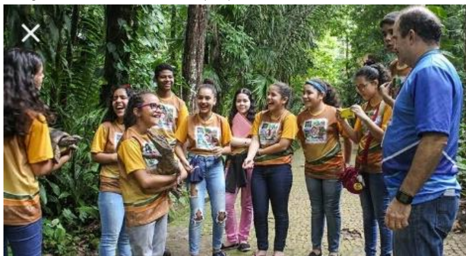
Fotografia 11– Aulas do Clube no parque zoobotânico