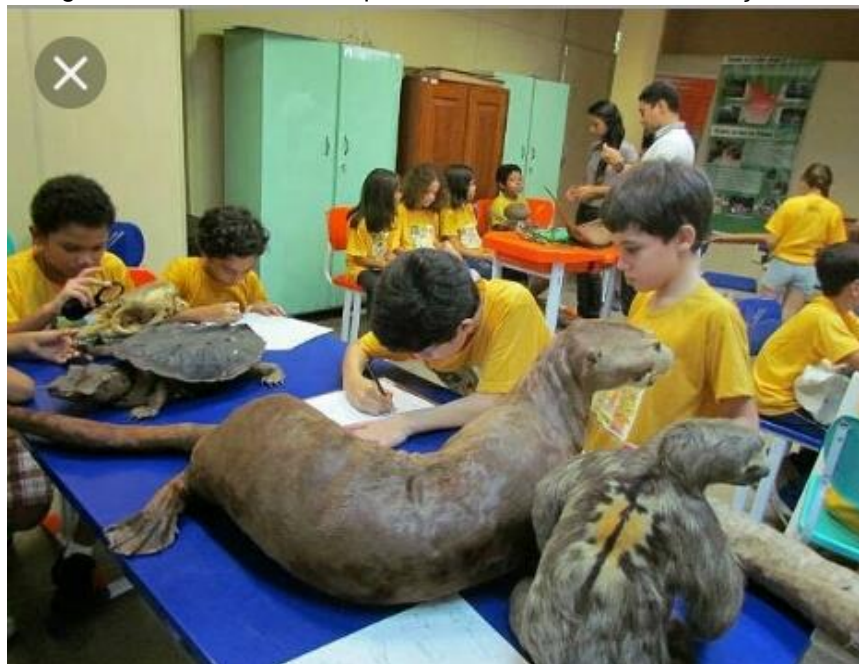
Fotografia 14 – Clube do Pesquisador Mirim estudando a coleção