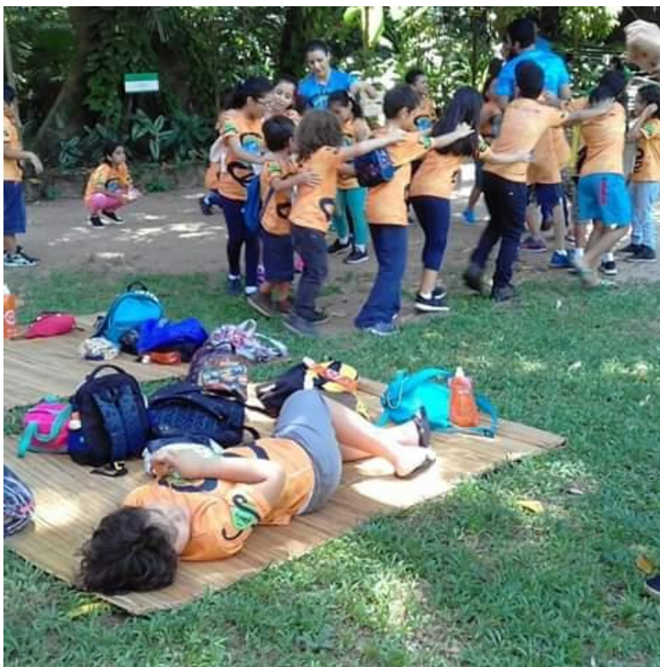
Fotografia 6 – Expedição de férias, atividades lúdicas com as crianças