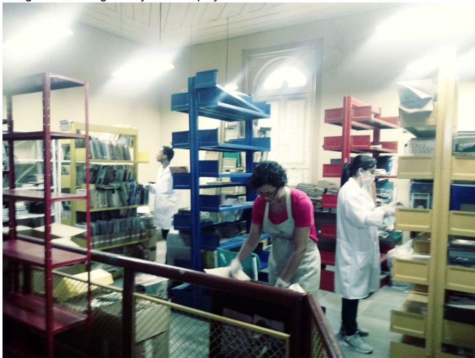
Fotografia 2 – Organização do espaço da biblioteca