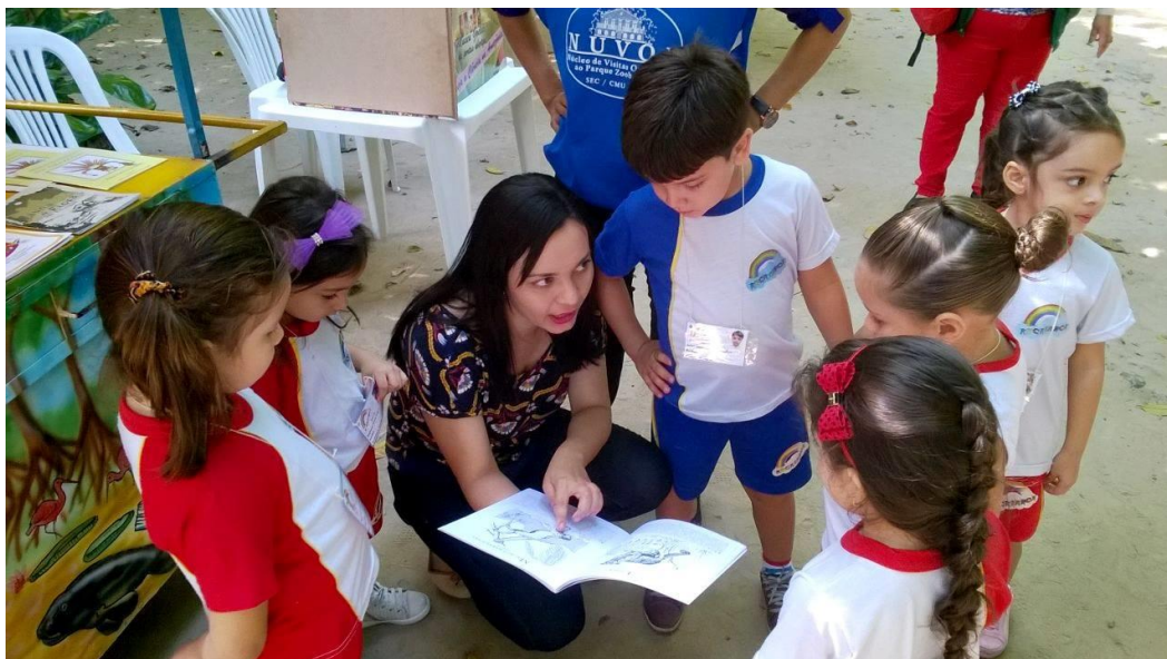
Fotografia 15 - Evento Museu de Portas Abertas, mediação de saberes com o público infantil no carrinho da leitura (Parque Zoobotânico)

Estas mediações no carrinho da leitura com as crianças, na Fotografia 15, instigavam as mesmas a fazer a conexão dos animais mostrados nas cartilhas ambientais com os animais do parque, as crianças entendiam que aquelas características descritas na cartilha sobre a onça pintada eram as mesmas que elas haviam visto quando visitaram o recinto da onça, por exemplo, no Parque.