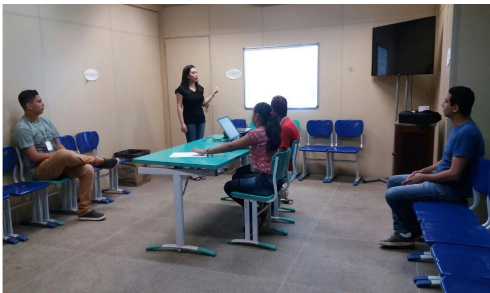
Fotografia 4 - Oficina de elaboração de textos oficiais: memorando, carta-convite e ofício

Na Fotografia 4 é apresentado, por meio da Oficina de textos Oficiais, o laboratório de experiências, ideia esta criada pela então gestora da biblioteca, deste ano. Este laboratório consistia em ações elaboradas pelos próprios estagiários que com seus conhecimentos de suas formações acadêmicas compartilhavam com os demais estagiários informações necessárias que melhoravam suas atuações profissionais e enriqueciam suas formações. Este laboratório foi de extrema importância para a desenvoltura dos que dele participaram, melhorando a oratória e agregando conhecimentos acerca do que era estudado previamente para as apresentações. A criatividade e a pro atividade também foram trabalhadas nesta ação, uma vez que os temas propostos podiam ser livres, a critério dos participantes.