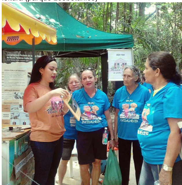
Fotografia 9 - Evento Museu de Portas abertas, mediação desaberes com os idosos no carrinho da leitura (parque zoobotânico)

A mediação no carrinho da leitura com os idosos, como mostrado na Fotografia 9, fez com que os mesmos tomassem conhecimento das bibliografias da biblioteca que possuem informações da fauna e flora do parque e da Amazônia em geral, alguns ganharam alguns exemplares das cartilhas ambientais e levaram para seus familiares, foi uma forma de disseminar o conhecimento para um público experiente.