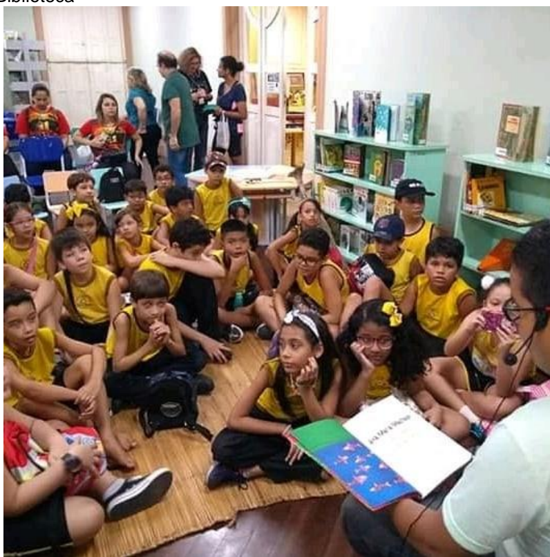
Fotografia 3 - Contação de histórias / Inauguração da reabertura da Biblioteca

As diversas programações oferecidas no museu: treinamentos e rodas de conversas contribuem para o entendimento do universo da biblioteca, que tem como característica ser um ambiente de aprendizados, consultas ao acervo, interação com as demais áreas do conhecimento por meio de palestras, seminários, e todo tipo de atividade (Fotografia 3) que não se limitam a serem realizadas dentro da biblioteca, mas no Parque Zoobotânico em que ela se encontra.