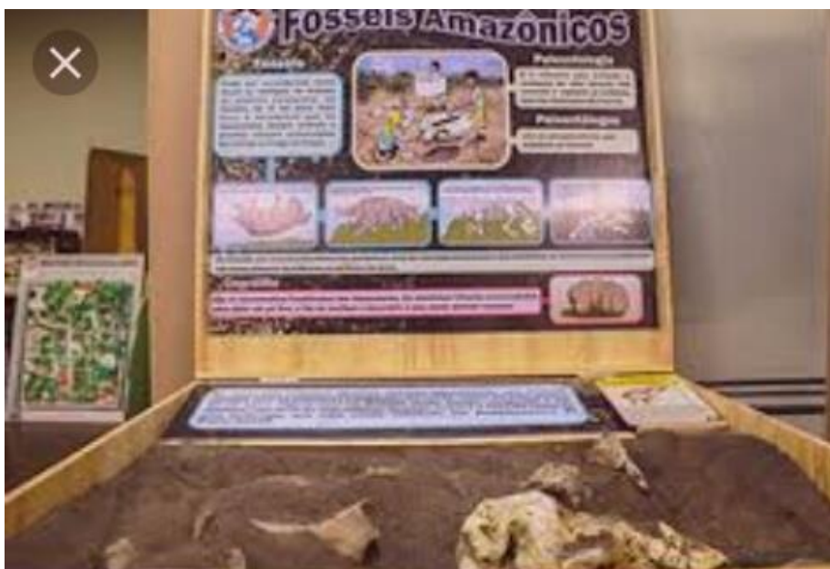
Fotografia 13 – Kit do Clube do Pesquisador Mirim