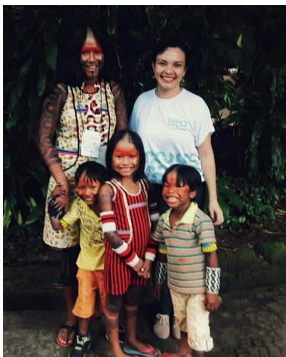
Fotografia 10 – Abertura da Exposição “Os Kayapó e Yairati. Saberes e lutas compartilhadas”.

A mostra Os Kayapó e Yairati: saberes e lutas compartilhadas, recebeu os indígenas Kayapó para prestigiarem a abertura da exposição no prédio Rocinha (Fotografia 10).