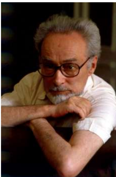
Figura 1: Primo Levi