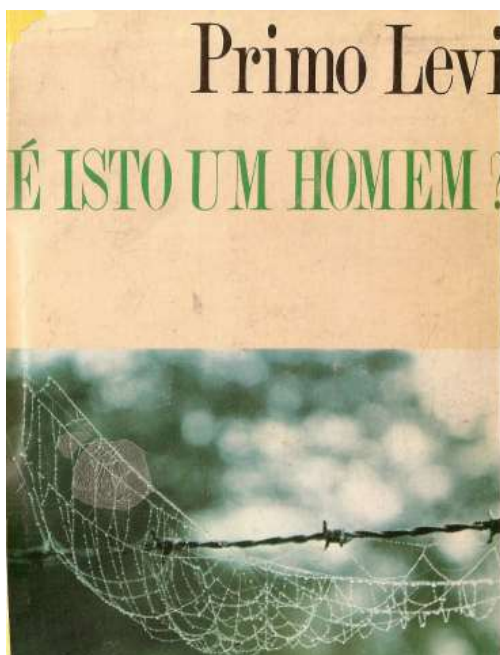
Figura 2: Capa do livro É isto um homem?