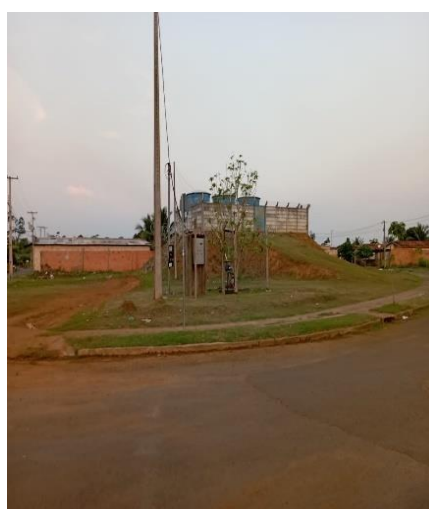
FIGURA 3 - EMEIF Ideal, única Escola no RUC Água Azul, quadra de esporte, caixas d'água

Segundo Dona Ivani Dias, todos esses itens básicos deveriam ter sido fornecidos pela Norte Energia assim que o bairro foi planejado: