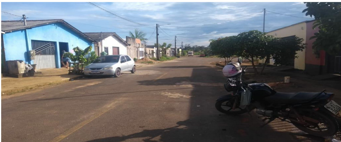
FIGURA 2 - Reassentamento Urbano Coletivo (RUC) Água Azul.

O Reassentamento Urbano Coletivo (RUC) Água Azul conta com 807 residências, possui casas padronizadas com 2 quartos, sala, suíte, banheiro social, varanda e área de serviço. Sobre as unidades de ensino básico, possui somente um colégio de ensino fundamental, sendo que os moradores que precisam do ensino médio têm que se deslocar para o RUC Jatobá, o que se torna muito perigoso, uma vez que, segundo os moradores, o índice de violência nesses RUCs é bastante alto. Além disso, há uma quadra de esporte, geralmente utilizada por jovens para prática de futsal; um barracão que não está sendo utilizado por motivo de os moradores se queixarem de o presidente do bairro não ser de seus agrados. Fatidicamente, o bairro não possui posto de saúde, assim, os moradores se dirigem a outros bairros ou ao posto de saúde do reassentamento Jatobá que se encontra mais próximo quando precisam de atendimento médico. O RUC Água Azul também não possui creche e as mães que possuem filhos pequenos e precisam trabalhar se dirigem ao RUC Jatobá em busca de vaga, quando tem.