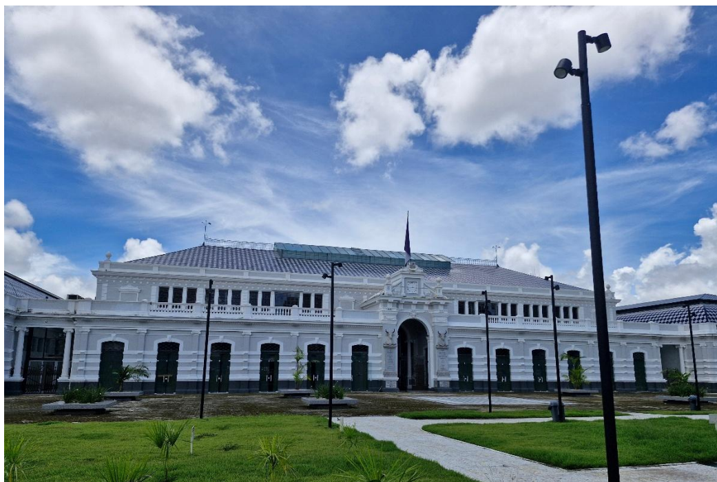
Figura 1 – O novo Mercado de São Brás.