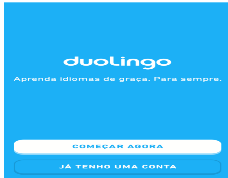
Fuente: Aplicación Duolingo

El estudiante elige el idioma que desea aprender y si desea o no hacer la prueba de nivelación, el usuario debe elegir cuánto tiempo diariamente desea dedicar al estudio del idioma escogido.