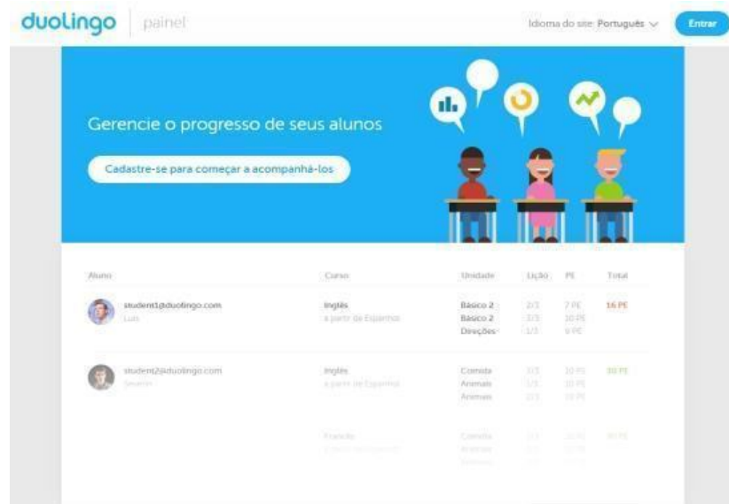
Figura1- Clase virtual