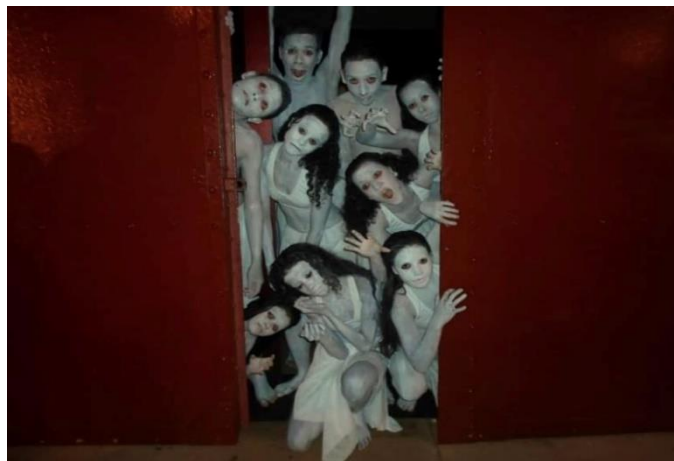
Figura 7 – Elenco de 'Butoh' pós-apresentação.