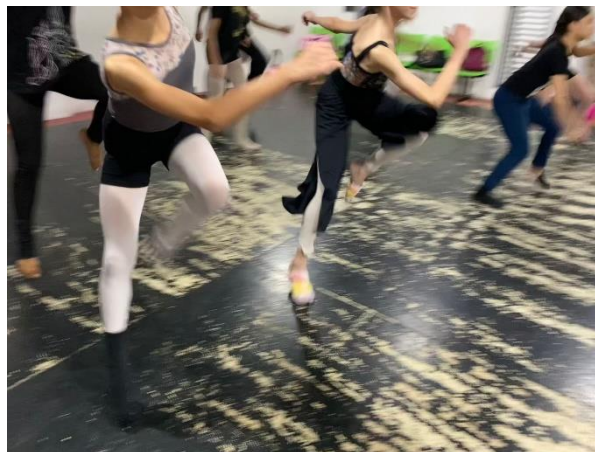
Figura 4 - Experimentações em sala.