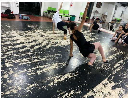
Figura 8 e 9 - Experimentações em grupo.

Neste raciocínio, torna-se longínqua a ideia, errônea, de que a dança não é ciência e não pode se encontrar em parâmetros metódicos e/ou planejados, como meios de uma práxis metodológica mais eficaz e contínua. Tais levantamentos por uma pequena falta de disponibilização para que se possa observar que ambas as categorias (planejamento e liberdade criativa) precisam trabalhar em equilíbrio para que um trabalho de excelência de fato exista ali, tanto para o ambiente o qual entenderá esta arte, por outro ponto de vista quanto para a própria arte, que terá mais bases e procedimentos que apenas articulem e contribuam com todos estes processos em sala de aula de maneira coerente e concisa.