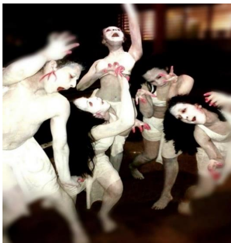
Figura 3 – Butoh na Estação das Docas.