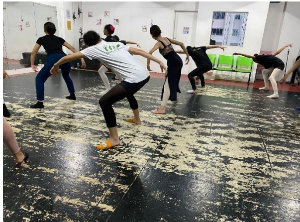
Figura 5 – Exercícios em sala de aula.