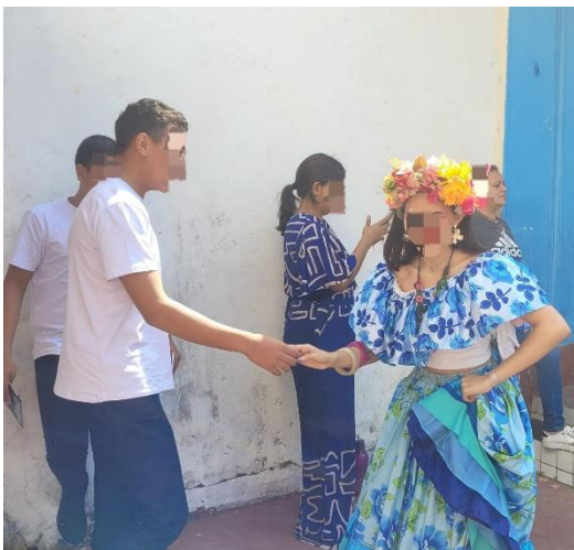
Figura 2: socioeducando e integrante do grupo de carimbó.