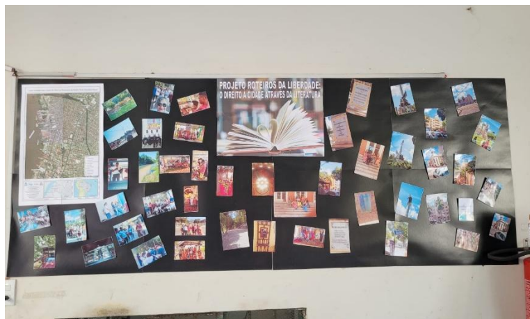
Figura 3: mural das aulas de campo, produzidos pelos alunos.