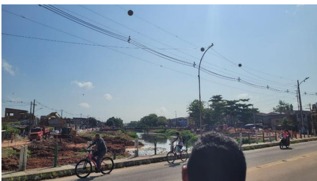
Figura 6: Canal no Bairro do Barreiro.