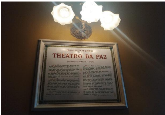
Figura 10: Teatro da Paz (registrado feito pelo aluno)