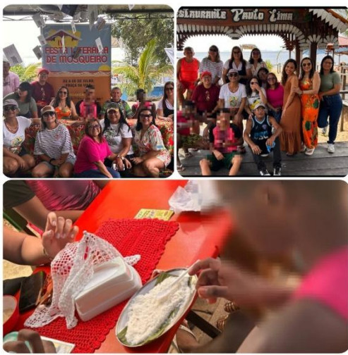
Figura 8: Ilha de Mosqueiro.