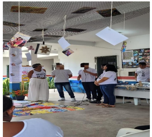
Figura 11: Exposição oral na Feira Literária.