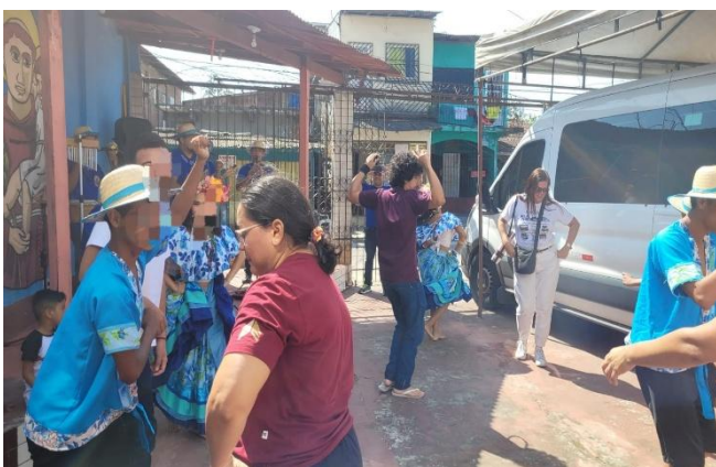
Figura 4: Roda de carimbó com os participantes da aula de campo