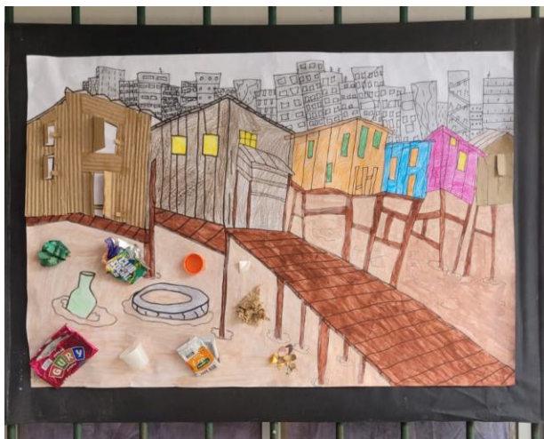
Figura 12: Ilustração de áreas do Bairro do Barreiro, produzido pelos alunos.