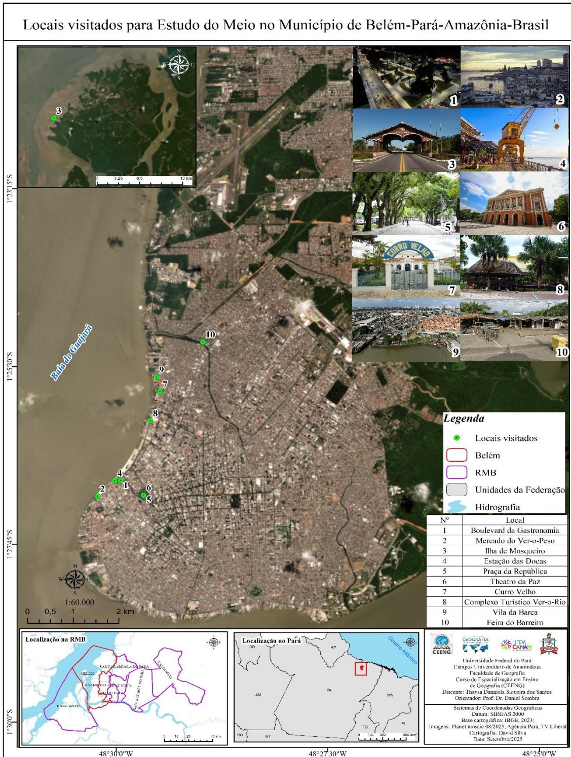
Figura 1: Carta-imagem de localização dos lugares visitados durante as aulas de campo.