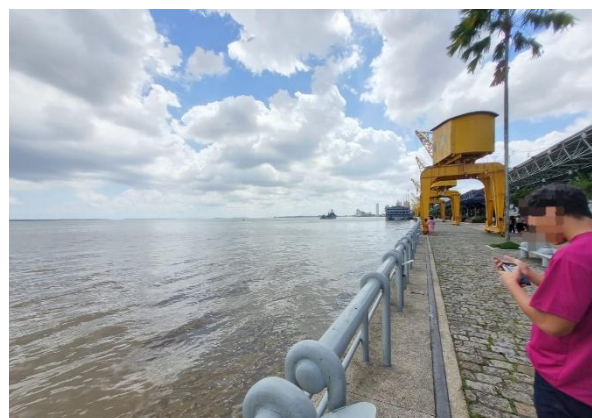
Figura 7: Estação das Docas