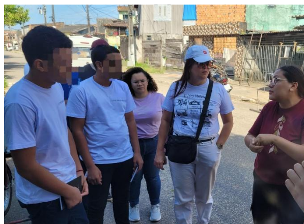
Figura 5: Aula de campo no Bairro do Barreiro