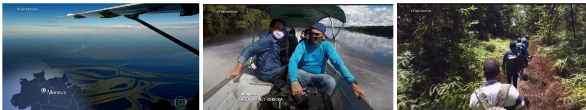
Imagem 4 – Sequência narrativa da reportagem sobre ação do Greenpeace

focando bastante no itinerário comprido para chegar até a aldeia, com uma abundância de imagens da floresta e dos rios.