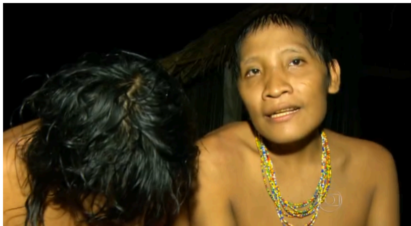
Imagem 2 – Reportagem sobre etnia Awá no noroeste do Maranhão

Então Bette continua a descrever Irohoa: “Pela primeira vez uma equipe de televisão foi autorizada a chegar tão perto de um índio que, até alguns dias atrás, nunca havia feito contato com a civilização” (Imagem 2). A descrição das comunidades indígenas no telejornal se estabelece em uma relação desproporcional entre a lógica do “Eu” civilizado e do “Outro” animalesco (Hall, 2016). No mundo das representações, Hall (2016, p. 335) vai nos mostrar que essa lógica chega ao Novo Mundo com a expansão e exploração dos europeus, que utilizaram da própria cultura e ideias para descrever os povos que viviam do outro lado do Atlântico. Dessa forma, podemos perceber o exercício de poder com o discurso que narra o indígena como algo “diferente”.