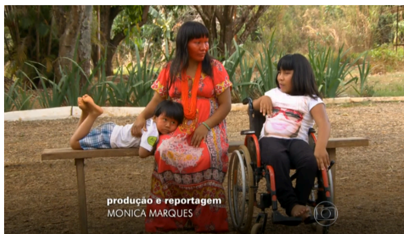
Imagem 3– Reportagem sobre o infanticídio em terras indígenas

Tratando-se de narrativas sobre pessoas indígenas, o jornalismo hegemônico tenta sempre oferecer a ideia de dar visibilidade ao assunto e às pessoas indígenas. No caso da reportagem exibida em 07 de dezembro de 2014 com a temática do infanticídio em aldeias indígenas de Roraima e do Amapá, há sempre a articulação de pôr as crianças indígenas como vítimas que precisam de proteção de um monstro cruel (Imagem 3). Histórias invisíveis que o jornalista tem como objetivo tornar visível (Costa, 2022). “Mas, ao dizê-lo como ‘invisível’ e trazê-lo à visibilidade, termina por invisibilizá-lo ainda mais” (Costa, 2022, p. 204).