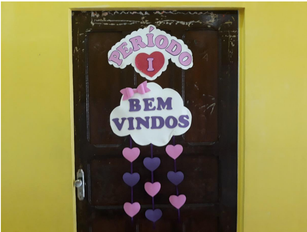
Imagem 7: Sala Período I.