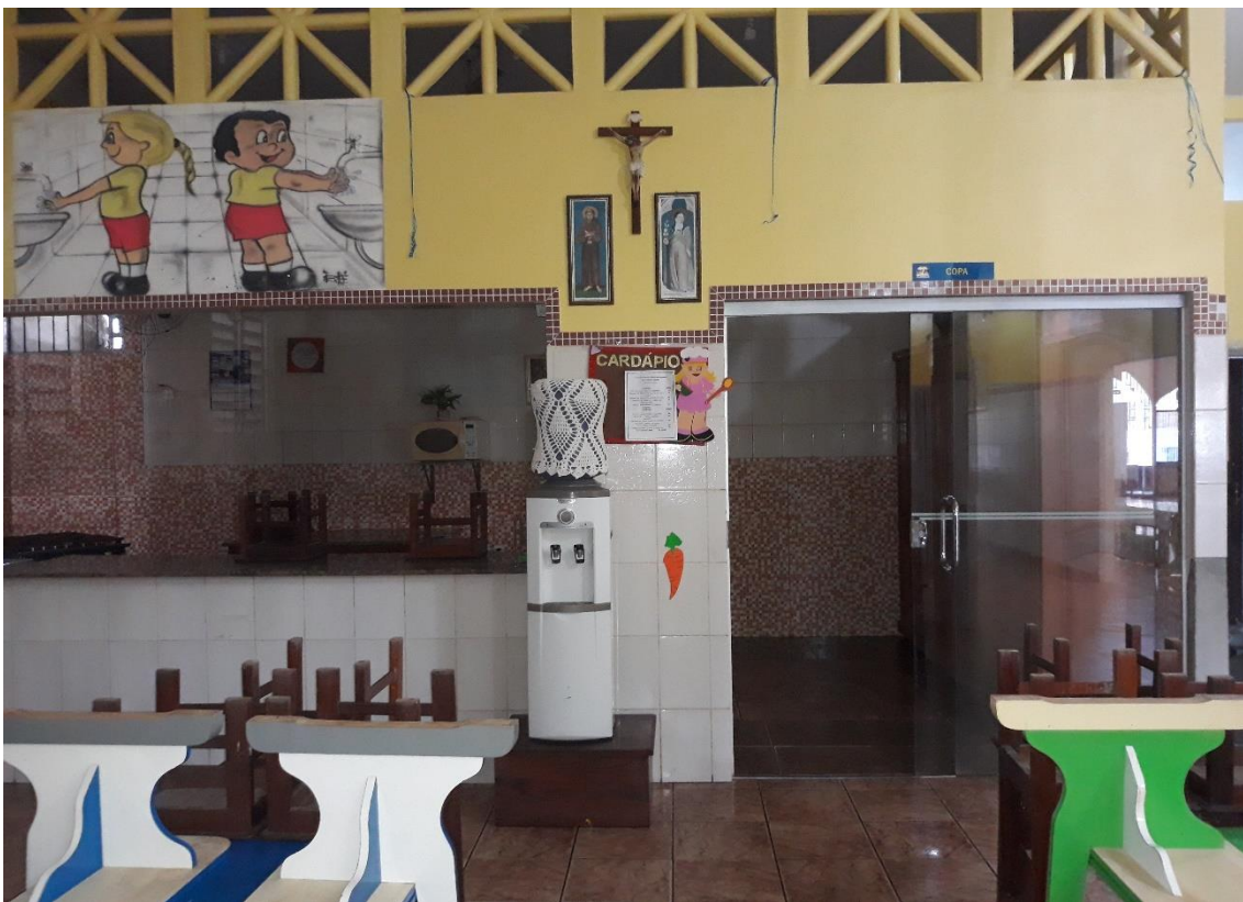
Imagem 19: Copa