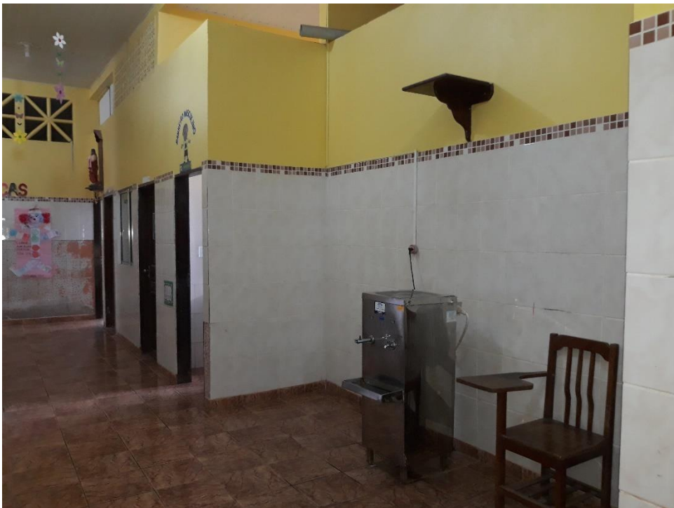
Imagem 14: Corredor para ida ao bloco seguinte.