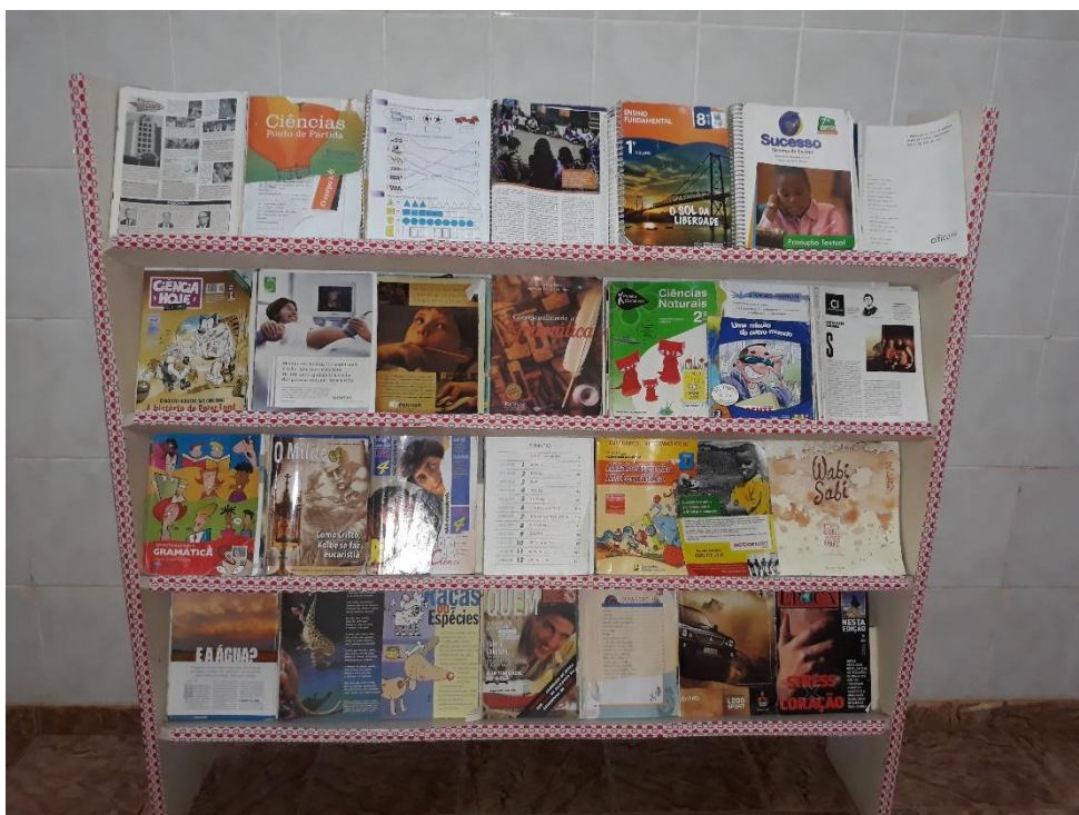
Imagem 16: Estante presente no corredor.