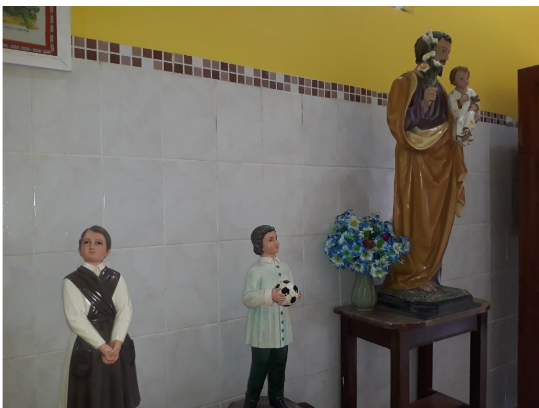
Imagem 21: Santos presente no corredor.