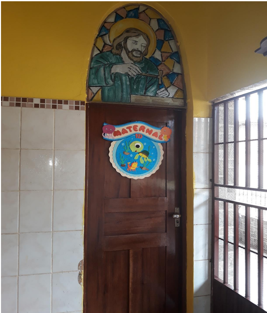
Imagem 22: Maternal I “D”