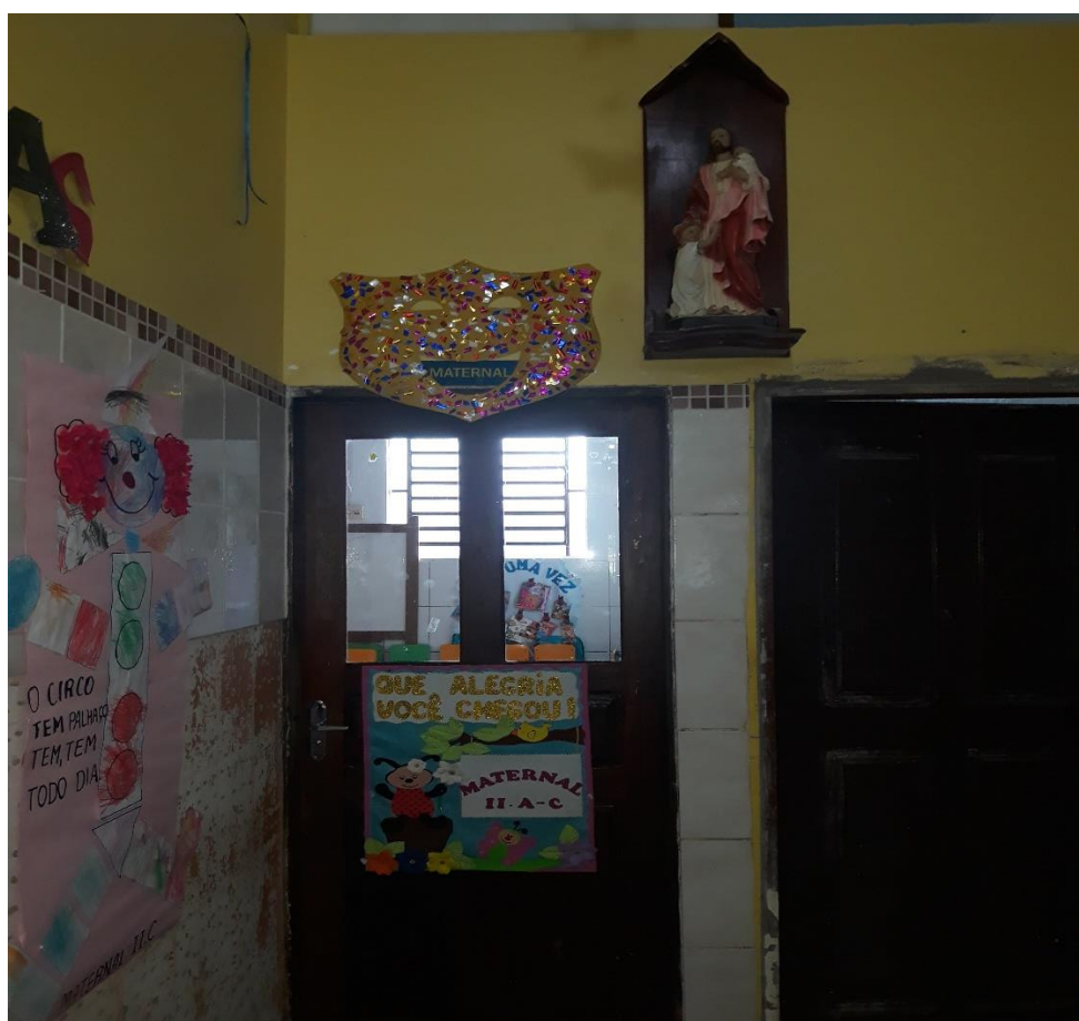
Imagem 17: Maternal II “A e C”.