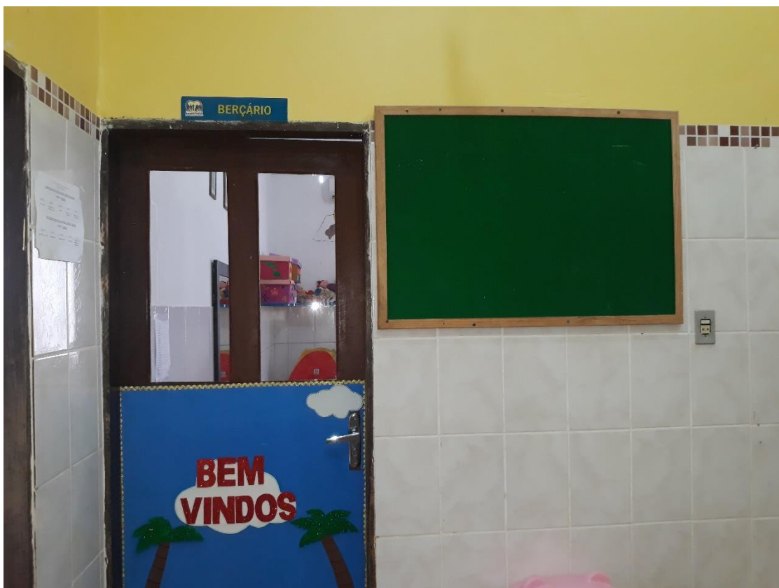
Imagem 10: Sala Berçário