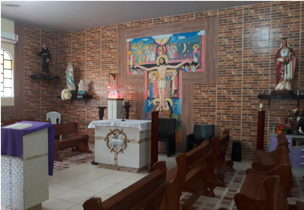
Imagem 23: Capela