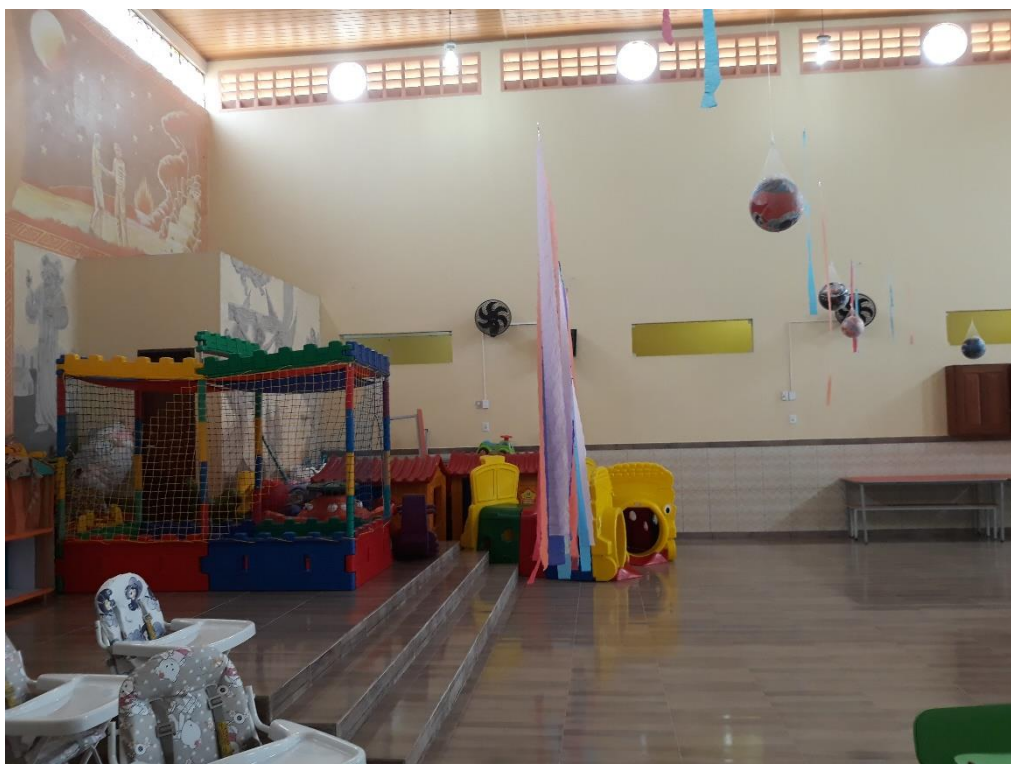
Imagem 27: Salão da brinquedoteca