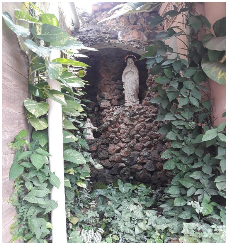
Imagem 2: Santa presente na entrada do corredor da instituição.