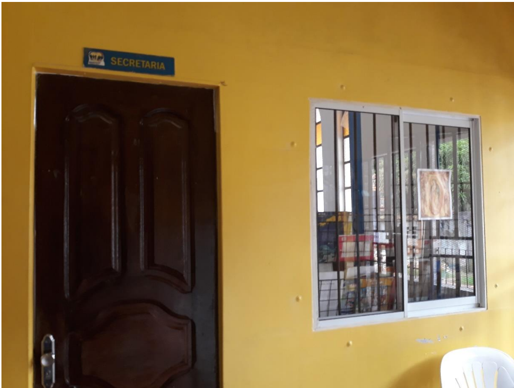
Imagem 5: Secretaria/Diretoria