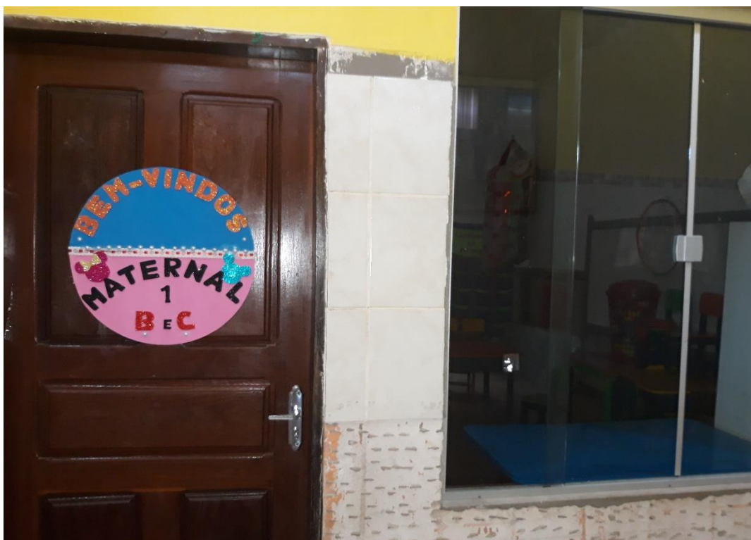
Imagem 20: Sala Maternal I “B e C”