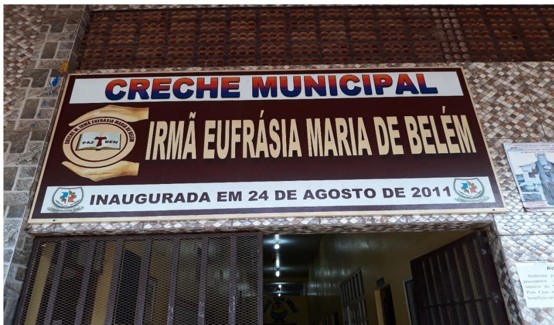
Imagem 01 – Entrada da Creche Municipal Irmã Eufrásia Maria de Belém