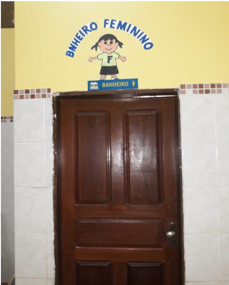
Imagem 13: Banheiro Feminino