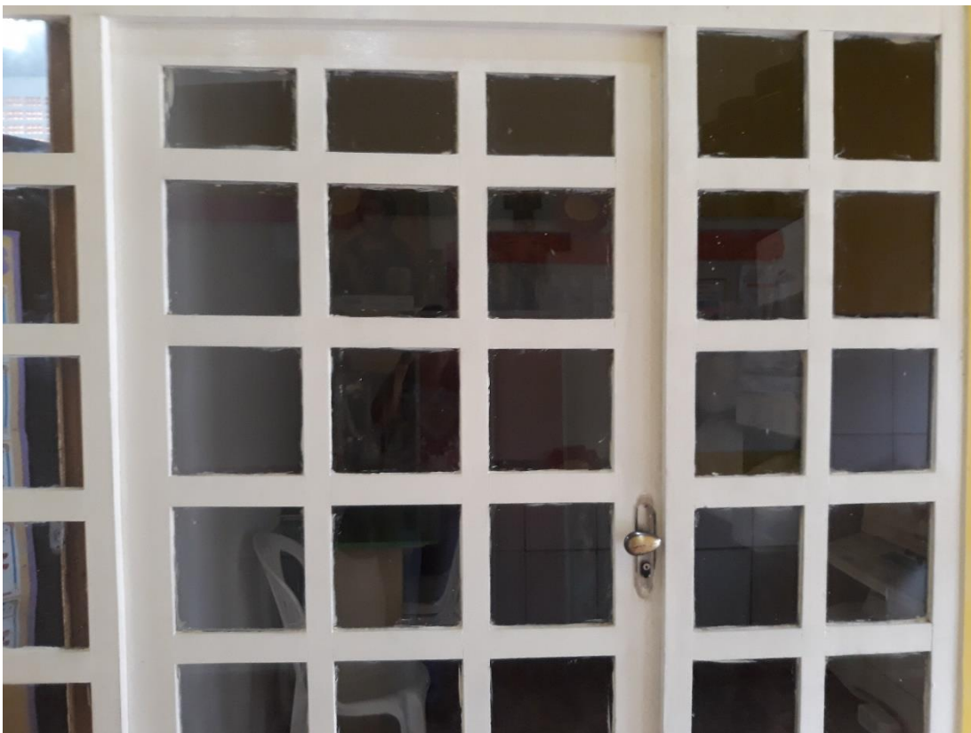
Imagem 6: Ponto para venda de artigos religiosos.