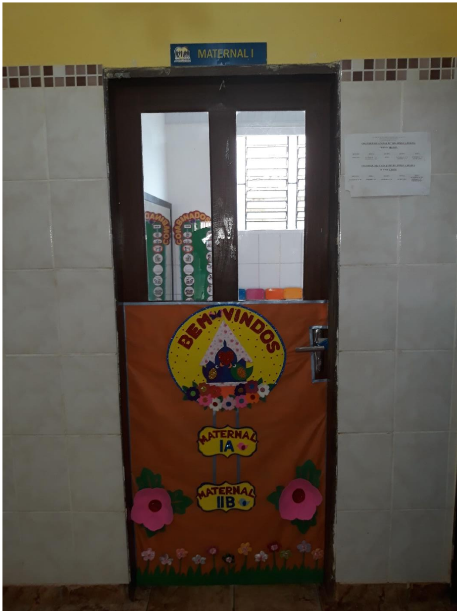
Imagem 11: Sala Maternal: I “A”- Manhã/ II “B”-Tarde