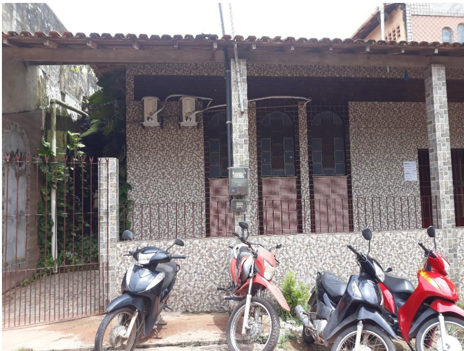
Imagem 1: Frente Creche Irmã Eufrásia Maria de Belém