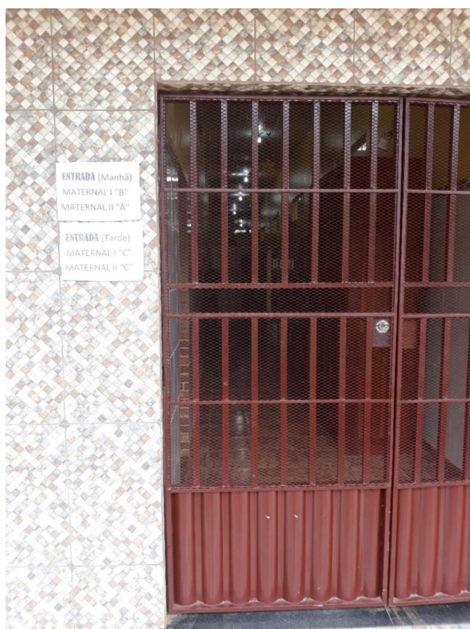
Imagem 4: Entrada “B” Manhã: Maternal I “B” Maternal II “A” Tarde: Maternal I “C”, Maternal II “C”.