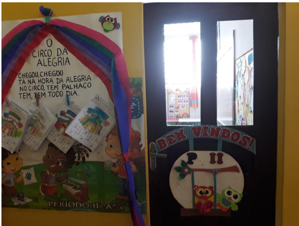
Imagem 8: Sala Período II.