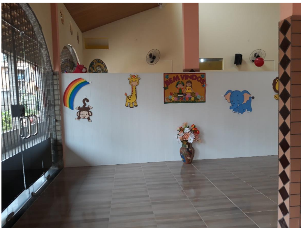
Imagem 26: Brinquedoteca