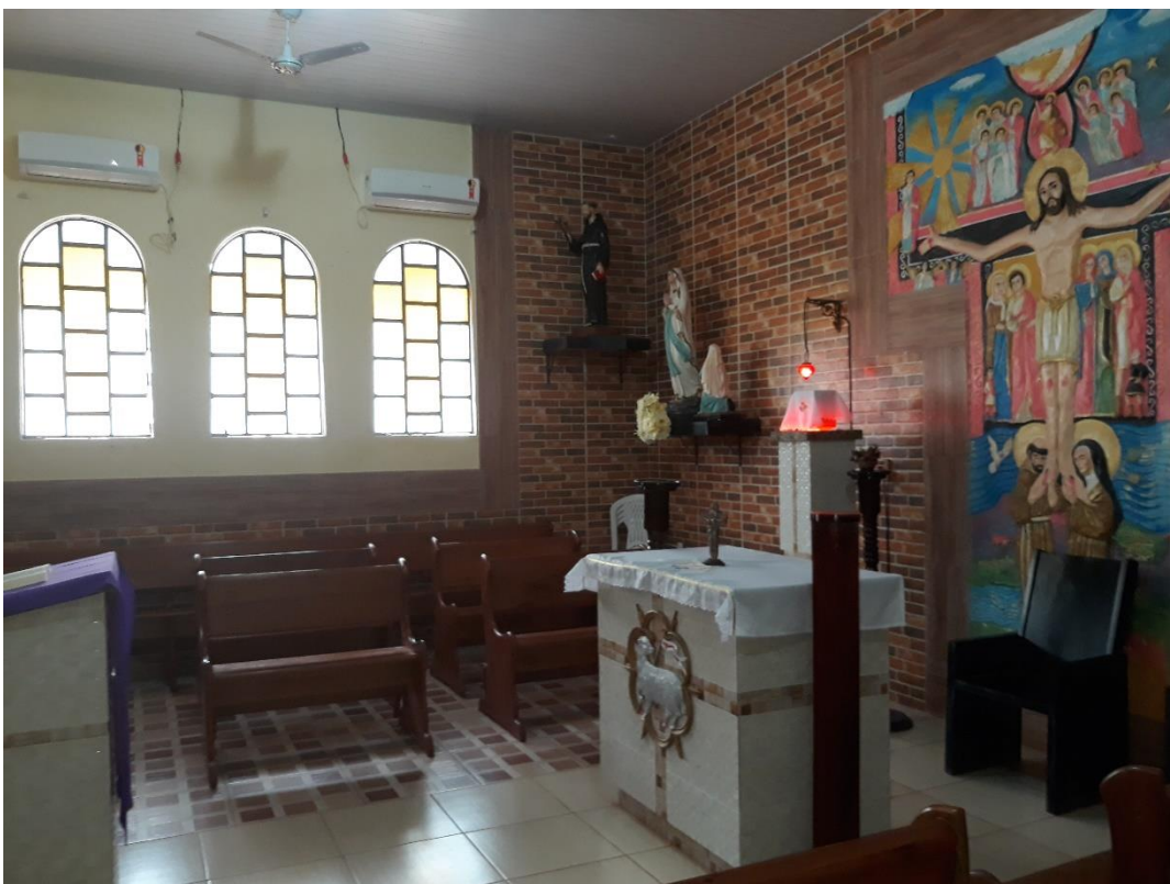
Interior da Capela