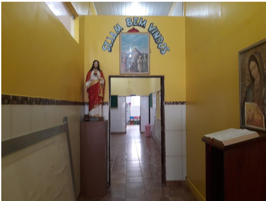
Imagem 9: Corredor para a entrada na parte do berçário e demais maternais.