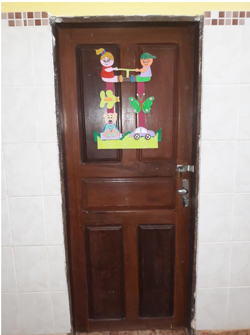
Imagem 12: Local de armazenamento de alimentos.