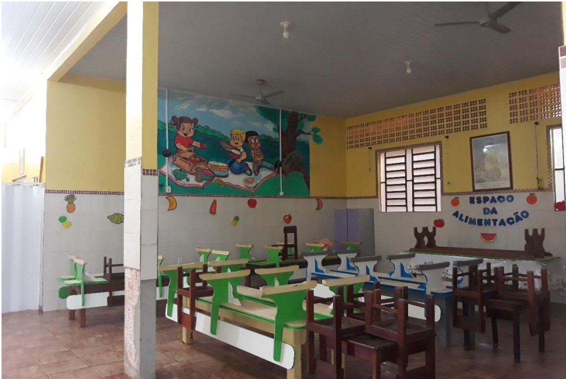
Imagem 18: Entrada Espaço da Alimentação