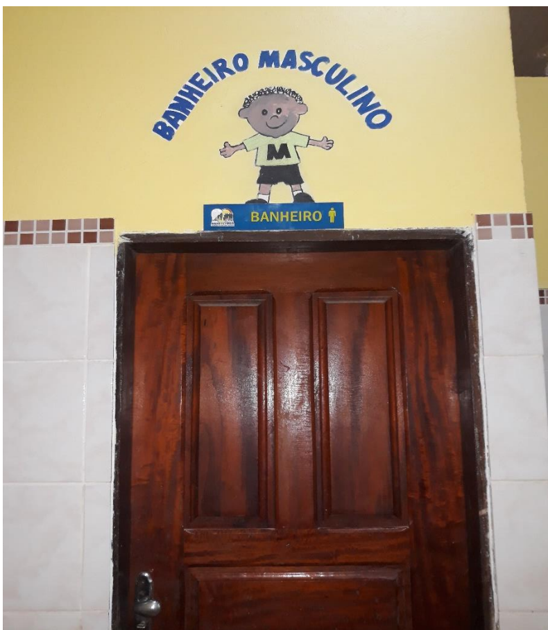
Imagem 15: Banheiro Masculino