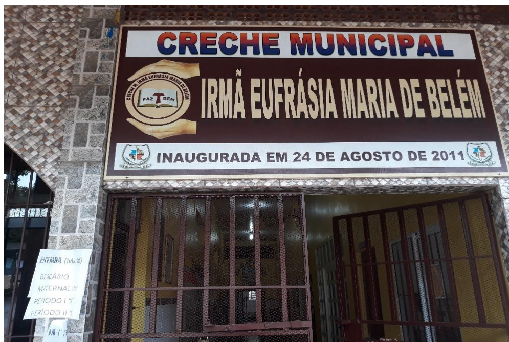
Imagem 3: Entrada “A” Berçário, Maternal I, Período I e Período II.