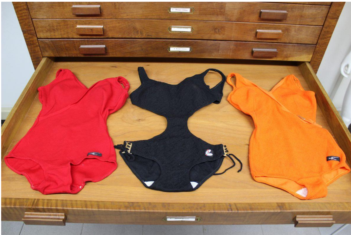
Imagem 9: Coleção de maiôs retrós