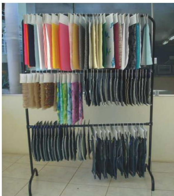
Imagem 8: Distribuição das bandeiras

Após o processo de catalogação os itens são preparados para serem disponibilizados aos usuários, sua disposição deve ser feita de acordo com o tipo do item em questão. Com os tecidos, as bandeiras recebem uma etiqueta e um suporte geralmente de papelão, e um cabide e são penduradas em araram móveis ou fixas, e são agrupadas por tipo de tecidos (imagem 8).