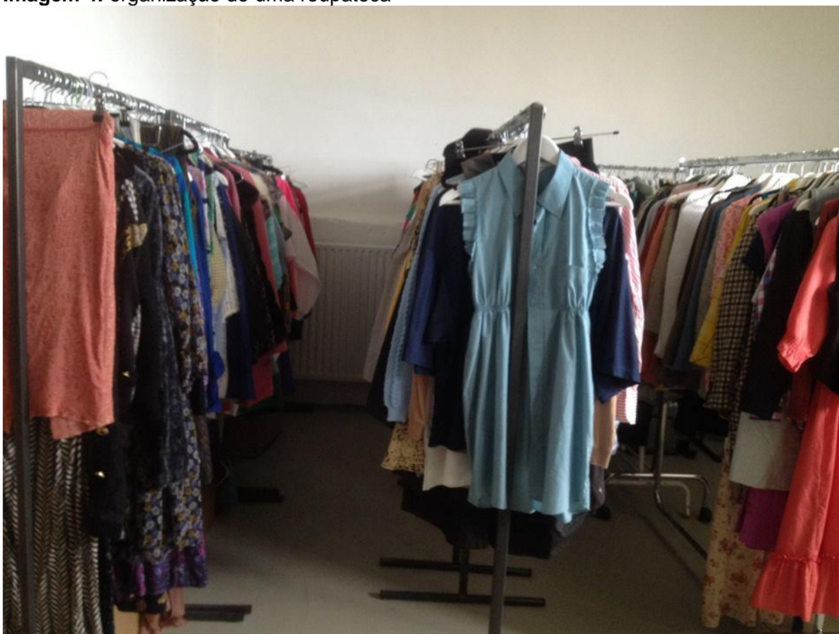
Imagem 4: organização de uma roupateca

Em visita a biblioteca Fashion Kleiderei localizada em na cidade de Hamburgo as principais falhas encontradas dizem respeito à organização do acervo que não é eficaz, comprometendo assim a recuperação das informações e a localização das roupas para serem encaminhadas ao empréstimo. Outra falha grave é a falta de funcionários e principalmente funcionários que estejam capacitados para fazer a organização e manutenção do acervo.