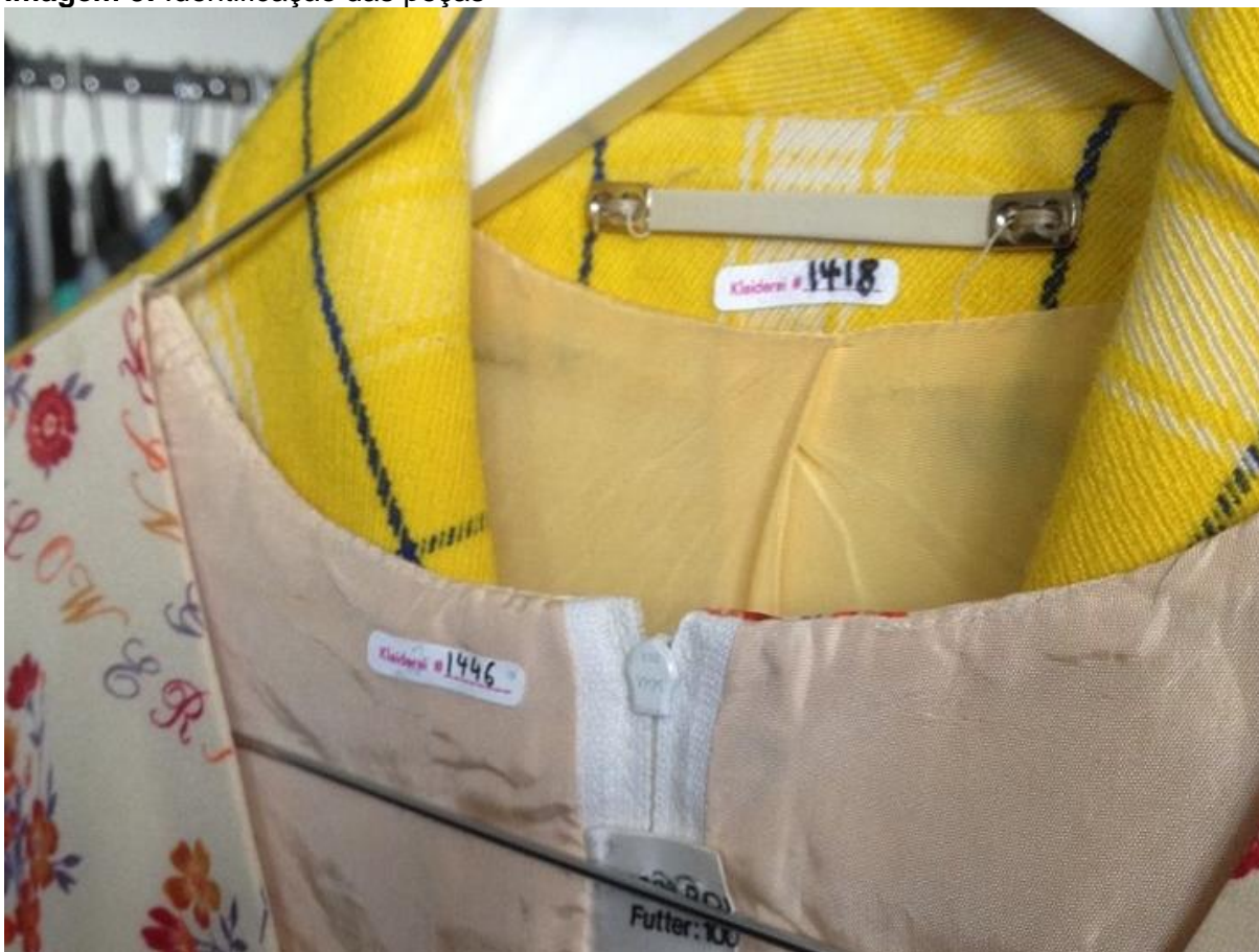
Imagem 5: Identificação das peças