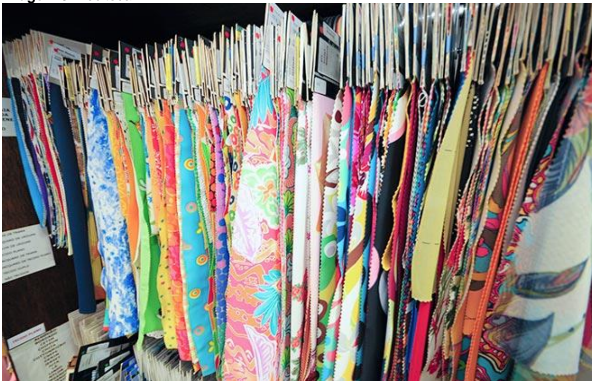
Imagem 3: Teciteca

De acordo com Costa (2006, não paginado) as tecitecas “nascem como um projeto de apoio ao ensino, limitadas muitas vezes às ações de coleta, catalogação e organização do material têxtil”.