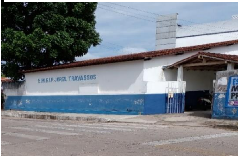
Figura 1 - Fachada Escola Jorge Travassos

e pessoas com necessidades especiais, de funcionários, quadra de esporte (inacabada e sem cobertura).