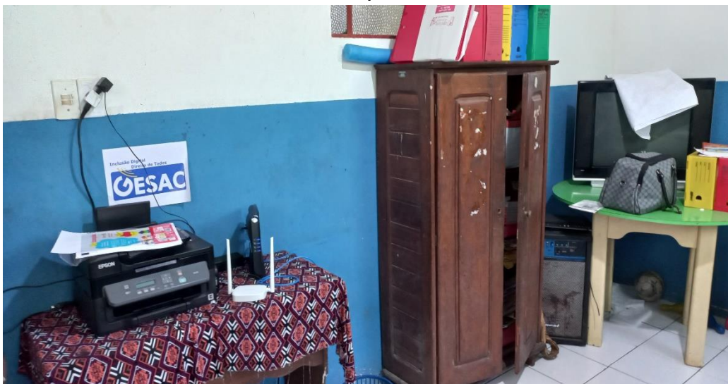
Figura 7 - Tecnologias disponíveis na escola.