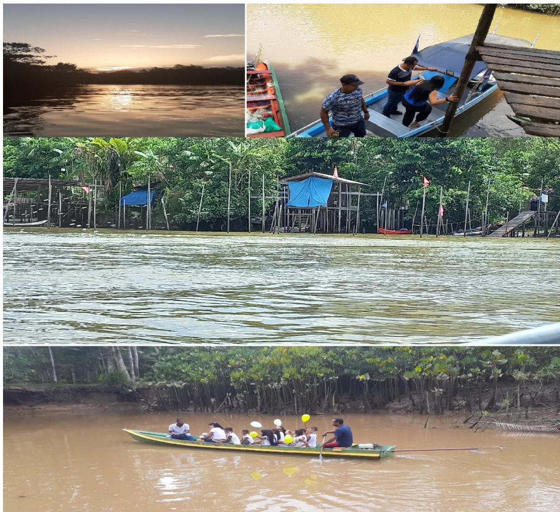
Figura 1 - Acesso para a Comunidade Quilombola do Rio Acaraqui.

Segundo o Instituto Brasileiro de Geografia e Estatística (IBGE, 2019) Considera-se agrupamento ou comunidade quilombola o conjunto de 15 ou mais indivíduos quilombolas em uma ou mais moradias contíguas espacialmente, que estabelecem vínculos familiares ou comunitários e pertencentes a Comunidades Remanescentes de Quilombos (CRQs), ou simplesmente Comunidades Quilombolas, que são grupos étnico-raciais, segundo critérios de autoatribuição, com trajetória histórica própria, dotados de relações territoriais específicas, com presunção de ancestralidade negra relacionada com a resistência à opressão historicamente sofrida, nos termos do Decreto n. 4.887, de 2003.