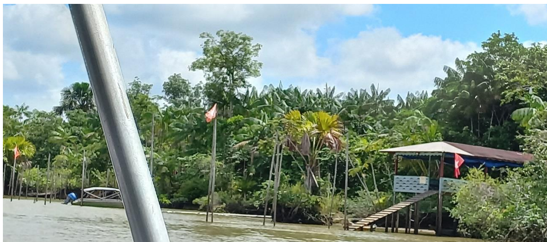
Figura 3 - Vegetação atual do quilomobo Alto Acaraqui.

A área da comunidade possui uma flora latifoliada (ver Figura 3) e uma das espécies em destaque era a samaumeira, as quais os moradores mais antigos faziam de abrigo. Contudo, muita riqueza da vegetação já foi extraída predatoriamente pelo homem para comércio, mas ainda se mantém algumas espécies. Castro (2012) esclarece que “[...] as atividades de extração predatória à superexploração de algumas espécies e o uso não manejável de algumas áreas contribuíram fortemente para o desequilíbrio ambiental”; isso explica porque, nessa comunidade, muitas espécies vegetais existem em pequenas quantidades em relação à flora original.