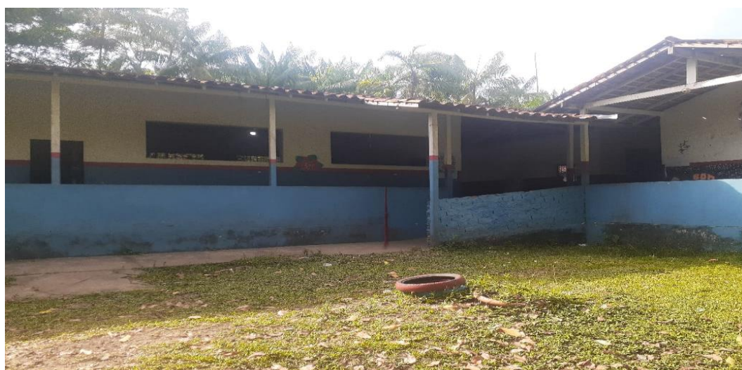
Figura 6 - Espaço da escola com acessibilidade.

As turmas são multisseriadas para as séries iniciais e o professor desenvolve o mesmo conteúdo para todos, apenas com o grau de dificuldade de acordo com a série de cada estudante (Figura 8) e o livro didático serve como atividade para casa. Mesmo depois do término da pandemia, na ocasião de nossa visita a comunidade, foi possível observar a falta de infraestrutura e recursos adequados na unidade. Todavia, para não deixar os estudantes sem aula, os professores usam de recursos próprios para elaborar, construir e produzir suas atividades e utilizam recursos da natureza para as aulas lúdicas.