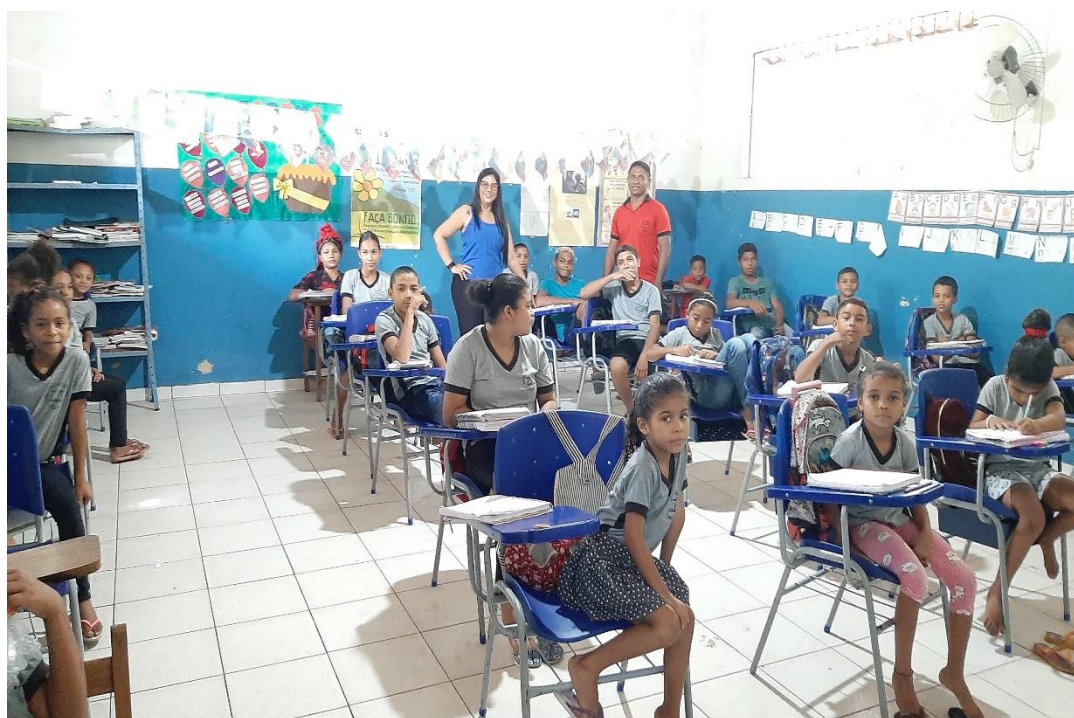
Figura 8 - Sala de uma turma de séries iniciais multisseriada.