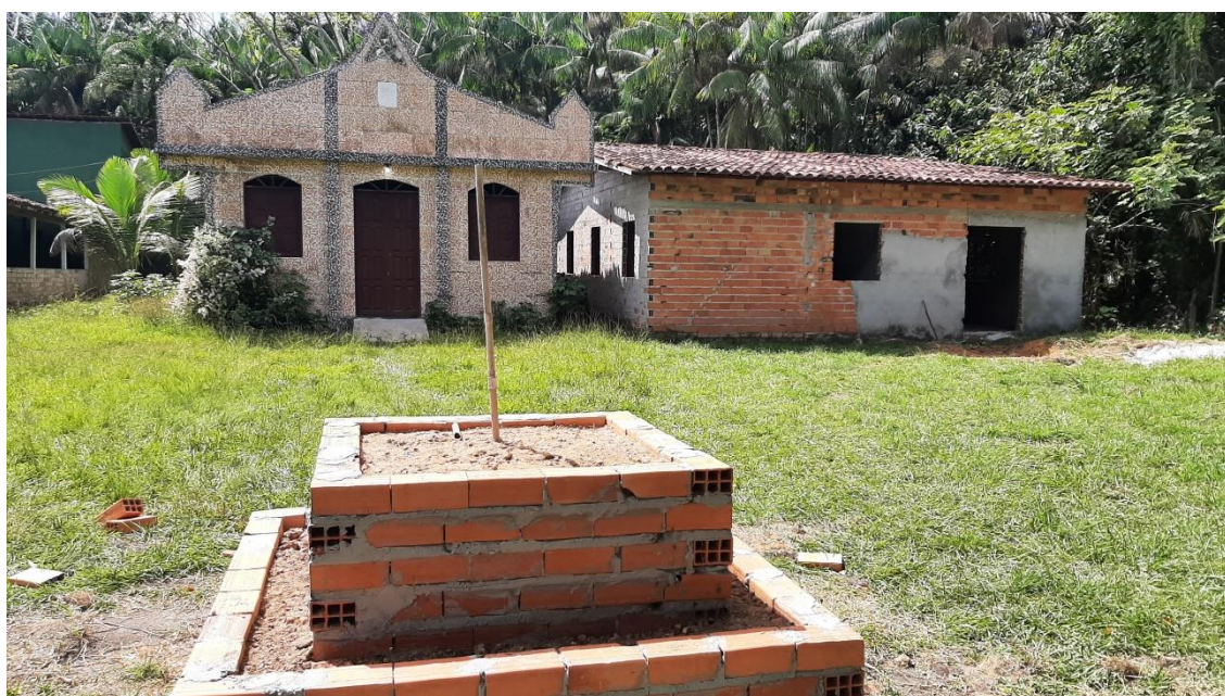
Figura 9 - Igreja católica da comunidade Alto Acaraqui.