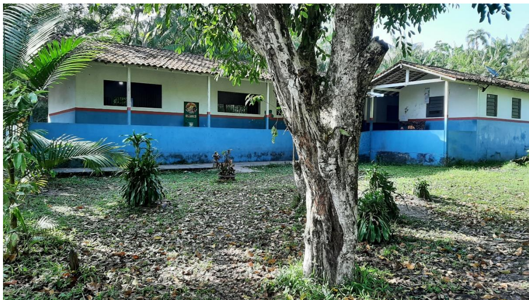
Figura 5 - EMEIF São Tomé do Alto Acaraqui.

pontos específicos distantes das casas ou dispor de uma antena para sinal de celular. Em relação o uso de tecnologias a escola possui uma copiadora e uma TV (Figura 7).