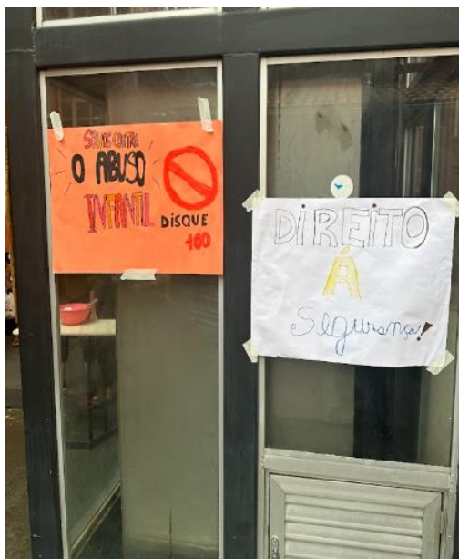
FIGURA 6 - Cartazes das Crianças