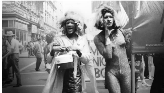
Figura 1 - Marsha P. Johnson e Sylvia Rivera

FONTE: A Morte e Vida de Marsha P Johnson de David France, 2017.