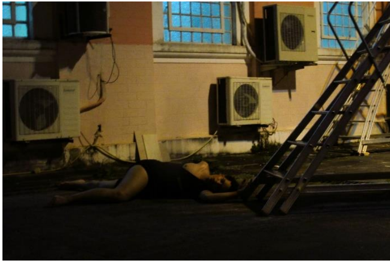
FIGURA 3 - Performance Caixa Preta