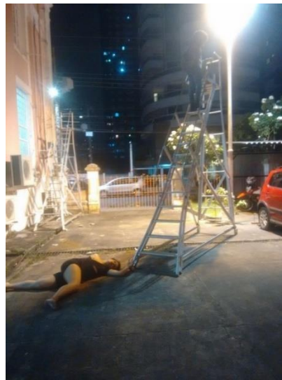
FIGURA 4 - A escada na Performance Caixa Preta