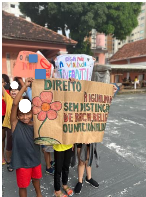
Figura 7 - Protesto do Teatro Juvenil