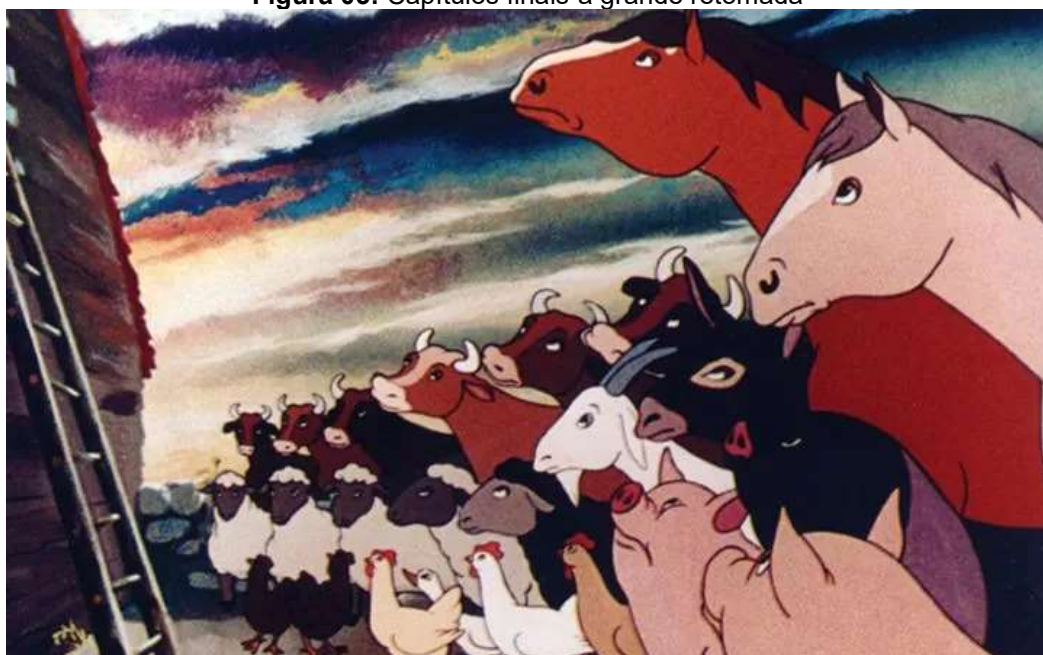
Figura 03: Capítulos finais-a grande retomada

Fonte: HALAS, John; BATCHELOR, Joy. Animal Farm . Reino Unido: Halas and Batchelor/United Artists, 1954. Fotograma do filme.