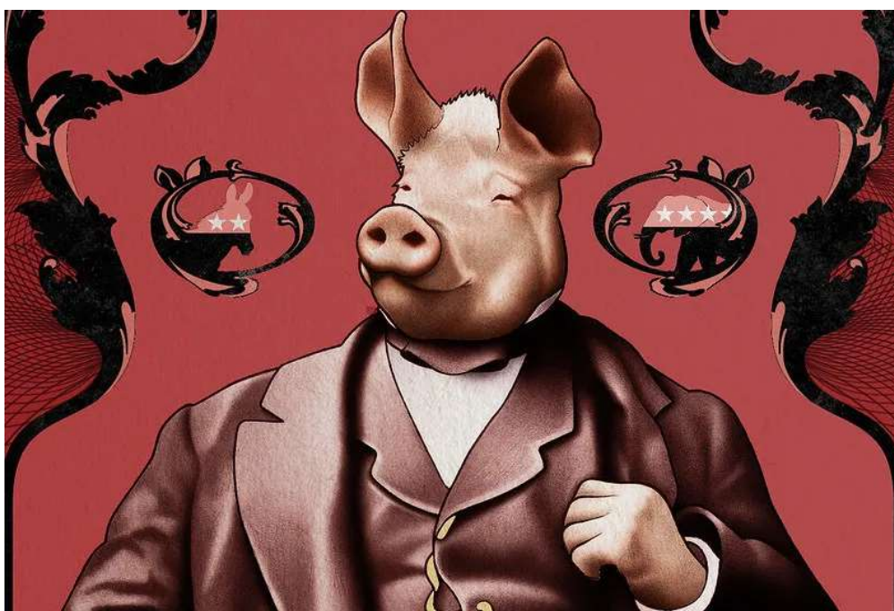
Figura 02- Crítica ao totalitarismo