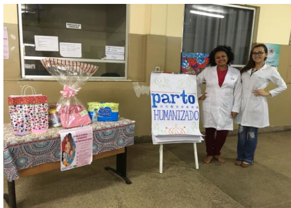
Imagem 3: Preparação para início da ação