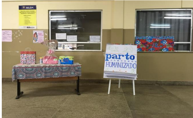
Imagem 1: Materiais de apoio