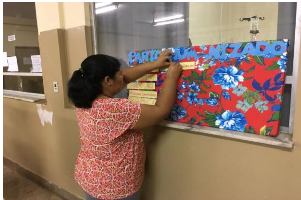
Imagem 2: Painel “Parto Humanizado”