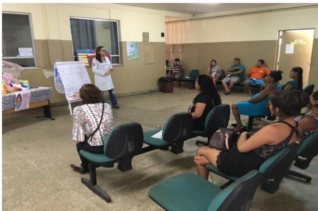
Imagem 4: Discussão sobre as diretrizes do MS