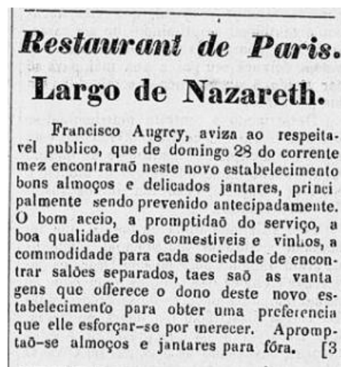
Figura 1 – Recorte de um anúncio de um Restaurante localizado no Largo de Nazareth

restaurante “as mais belas petisqueiras, preparadas a espera dos mais afinados apetites” 16 . Como visto, são diversos restaurantes que surgem na cidade de Belém e em municípios vizinhos, requintados e não requintados, o que evidencia que não eram somente os mais abastados que iam até esses estabelecimentos para comer.