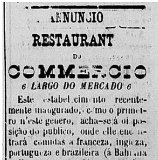
Figura 4 – Recorte de um anúncio sobre o Restaurante do Comércio