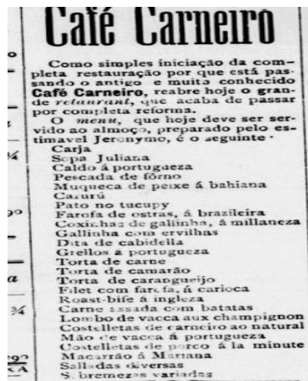
Figura 2 – Recorte do cardápio do Restaurante do Café Carneiro