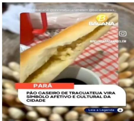
Figura 4. Vídeo sobre o pão caseiro de Tracuateua