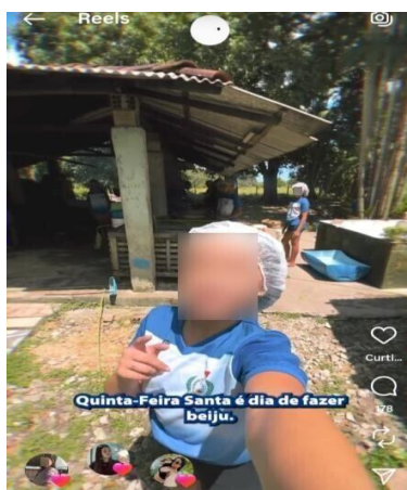
Figura 6. Publicação do vídeo sobre a produção do beiju.