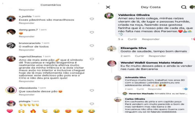
Figura 4. Comentários nas publicações