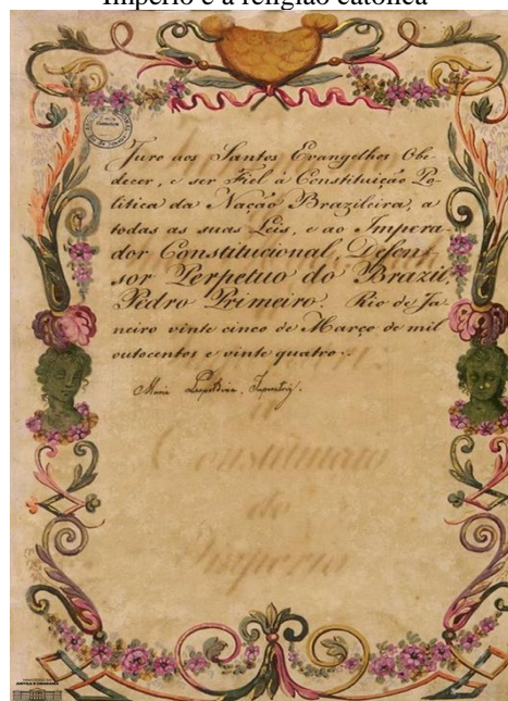
Imagem 6: Juramento da Imperatriz ao Império e à religião católica