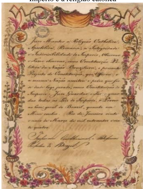
Imagem 5: Juramento do Imperador ao Império e à religião católica

Um aspecto importante, que comprova a extraordinária força e influência da Igreja Católica no governo do Império é o fato de que a Constituição determinava que todos podiam ser eleitores com exceção, entre outros, daqueles que não professassem a Religião do Estado, ou seja, a religião católica (art. 95, inciso III). Para além dessas medidas, a Constituição determinava que o Imperador, antes de ser aclamado, deveria jurar “manter a Religião Catholica Apostolica Romana”. Da mesma forma, seu herdeiro – ao completar 14 anos – e os Conselheiros de Estado – antes de tomarem posse – deveriam fazer o mesmo juramento.