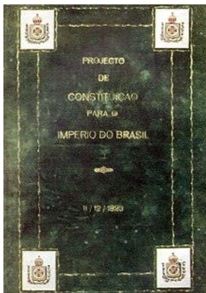
Imagem 4: Projeto de constituição do Império do Brasil

A presença do ensino de religião na legislação educacional do Império não pode prescindir de uma premissa importante: a de que seu fundamento era a própria Constituição do Império, outorgada por D. Pedro I em março de 1824. Nesta Carta a religião católica apostólica romana era estabelecida como a religião oficial do Império e, embora outras religiões fossem permitidas, estas o eram apenas em cultos domésticos ou particulares e “sem forma alguma exterior do Templo”. (Art. 5º).