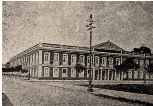
Imagem 7: Lyceu paraense