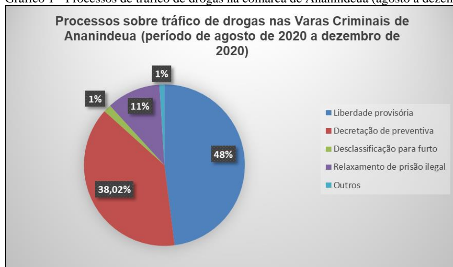
Gráfico 1 - Processos de tráfico de drogas na comarca de Ananindeua (agosto a dezembro de 2020)

O gráfico 1 demonstra os dados coletados abaixo: