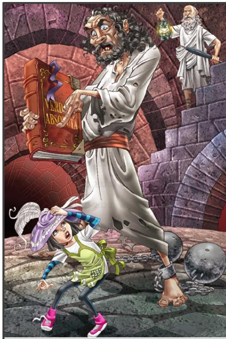
Figura 7: Alice, o Sábio Didi e a Verdade Absoluta