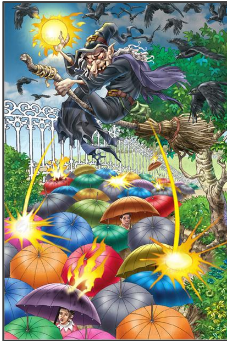
Figura 6: O ataque da Bruxa da Dúvida - Fonte: Bandeira (2016, p.73)

Na composição da figura 6, a imagem central da Bruxa da Dúvida aparece na parte superior com roupas escuras, rodeada por corvos e envolta numa atmosfera também escura, contrastando com as cores coloridas dos guarda-chuvas utilizados pelas verdades. O contraste entre cores opostas segue a proposta de Fernandes (2021, p.107), que define tal escolha como uma estruturação forte, a qual confere à imagem um sentido de desconexão, pois a imagem assustadora da Bruxa é amenizada pela oposição com as cores vibrantes, produzindo efeitos que se complementam para formar a ideia principal da ilustração.