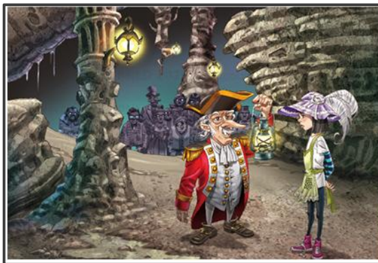
Figura 3: Alice e Barão Mimi no País da Mentira Fonte: Bandeira (2016, p.16)

A ambientação da figura 3 apresenta tons de cinza e traços esverdeados, o que sugere a presença de fungos e mofo, elementos que reforçam a descrição da caverna como “úmida, altíssima, e larguíssima, iluminada apenas por algumas lanternas penduradas ao longo das paredes de pedra” (Bandeira, 2016, p.15). A escolha de cores reflete o estado emocional da personagem, pois segundo Heller (2013, p.503), “todos os sentimentos mantidos em segredo se tornam cinzentos”. Assim, o cenário simboliza a transição de Alice e a busca por autoconhecimento, nessa jornada interna em que a personagem re(descobre) que “é preciso saber escolher” (Bandeira, 2016, p.100) e que, embora as verdades e mentiras possam ser diferentes, o perdão é um valor universal e imutável.