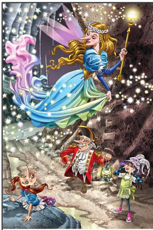
Figura 4: Alice, Barão Mimi e a Boa Mentira Fonte: Bandeira (2016, p.36)

Segundo Fernandes (2021, p.103), “o posicionamento do elemento na parte superior é chamado de ideal”, isto é, aquilo que se sobressai ou se destaca na ilustração, adquirindo maior saliência e chamando a atenção “através da intensificação ou suavização de cores, contraste, brilho, superposição, entre outros artifícios” (Fernandes, 2021, p.104). Na figura 4, os olhos e expressões se voltam para a Boa Mentira que aparece na parte superior, centralizada e em maior tamanho do que os outros personagens, o que enfatiza sua importância para o momento narrativo.