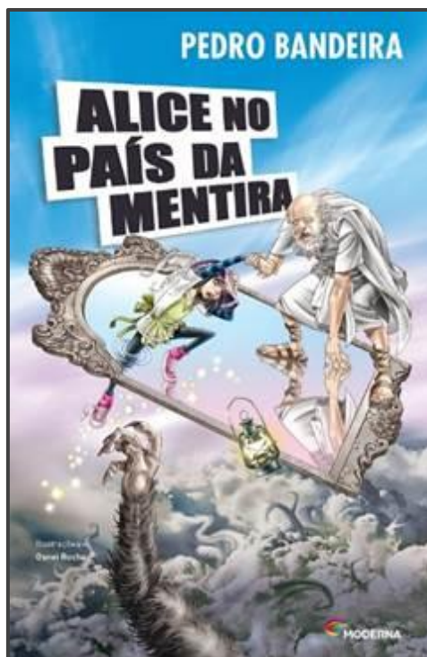
Figura 1: Capa do livro

A capa do livro é um dos primeiros signos linguísticos com que o leitor se conecta ao iniciar uma leitura. Sobre a capa, Carvalho (2008, p.30) afirma que “condensa numa única imagem a personalidade do livro, que pode ser uma referência a um momento marcante da narrativa ou um resumo dos acontecimentos”.