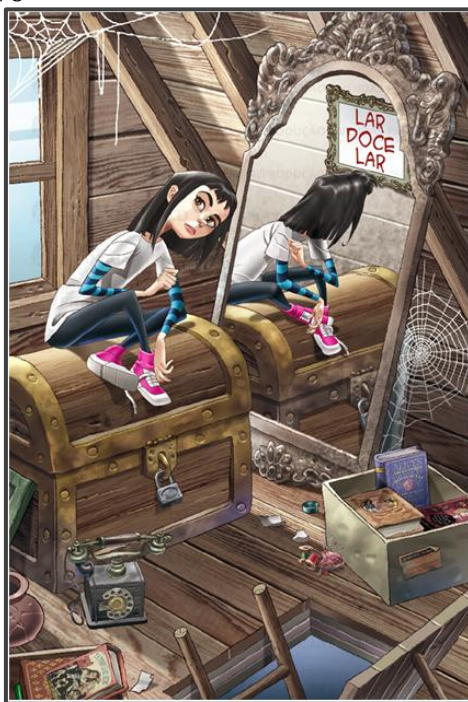
Figura 2: Alice no sótão da vovó

Na figura 2, Alice em cima do baú é o centro da ilustração, o que inicialmente atrai o olhar do leitor. Entretanto, outros elementos, como o reflexo no espelho, destacam-se mais do que a figura de Alice devido à direção do olhar confuso da personagem, com seus olhos voltados para o canto direito. Essa estratégia visual, que Dondis (1997, p.37-38) denomina aguçamento, rompe com a previsibilidade da centralidade, pois aponta para algo que é “visualmente inesperado” e “cria tensões na composição”. Assim, o olhar de