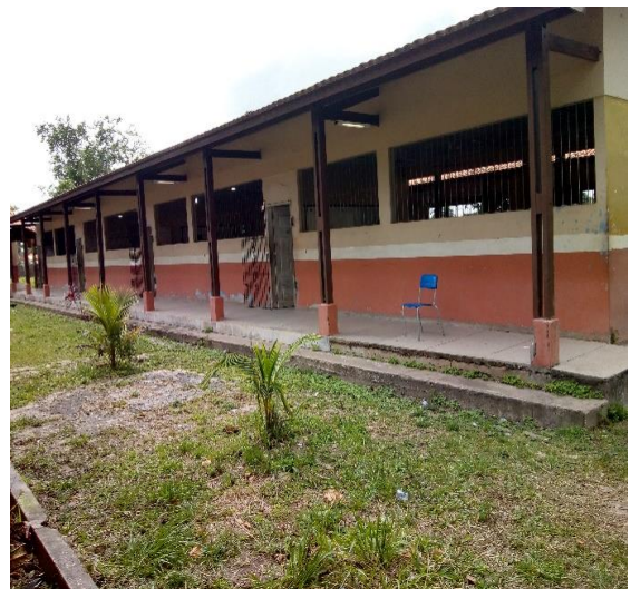
Imagem 5: Bloco 3 –Salas do 1º e 2º ano do Médio