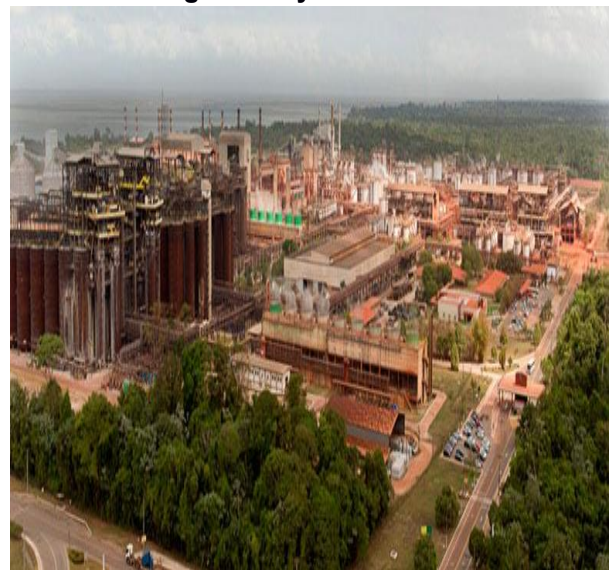
Imagem 3: Hydro Alunorte