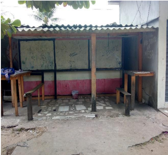
Imagem 8: Lanchonete - POINT

Um lugar conhecido pelos jovens é chamado de “point” e chamou atenção durante esse período de pesquisa; neste lugar conseguiu-se obter algumas informações importantes; nesse local é vendido lanche e há bancos improvisados de madeira. Neste espaço os alunos se reúnem para conversar sobre vários assuntos (drogas, bebidas, festas, aulas, escola, entre outros), sendo um local considerado como “cheio de informações”.