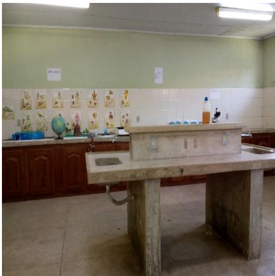
Imagem 6: Laboratório de Química e Biologia

As aulas são ministradas para jovens que tenham o interesse em aprender mais, e as turmas que demonstram maior interesse são as dos 3º anos, que farão a prova do Enem, principalmente em redação. A princípio as aulas eram realizadas no laboratório de química e biologia, ou em um espaço disponível, como a biblioteca. Depois passaram a ser realizadas dentro das salas de aula, nos horários vagos das turmas.