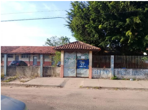
Imagem : Entrada da Escola

Em geral, são filhos de operários, domésticas e de pequenos agricultores que trabalham basicamente para garantir a sobrevivência diária. O número de alunos dobrou nesses 22 anos de implantação. A escola possui 45 turmas distribuídas em 16 turmas do ensino fundamental e 29 do ensino médio, funciona nos três turnos, sendo que no noturno, oferta somente o ensino médio. A Escola possui 37 professores (as) concursados pelo estado, entre outros funcionários terceirizados e concursados, como a secretária escolar, agentes administrativos, merendeiras, serventes e porteiros.