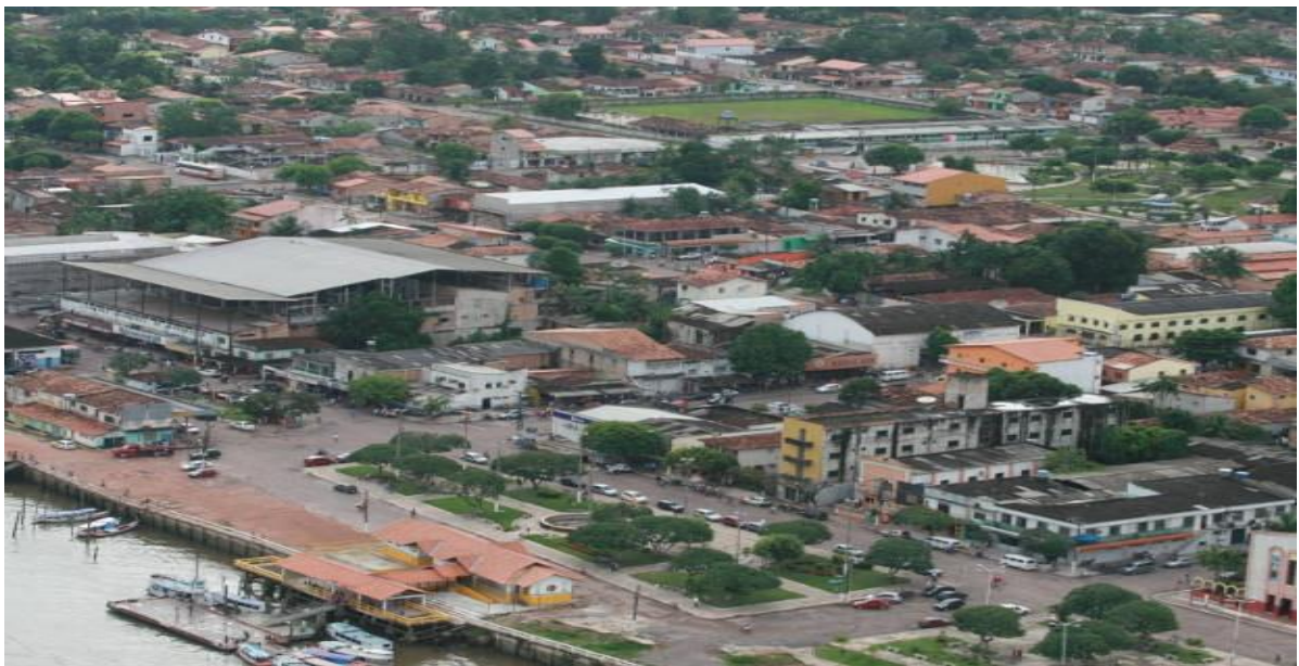
Imagem 1: Cidade de Barcarena