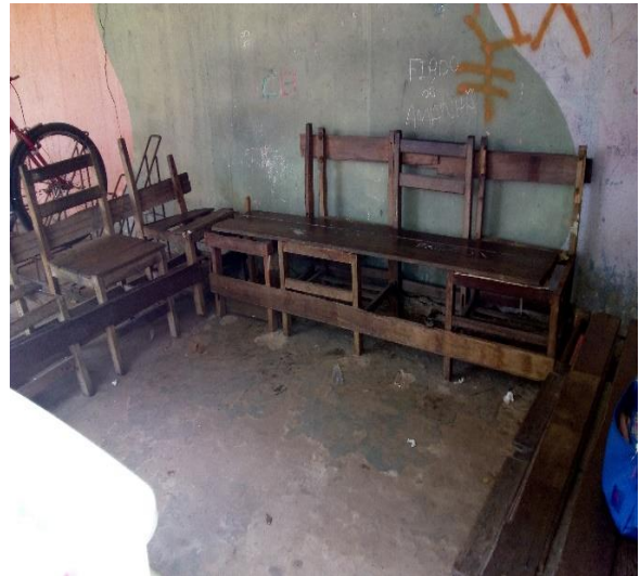
Imagem 9: Área de venda de Lanche – POINT 2