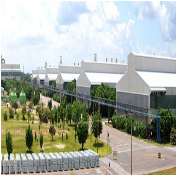
Imagem 2: Albrás