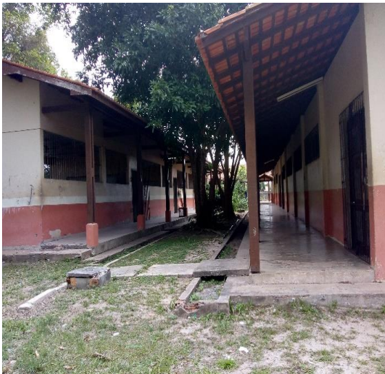
Imagem 4: Bloco 1 e 2.

No bloco 02 da escola tem: 01 laboratório de Química e Biologia, 01 sala de rádio escolar (não está em funcionamento), 01 sala de informática (desativada), sendo utilizada para arquivos e documentos da escola, 01 biblioteca, na área têm Banheiros Femininos e Masculinos, 01 copa e a quadra de esportes, que por falta de manutenção está desativada.