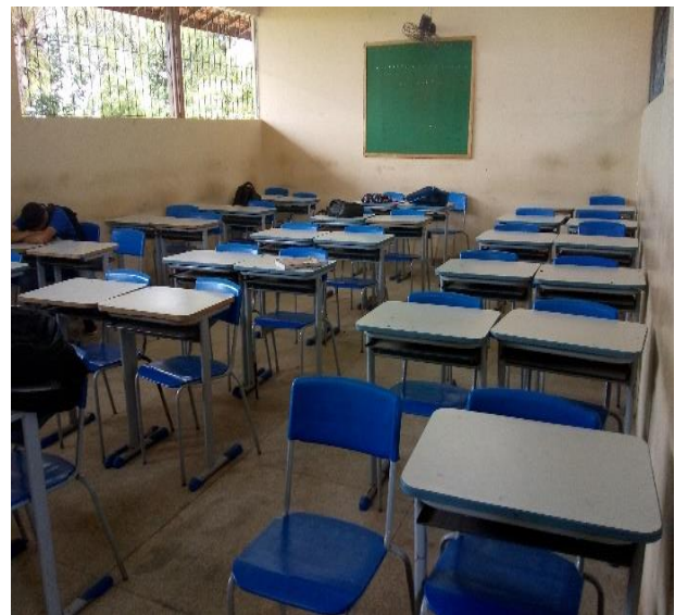
Imagem 7: Sala de aula