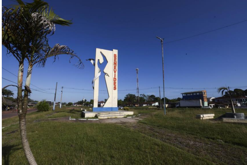
Figura1 - Entrada da cidade de Benevides