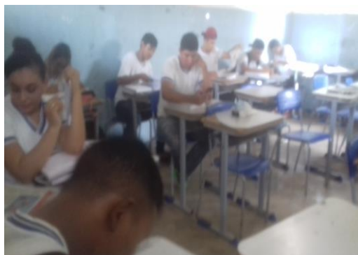
Imagen 2: Alumnos realizando lectura de textos en español

En la clase siguiente, hemos puesto las sillas en formato de círculo, para que se pudiera trabajar la competencia auditiva y lectora de los alumnos. Comenzamos entonces las presentaciones orales de los textos y a la medida que iban leyendo ayudábamos en la pronunciación de las palabras, siempre al lado del lector, alentándole a continuar la lectura y quitando dudas en relación a las palabras, y así lo hicimos hasta que todos presentaron (imagen 2). Al final, realizamos una discusión sobre el uso de esta herramienta en las clases de español y cerramos con un cuestionario acerca de preguntas abiertas y cerradas donde los alumnos evaluaran la metodología en cuestión (Anejo 3).