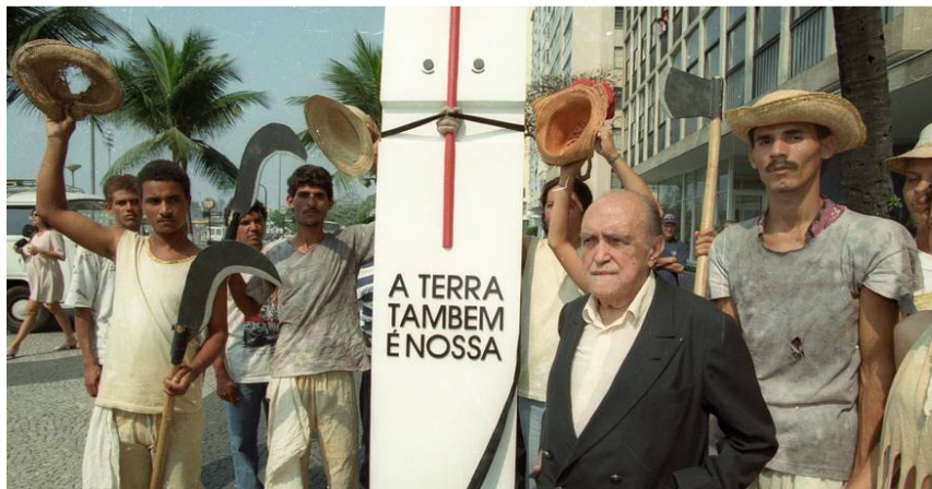
Figura 06: Oscar Niemeyer ao lado do monumento que criou em homenagem aos sem terra do massacre de Eldorado dos Carajás.

O monumento "Eldorado Memória" foi projetado por Oscar Niemeyer e doado por ele ao MST (Figura 06) e representa um arado de terra segurado por uma mão, dividido por um par de olhos.