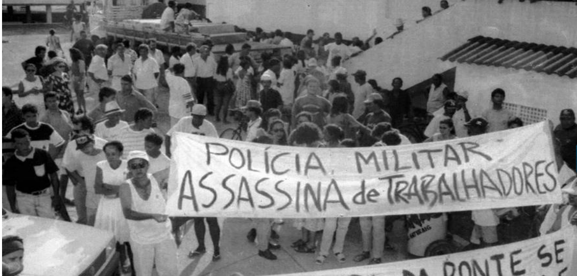
Figura 05: Manifestantes se reúnem na frente do Instituto Médico Legal de Marabá