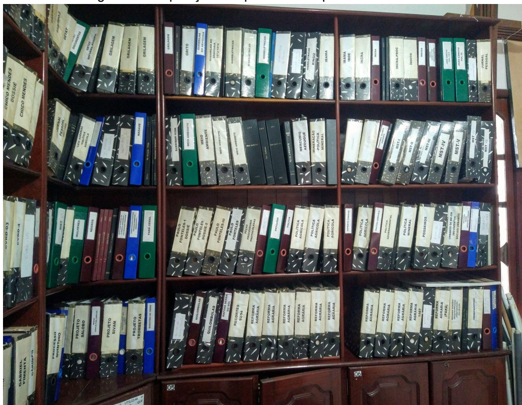
Figura 09: Disposição das pastas no arquivo da CPT-Belém.

As pastas são divididas por assuntos e municípios. Os assuntos mais recorrentes são: trabalho escravo, reforma agrária, política agrícola, Amazônia, ecologia e grilagem. Vale evidenciar também as pastas com nomes dos assassinados que lutaram pela terra como: Dorothy Stang, João Canuto, Expedito Ribeiro e José Cláudio e Maria entre outros.