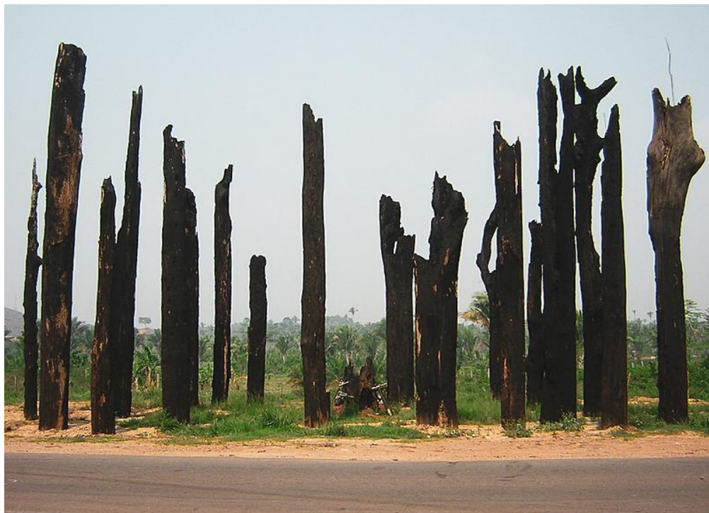
Figura 07: Monumento das castanheiras mortas, situado na curva do S.

Deste modo, em 1999 lideranças do Movimento Sem Terra se reuniram para erguer outro monumento em homenagem aos trabalhadores assassinados, dessa vez localizado na “Curva do S”, local do massacre. O monumento se chama “Castanheiras mortas” ou “Castanheiras de Eldorado dos Carajás” (Figura 07). Foram dispostas 19 castanheiras para representar cada vítima do massacre.