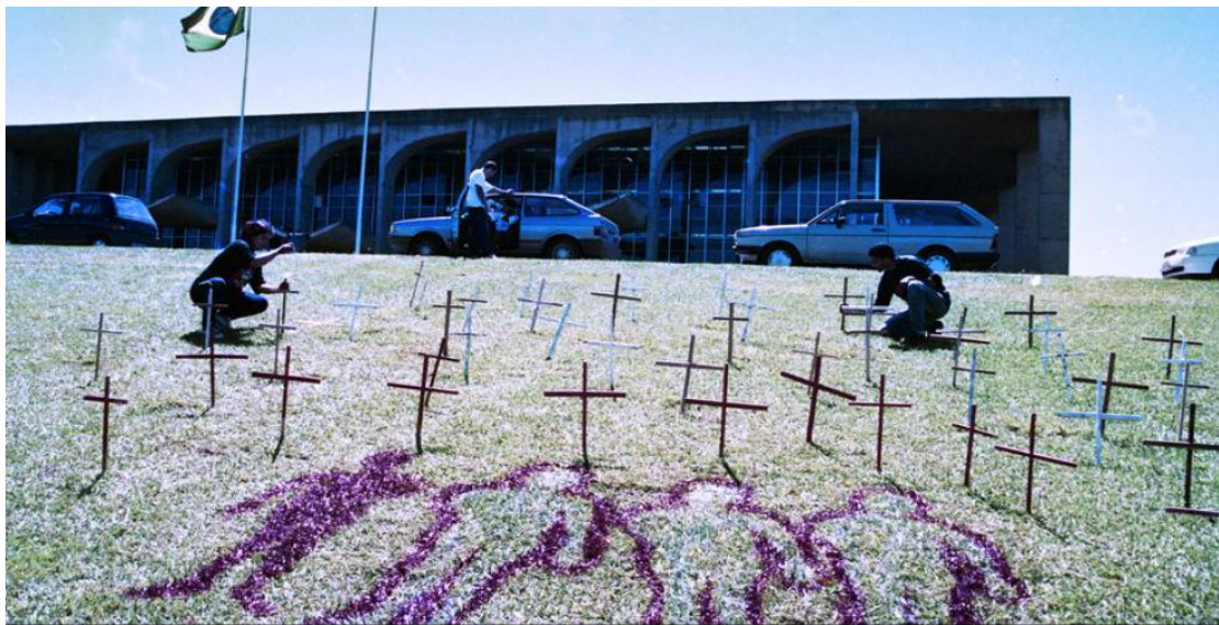
Figura 04: Cruzes são colocadas perto do Congresso Nacional para representar os mortos pelo massacre.

Os trabalhadores rurais tinham como objetivo estabelecer um acordo com o Instituto Nacional de Colonização e Reforma Agrária (INCRA) para a desapropriação da fazenda Macaxeira que não estava sendo usada para fins produtivos. Quando os manifestantes chegaram à “Curva do S” encontraram 150 soldados da polícia militar que impediram a continuidade da marcha com violência e sangue, resultando em 21 trabalhadores assassinados na busca por seus direitos à terra, à vida e à dignidade. Várias manifestações foram realizadas, como podemos ver na (figura 04 e 05), na tentativa de obter justiça para aqueles que tiveram suas vidas ceifadas.