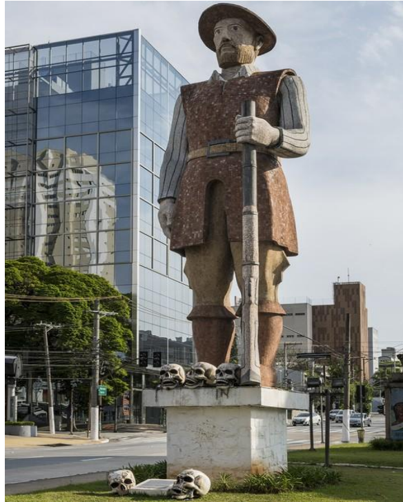
Figura 01 - Estátua de Borba-Gato recebeu crânios como forma de protesto