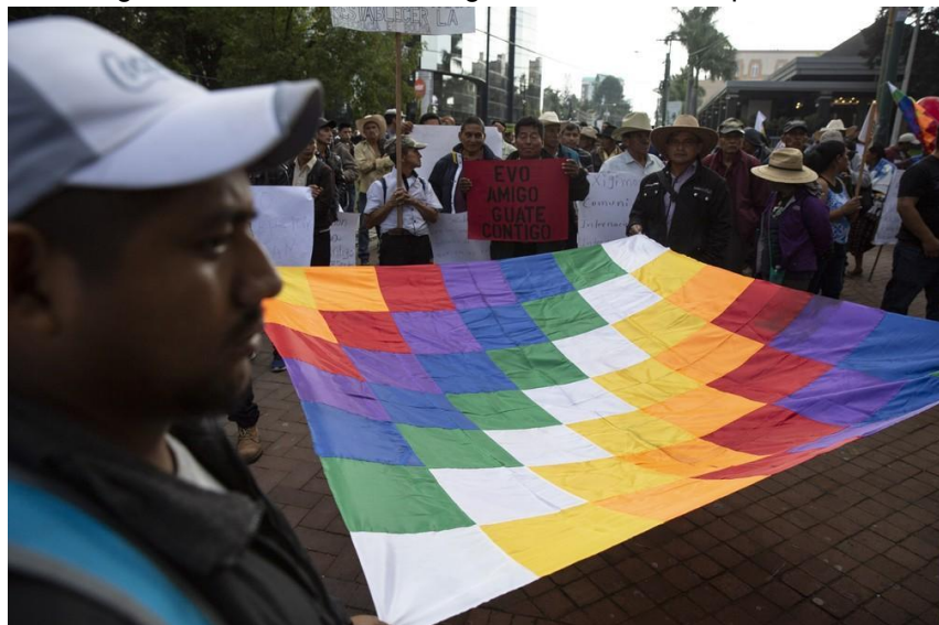
Figura 02 - Manifestantes seguram a bandeira wiphala

Conforme Macedo e Medeiros (2020, p.9) explicam, a bandeira “é um símbolo aimará, mas é utilizado por movimentos de outras etnias. Sua origem é atribuída ao Tiwanaku (império altiplânico anterior ao Inca), embora não haja provas arqueológicas desse resgate”.