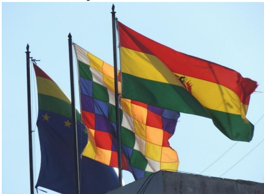
Figura 03 - Bandeiras da Bolívia

plurinacionalidade implicava em uma estrutura estatal mais atenta ao funcionamento das estruturas comunitárias, à governança própria, às autoridades locais dentre outras ações inerentes à dinâmica das comunidades.