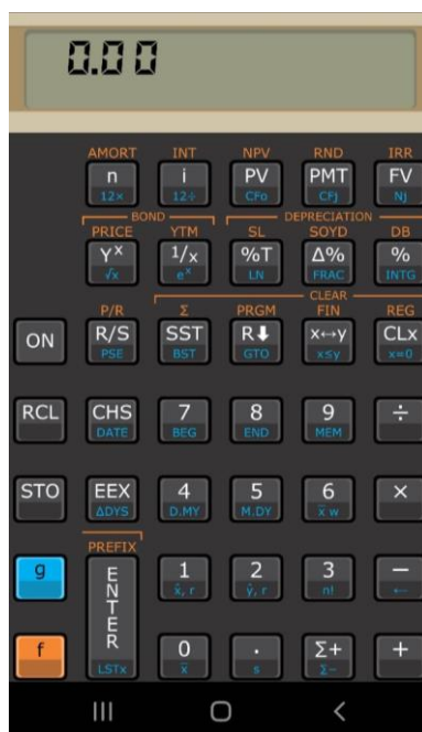
Figura 3 - Tela do aplicativo HP 12C no smartphone

A seguir está a tela inicial do aplicativo ( app )