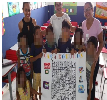
FIGURA 6 – PRÁTICA PEDAGÓGICA NA ESCOLA ESCOLA