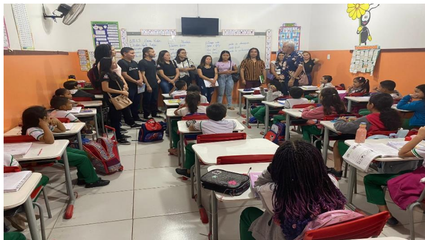
Figura 01 – primeiro contato dos residentes com os alunos

orientados sobre as etapas do programa e direcionados a fazer uma visita de reconhecimento nas escolas em que iríamos desenvolver o subprojeto. Em 13 de junho iniciou-se o processo de observação na Escola Municipal de Ensino Fundamental Bom Pastor, localizada no município de Abaetetuba - PA, a fim de, investigar possíveis dificuldades enfrentadas pelos alunos ao decorrer das aulas de língua portuguesa e durante a aplicação da “Avaliação Diagnóstica” bimestral do Sistema de Ensino Municipal de Abaetetuba. No decorrer do mês foram realizadas reuniões presenciais e on-line para relatar as experiências vivenciadas na escola, esclarecimentos e formação sobre o teste da psicogênese da linguagem oral e planejamentos de atividades para intervenção pedagógica.