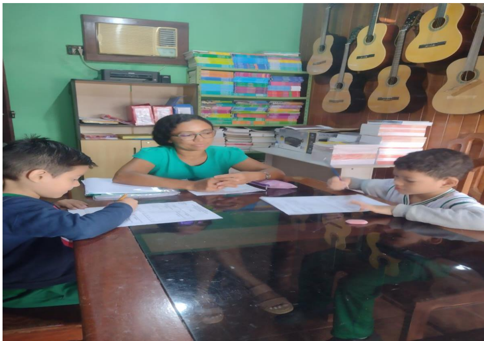
Figura 03 – aplicação da Avaliação Diagnóstica