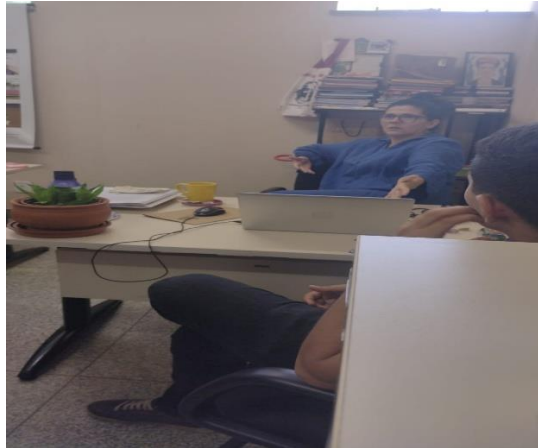
Figura 07 – reunião de planejamento para a intervenção