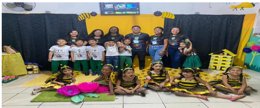
Figura 06 – I Congresso da escola Bom Pastor

No dia 03 (três) de outubro, participamos do I Congresso Científico da escola Bom Pastor, a turma do 1º ano apresentou seu belíssimo projeto sobre a dança as abelhas, neste momento, fizemos parte da organização do congresso juntamente com o corpo docente da escola.