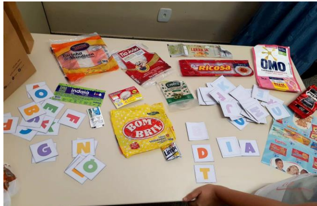
Figura 10 – material utilizado na aula

conhecem e que envolvessem seu município. A dinâmica trabalhada para completar o alfabeto foi muito interativa, a utilização dos rótulos gerou um bom desenvolvimento na execução da atividade proposta.