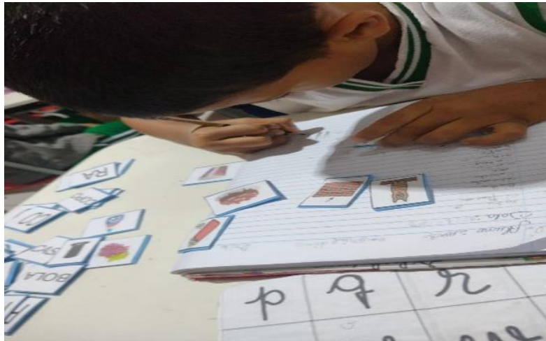
Figura 23 – aluno Asafe Brito produzindo a atividade proposta

surpreenderam ao escreverem seus nomes completos e sem ajuda de nem um de nós, fato que nos alegrou muito, pois, sabemos que sim, estamos ajudando na construção do sistema alfabético deles.