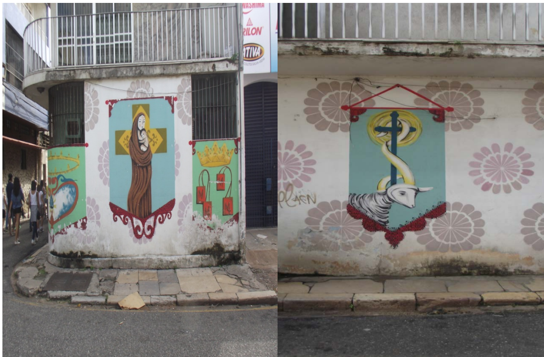
Foto 13 e 14: Mural dos Estandartes das igrejas da Sé, de Santo Alexandre, São João Batista e Do Carmo ambas localizadas na Cidade Velha.

da igreja católica na ocupação desse bairro em diferentes momentos da produção do espaço da cidade de Belém.