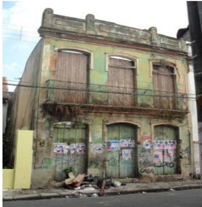
Foto 4: Casarão histórico tombado em alto estado de deterioração localizado na Rua Joaquim Távora em frente a praça do Carmo.