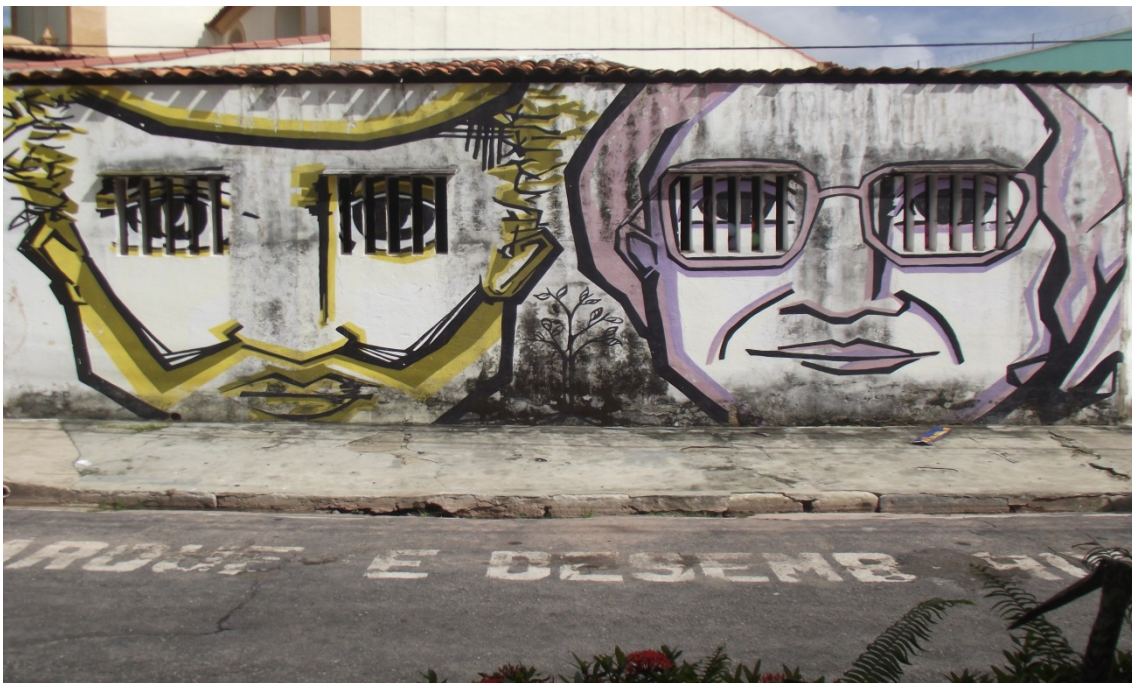
Foto 11: Graffiti de moradores ilustres da Cidade Velha: o padre Antônio Vieira e a médica Betina Ferro.