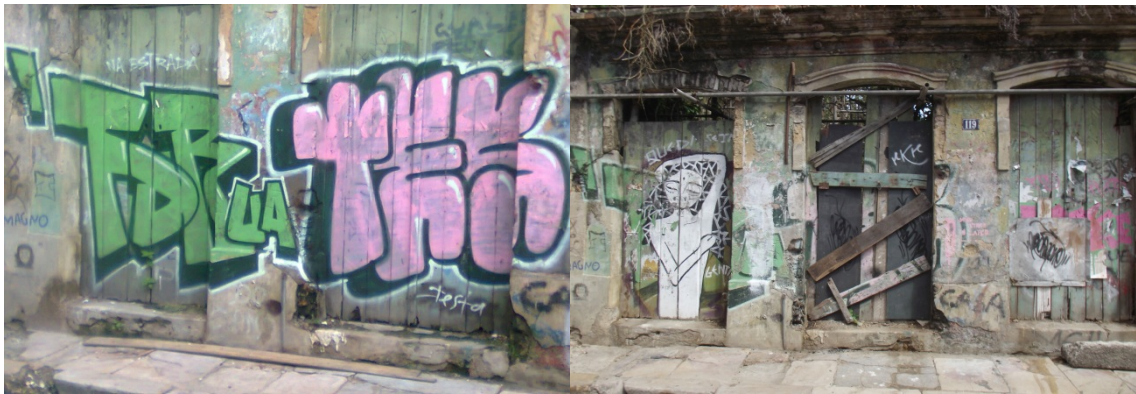
Foto5: Casarão histórico tombado em alto estado de deterioração localizado na Rua Joaquim Távora em frente a praça do Carmo em 2012 e 2015. Fonte: Oliveira 2012 e 2015.

As fotos acima retratam três momentos distintos do mesmo casarão, na primeira foto de 2011 temos o casarão deteriorado onde podemos verificar algumas pichações, onde uma delas está escrito “lixo” e há presença de cartazes de campanhas políticas, nas imagens abaixo a primeira de 2012 e a ultima de 2015