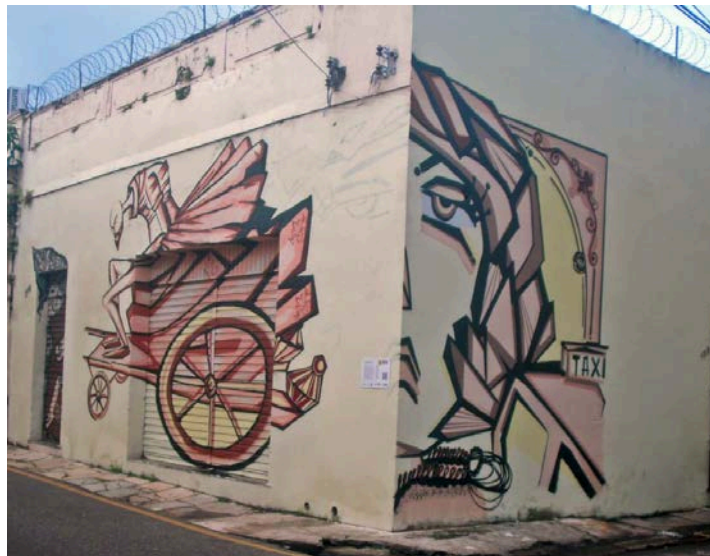
Foto 6: Mural retratando a lenda da mulher do taxi e do carroceiro fantasma.

Os graffitis da Rota Urbana pela Arte estão disperso pelas ruas da Cidade Velha e chamando a atenção de transeuntes para a memoria do bairro através dos elementos do cotidiano do bairro assim como do imaginário regional amazônico como podemos ver na serie de imagens abaixo.