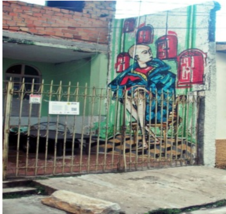
Foto 8: Mural retratando os moradores sentados na frente da casa no final da tarde como parte das praticas passadas de sociabilidade dos moradores mais antigos da Cidade Velha.