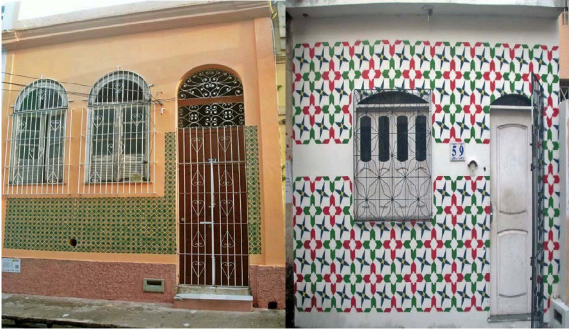
Foto 9 e 10: Fachadas de imóveis grafitadas com a técnica de stencil azulejos portugueses do período colonial.