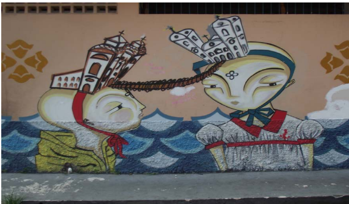
Foto 16: graffitidos supostos tuneis entre as igrejas da Sé a Do Carmo.

Ao final da foto 15 percebemos outro graffiti (foto 16), que veremos mais detalhadamente logo abaixo, faz referencia ao suposto túnel ligando a Igreja do Carmo à Sé o qual foi construído durante o período da Revolução Cabana.