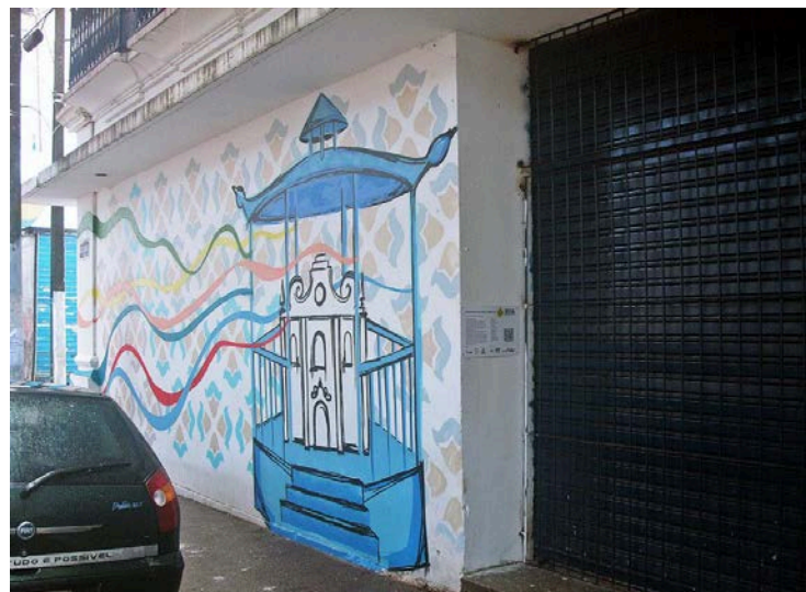
Foto 18: Grffiti do antigo coreto da Praça do Carmo.

O ultimo graffiti retratado está localizado na parte térrea do Fórum Landi, nos recorda do antigo coreto da Praça do Carmo.