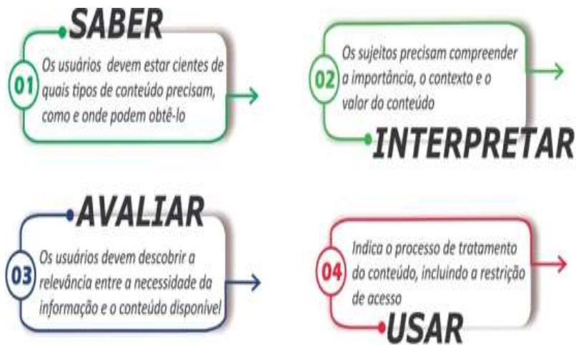
Figura 1 - Ciclo da Competência Arquivística