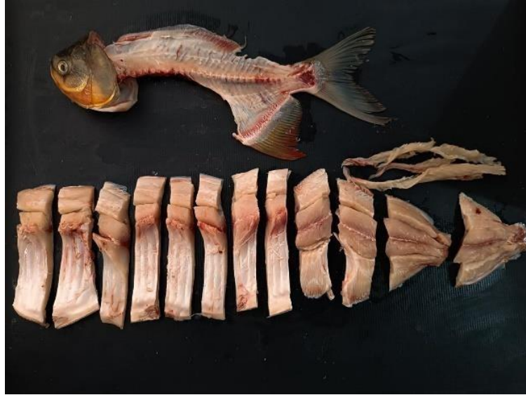
Figura 3. Carcaça de tambatinga ( Colossoma macropomum × Piaractus brachypomus ) em diferentes padrões de cortes. A) Exemplar com uma banda, padrão de corte em três costelas, em cada costela 4 espinhas. B) Exemplar contendo duas bandas, padrão de corte totalizando dez costelas, de 3 espinhas em cada costela. C) Especificação das porções, onde 1, 2 e 5, foram considerados resíduos. 3 costelas e 4 cortes das porções caudais. D) Exemplar contendo duas bandas, filetadas em 4 costelas cada, em cada costela 4 espinhas, totalizando 8 porções.

Figura 2. Carcaça de tambatinga ( Colossoma macropomum × Piaractus brachypomus ) segmentada em diferentes cortes anatômicos utilizados na análise de rendimento. Observam-se as costelas, bandas musculares, porções caudais, cabeça e carcaça residual.