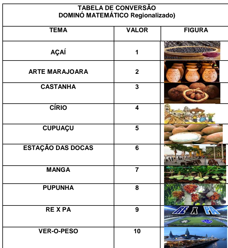
Figura 02 – Tabela de Conversão confeccionada em papel autocolante

3º passo – As figuras com temas regionais impressas, devem ser coladas nas peças de miriti, já cortadas anteriormente, no formato e tamanho de uma peça de dominó convencional. Na sequência, fazer a impressão da Tabela de Conversão (figura 02), com cada tema a ser utilizada no jogo. A tabela serve para atribuir valores aos temas escolhidos que servem para fazer as Operações Matemáticas solicitadas na peça.