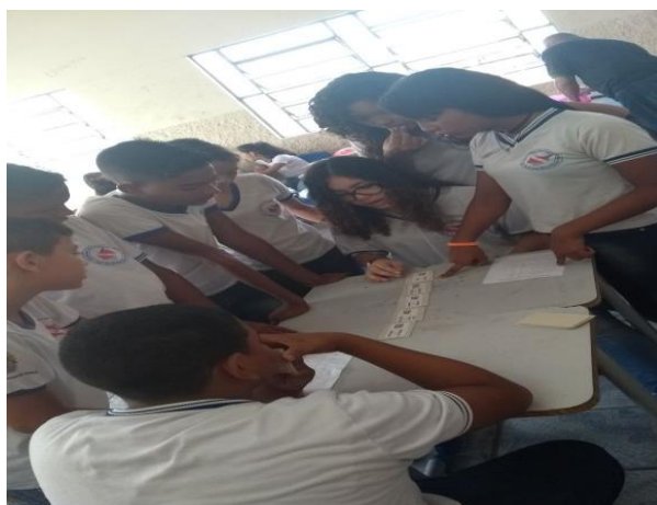
Figura 04 - Estudantes do 7º Ano jogando o Dominó Regional.

estudantes enquanto estes, embora presentes fisicamente estivessem ausentes mentalmente, pois viajavam por lugares diversos e distantes da sala de aula devido ao tema pertencente ao jogo de Dominó Regional, como os lugares turísticos, a comida, clubes e outros aspectos regionais presentes na Tabela de Conversão do jogo. O jogo prendeu a atenção dos estudantes, porque estes precisavam se envolver de forma intensa, pois neste momento, eram participantes ativos no jogo e não meros espectadores.