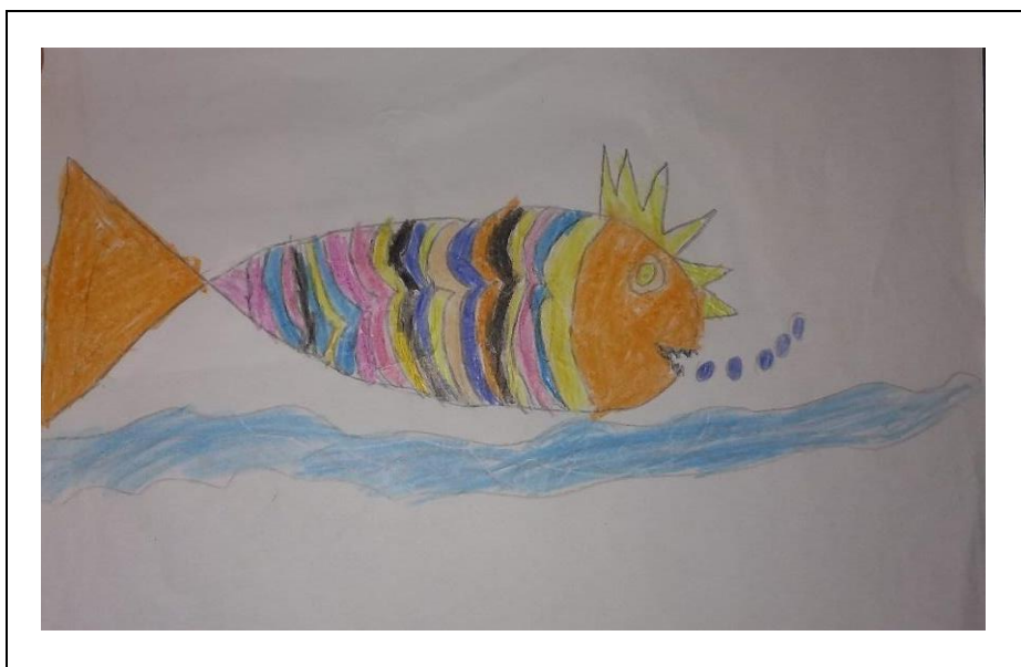
Figura 3 – Atividade 2 Aluno B