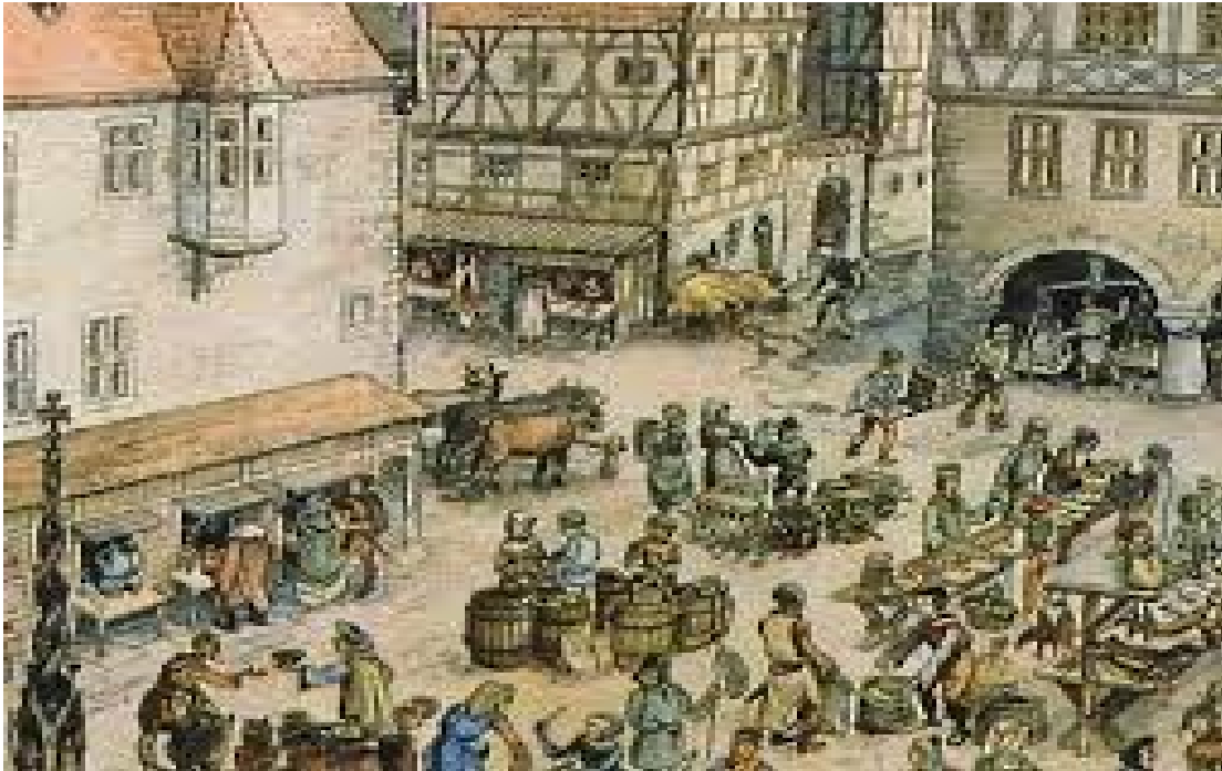
Imagem B: Observe a imagem e relate a atividade, o grupo social e fale sobre os benefícios que esse grupo possuía no renascimento.

Imagem A: Descreva o cenário apresentado na imagem abaixo, quais são os grupos sociais que estão presentes e as atividades desenvolvidas por eles.