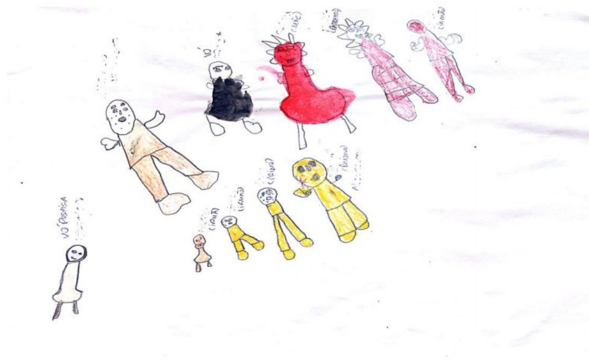
Imagem 2: Árvore Genealógica de Aladim

tios, padrasto, sua “avó postiça” (mãe de seu padrasto), com os quais referiu boa relação. Os tios e a ”avó postiça” residiam próximos a sua residência, onde a última chegou a demonstrar interesse quanto a tutela da criança (Sic – prontuário de acolhimento).