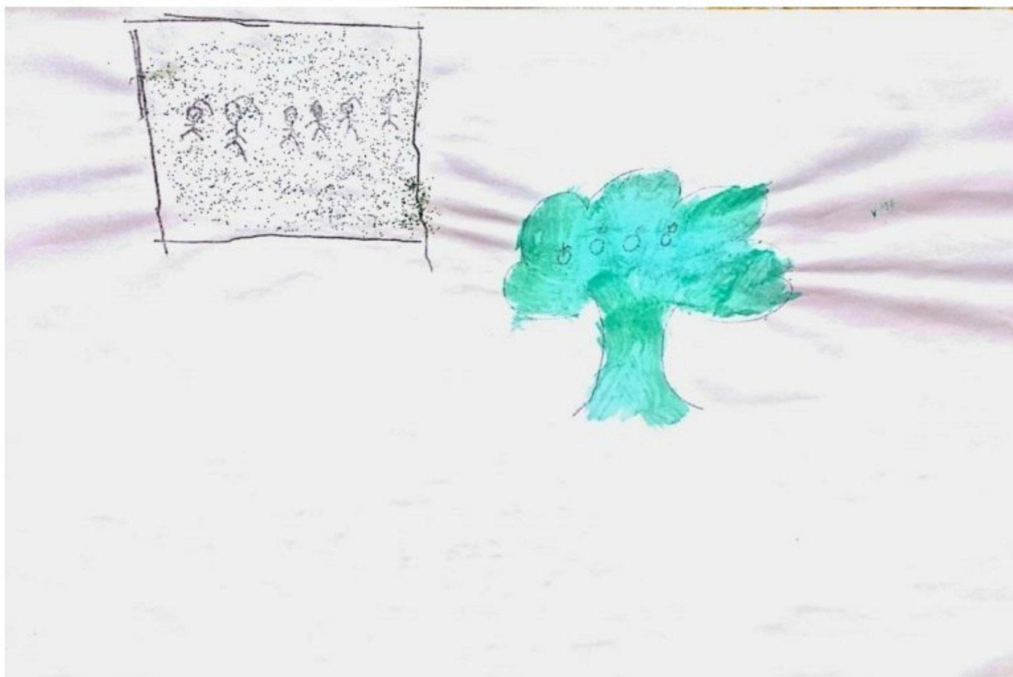
Imagem 7: Atividade “Vamos criar!” de Alice

da narrativa na atividade “Vamos criar!”, compartilhando também através de relatos diversas situações vivenciadas com eles, acrescentando seu desejo em poder retomar a convivência rotineira já que estes moraram com seus respectivos pais.