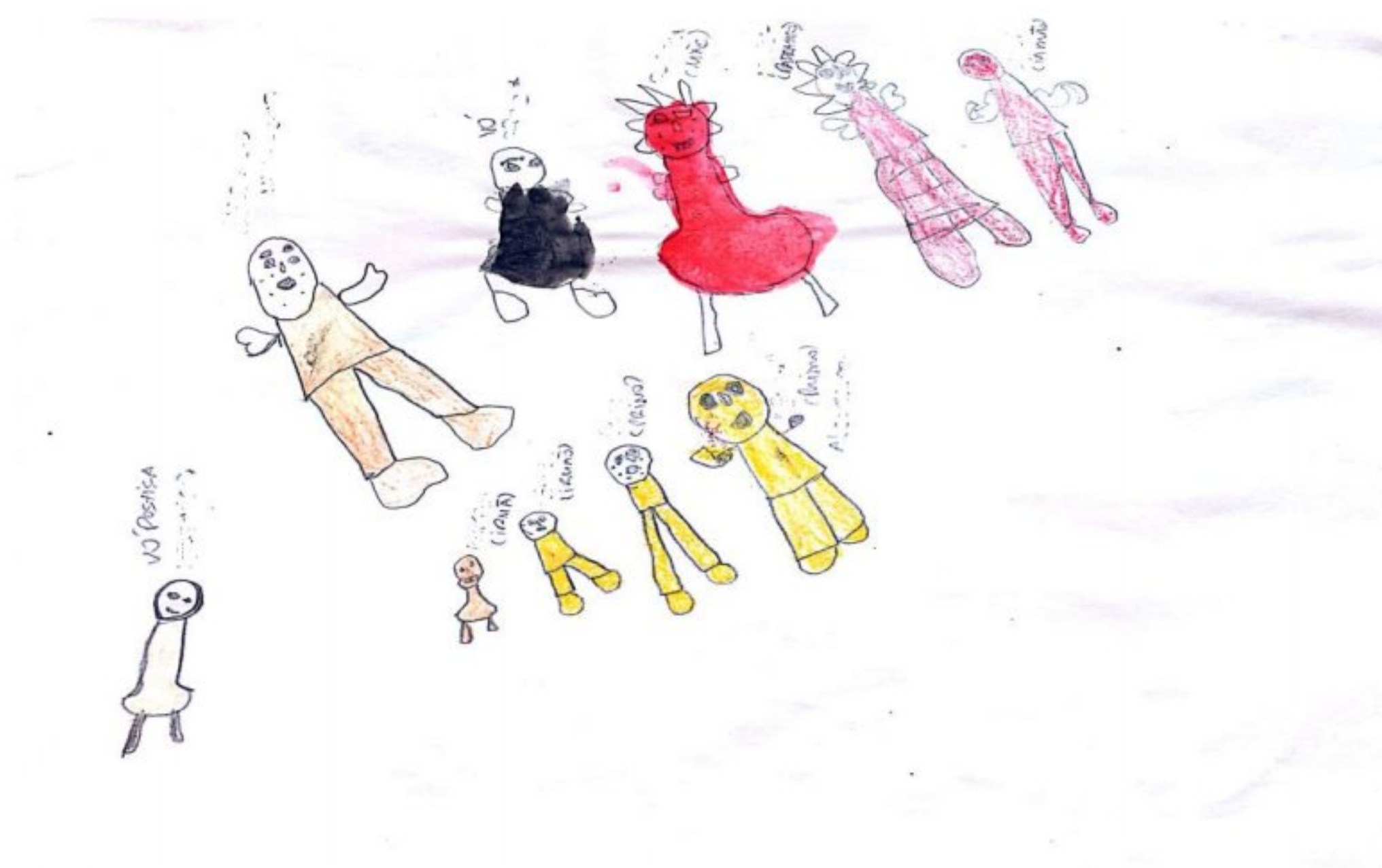
Imagem 4: Atividade “Árvore Genealógica” de Aladim

Esta característica foi observada no momento em que Aladim desenha sua mãe com empenho, como visto na Imagem 4, elencando detalhes de sua aparência física em forma de cuidado e apreciação. Relatou sentir falta de estar com ela.