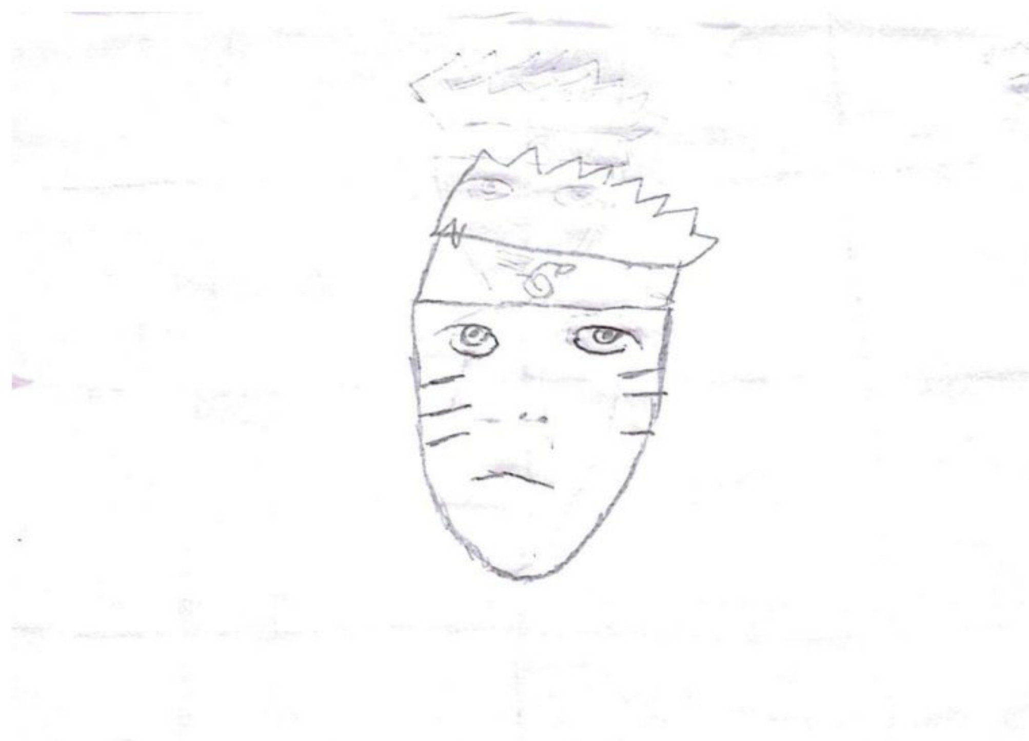
Imagem 10: Atividade “Vamos Criar!” de Hércules

O brincar como ocupação, caracteriza-se neste contexto de crianças em situação de violação de direitos, como um instrumento que visa “auxiliar e entender suas necessidades [...] ressignificando seu fazer e pensar, de modo que possa também agir e se relacionar no mundo coletivo de maneira agradável para si e os demais” (SANTOS, et al., 2010 p. 83).