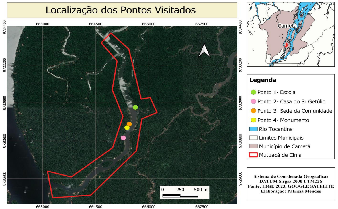
Figura 7- Mapa de Localização dos pontos visitados