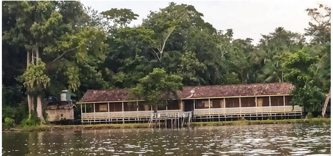
Figura 2- EMEIF Mutuacá de Cima antes da reforma.