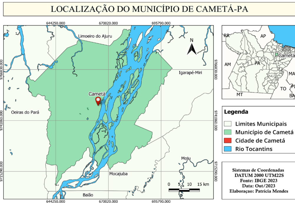
Figura 1- Mapa de Localização do Município de Cametá.

A figura 2 mostra a EMEIF de Mutuacá de Cima localizada no Rio Mutuacá de Cima, na área ribeirinha do município de Cametá, local onde foi realizada a pesquisa. Inicialmente, conhecida como escola “Dom Romualdo de Seixas”, foi fundada no dia 25 de agosto de 1999, com intuito de atender às necessidades educacionais da comunidade ribeirinha local e das proximidades vizinhas. De início era composta por 13 funcionários sendo uma professora responsável, 10 (dez) professores e 4 (quatro serviços gerais). Funcionavam os dois turnos (manhã e tarde), no qual no turno da manhã eram turmas de 1 a a 4 a série e no turno da tarde duas turmas de 5 a série. Depois de alguns anos a escola passa a ser chamada de EMEIF de Mutuacá de Cima porque possuía com o mesmo nome de uma escola localizada na cidade de Cametá.