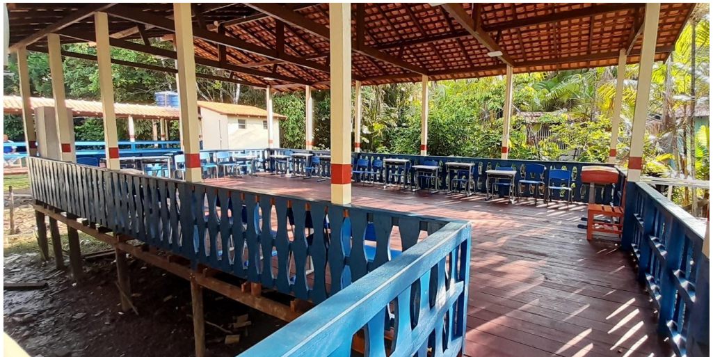
Figura 5- Área livre da escola