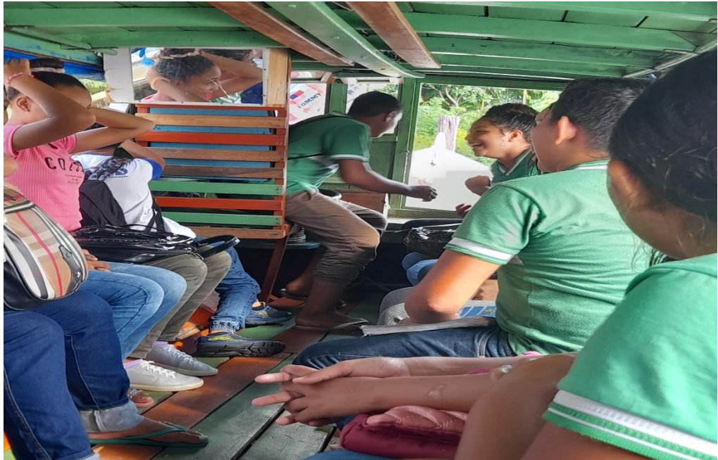
Figura 8- Saída da escola.

Durante a observação, foi feito um questionamento com os alunos sobre o que a escola representava para eles, e umas das falas foi que aquele espaço era onde eles construíam conhecimento. A saída da escola para outro ponto contou com o transporte escolar da comunidade (Figura 8).