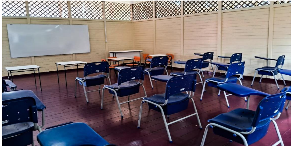
Figura 4- sala de aula