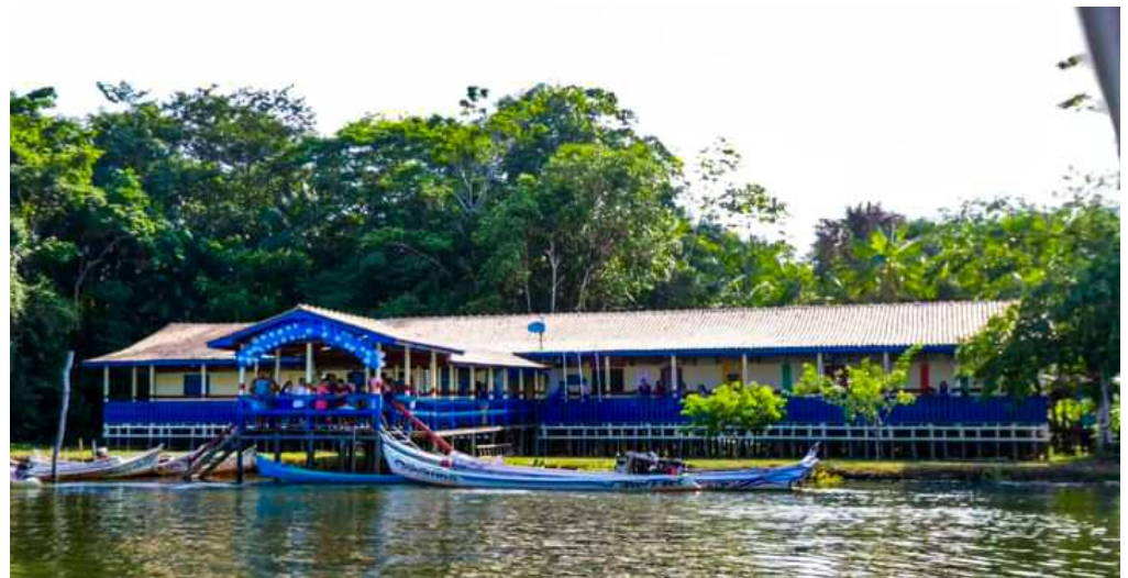
Figura 3- EMEIF Mutuacá de Cima após a reforma

Após a reforma e ampliação efetivada no ano de 2023, a escola ficou estruturada em 05 salas de aula climatizadas, uma copa, uma secretaria e diretoria, 02 banheiros, uma área livre (Figura 3, 4 e 5).