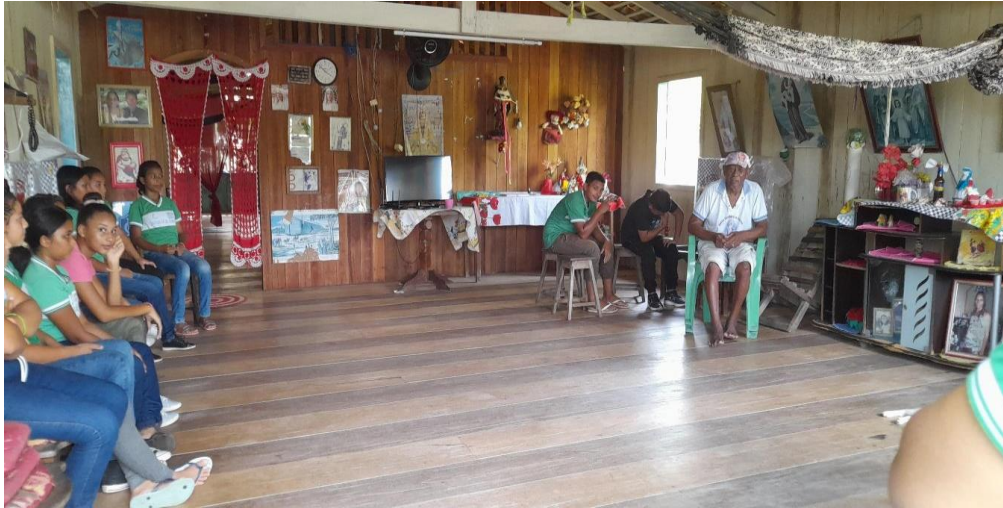
Figura 9- Diálogo com morador antigo da comunidade