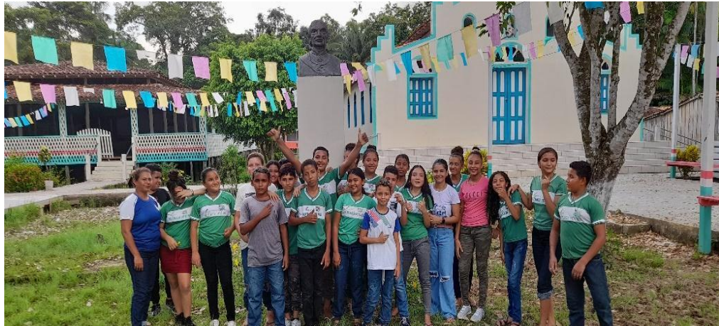
Figura 10- O monumento de Dom Romualdo de Seixas.