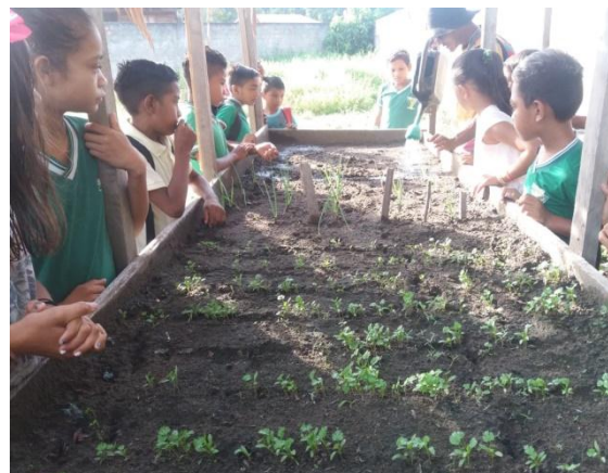
Figura 17 - Atividade na horta da Escola Mario Arcanjo