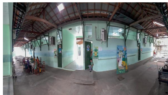
Figura 3 EMEF Mario Arcanjo - Salas e Corredor