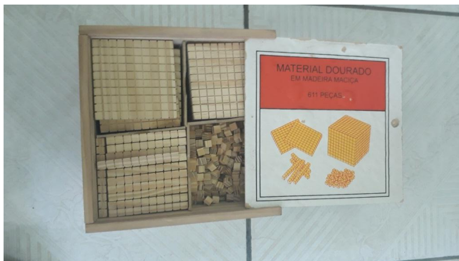
Figura 9 – Material Dourado utilizado no Acompanhamento Pedagógico em Matemática.