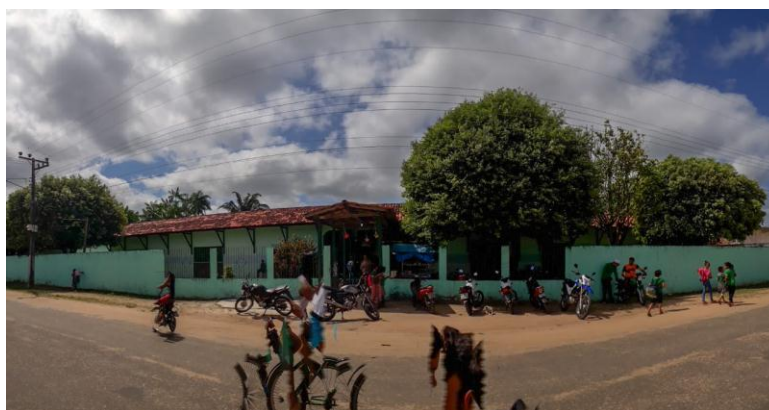
Figura 4 - EMEF Mario Arcanjo - Frente