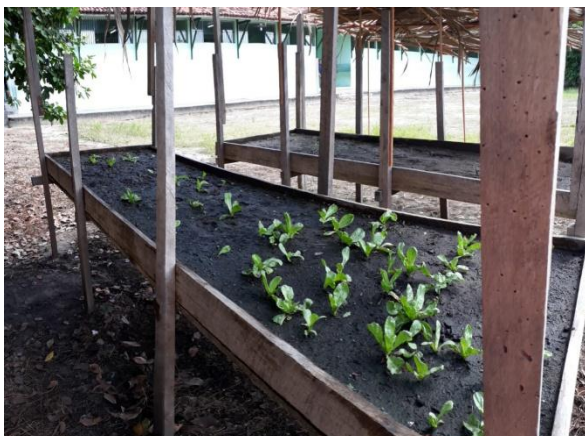
Figura 16 - Canteiro da horta na Escola Mario Arcanjo