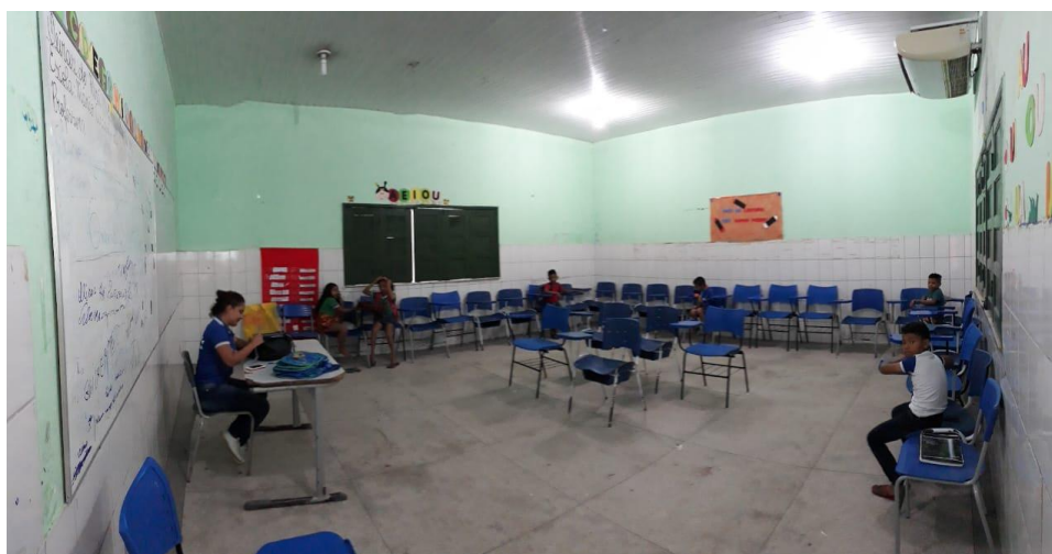
Figura 13 - Sala 2 PNME. Acompanhamento Pedagógico em Matemática.

A mediadora acredita que trabalhar reforçando os que alunos aprendem em sala de aula ajuda os alunos a sentirem-se mais inseridos, fazendo com que eles não se sintam excluídos. O trabalho com jogos e brincadeiras envolvendo números e operações proporciona um momento de interação diferenciado, fazendo com que os alunos tenham maior compreensão da matemática de forma mais fácil e dinâmica. No entanto, a falta de materiais pra realização de trabalhos diferentes é ainda um problemas a serem batidos, poucos são os jogos disponíveis para utilização, fazendo com que o quadro seja bastante utilizado.