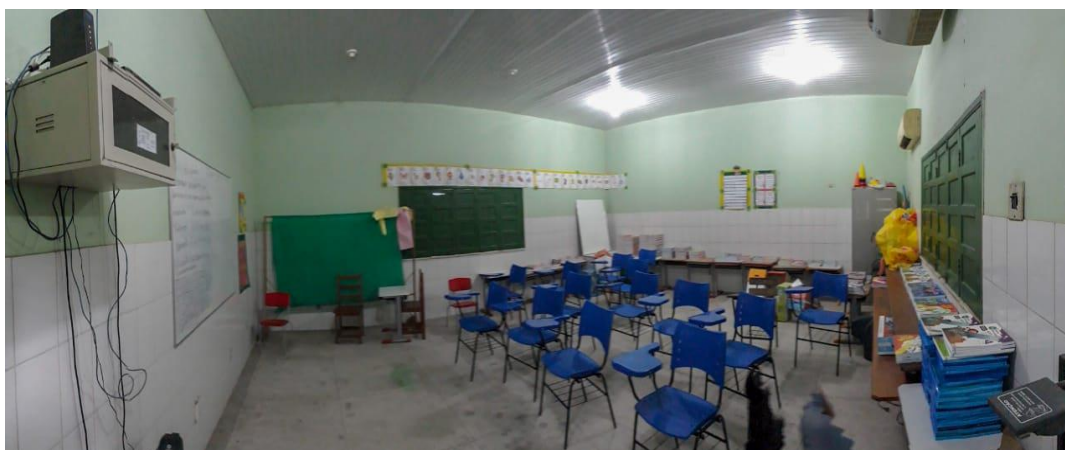
Figura 12 - Sala 1 PNME - Escola Mario Arcanjo

O Acompanhamento em Língua Portuguesa e Matemática, assim como as atividades de Música e Horticultura quando se trata das aulas teóricas, são realizados nas salas de aulas disponíveis para a realização das atividades do Programa.