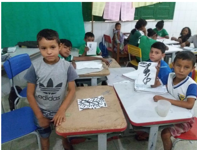
Figura 15 - Atividade de Música, conhecendo os tons musicais - Foto Autorizada.