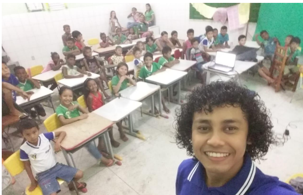
Figura 14 - Ensaio com alunos do Coral (Foto Autorizada)