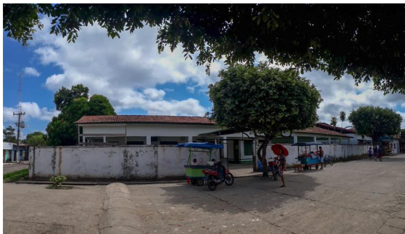
Figura 1 - EMEF Therezinha Gueiros - Frente