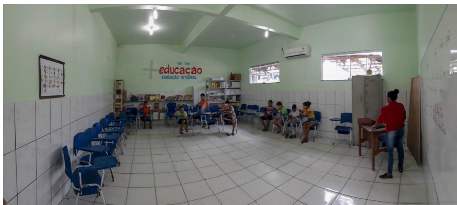
Figura 7 – Sala de onde funciona o PNME na Escola Therezinha Gueiros.