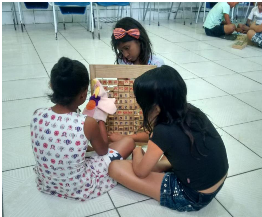
Figura 10 - Acompanhamento Pedagógico em Matemática (Foto Autorizada).