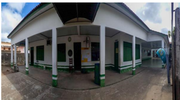
Figura 2 EMEF Therezinha Gueiros – Entrada

A escola apesar de está situada no centro da cidade trabalha com alunos que trazem consigo problemas familiares e sociais que refletem no desempenho escolar, havendo assim a necessidade de um acompanhamento pedagógico diferenciado, caracterizando, associado ao baixo IDEB escolar, características essas também exigidas para que o PNME seja implantado na escola, fazendo com que não apenas a essa escola, mas a outra também sejam ótimos campos de estudo para verificação da execução e pratica do PNME.