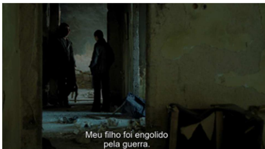
Figura 2 – Cena do Filme “Incendies”