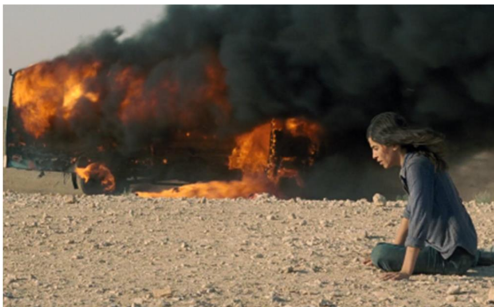
Figura 6 – Cena do Filme “Incendies”

Nesse cenário, uma das cenas mais emblemáticas do filme destaca Jeanne presenciando a execução de uma família inteira, um momento carregado de tensão e simbolismo que expõe as dinâmicas de intolerância religiosa e suas consequências devastadoras. Para melhor exemplificação, segue apresentado na Figura 6, umas das cenas mais emblemáticas do filme, em que Jeanne presencia a execução de uma família inteira, motivada, sobretudo, por questões religiosas.