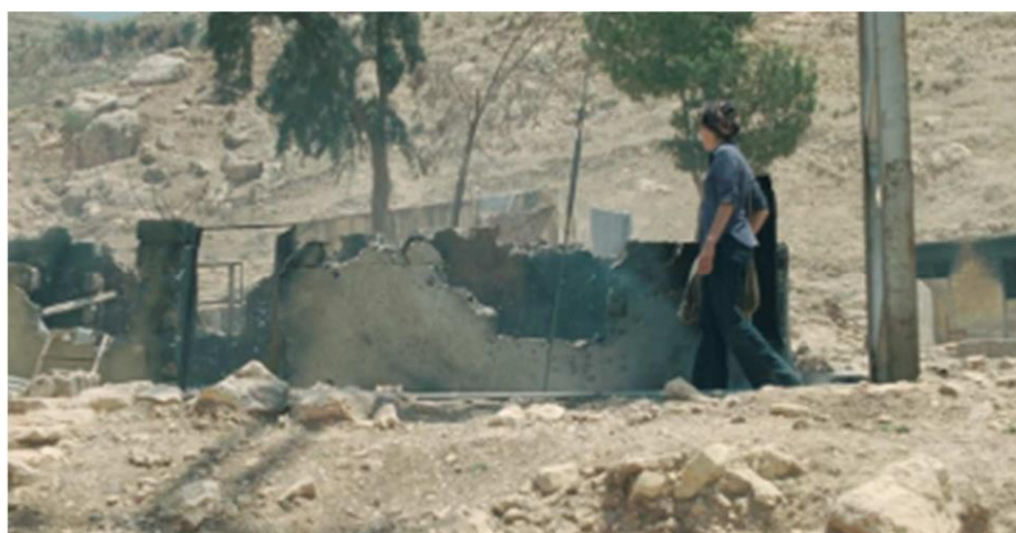
Figura 3 – Cena do Filme “Incendies”

Além disso, a cenografia é utilizada de forma a reforçar a temática central do filme. Os ambientes desolados e destruídos retratados na tela, não apenas estabelecem o contexto físico da narrativa, mas também simbolizam a desumanização e a degradação causadas pelo conflito armado. A ausência de vida e cor nas locações destaca a sensação de desolação e enfatiza a brutalidade do ambiente em que os personagens estão inseridos, refletindo a perda de esperança que permeia a narrativa. Tais aspectos podem ser evidenciados na cena do filme apresentado na Figura 3.