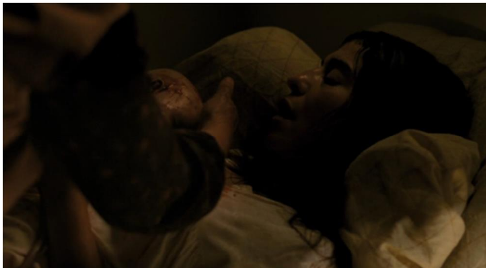
Figura 4 – Cena do Filme “Incendies”

Por fim, a interpretação dos atores é essencial para transmitir a profundidade emocional e psicológica dos personagens. Por meio de expressões faciais, gestos e entonação vocal, os atores conseguem revelar a complexidade moral dos indivíduos em situações extremas. As performances intensas e convincentes do elenco fortalecem a representação da banalidade do mal e dos dilemas éticos enfrentados pelos personagens. Como bem evidenciado em mais uma cena do filme na Figura 4.