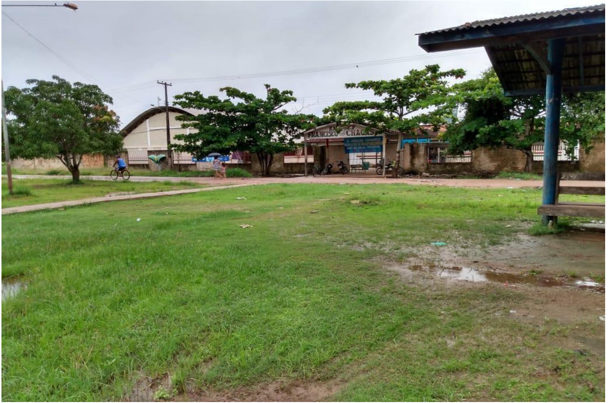
Anexo A: Escola Francisco Chagas da Silva