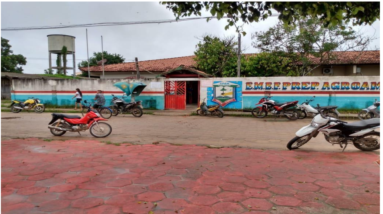
Anexo B: Escola E.M.E.F. PREP. Agroambiental Prof. Lindalva Pinho