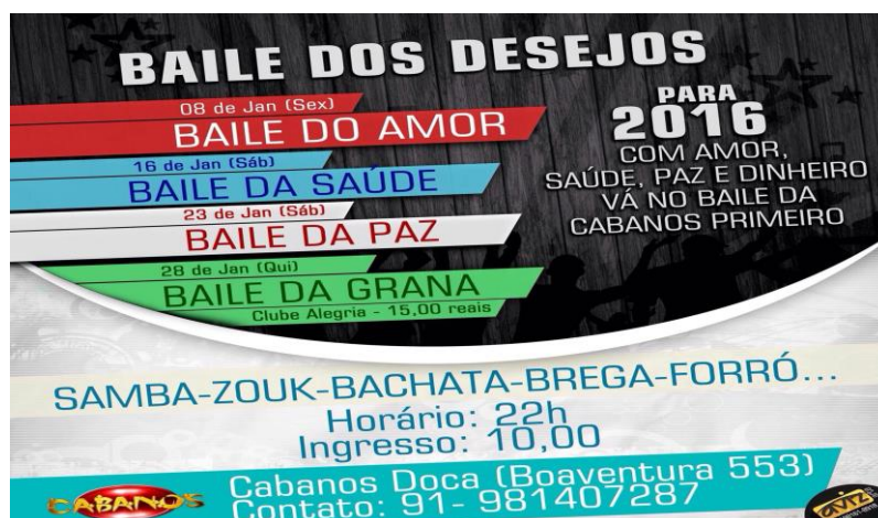
Fig. 8. Cartaz de divulgação dos bailes

O publico que frequenta as suas aulas nesse espaço novo, é bem mais jovem, fator este que influencia totalmente na dinâmica de todo o baile, principalmente na sequência de musicas que irão tocar no decorrer deste, geralmente, a sequencia maior de musicas tocadas são dos ritmos samba, zouk, bachata, reggae, forro e brega, é importante dizer que tocam todos os ritmos, porem estes tem maior ênfase.