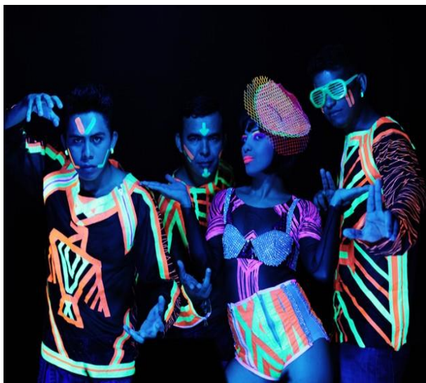
Fig. 3. Banda Gang do Eletro