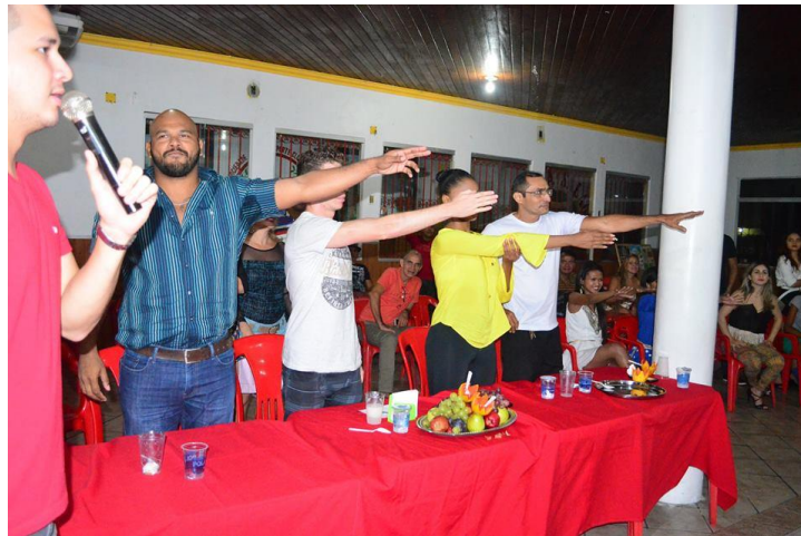
Fig.5 Corpo de jurados para avaliar o desempenho técnico dos alunos

A realização dos bailes e dos concursos se transformam em uma grande festa, os alunos já contam com esta atividade. Este fato contribui para o melhoramento da técnica e mais vontade de permanecer dançando. Na imagem abaixo um dos momentos do concurso.