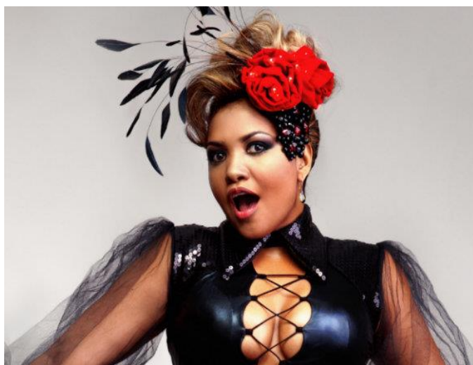
Fig.2 Gabi Amarantus

A referida cantora começou a investir em sua carreira solo e continuou nas paradas de sucesso com outras musicas, chegando ao seu auge em 2012 com a musica Ex- My Love que serviu como abertura da novela Cheias de Charme apresentada na emissora de grande sucesso, a Rede Globo. Desde então, a cantora passou a frequentar constantemente vários programas de varias emissoras com grande prestígio, hoje a cantora é conhecido por grande parte do publico brasileiro.