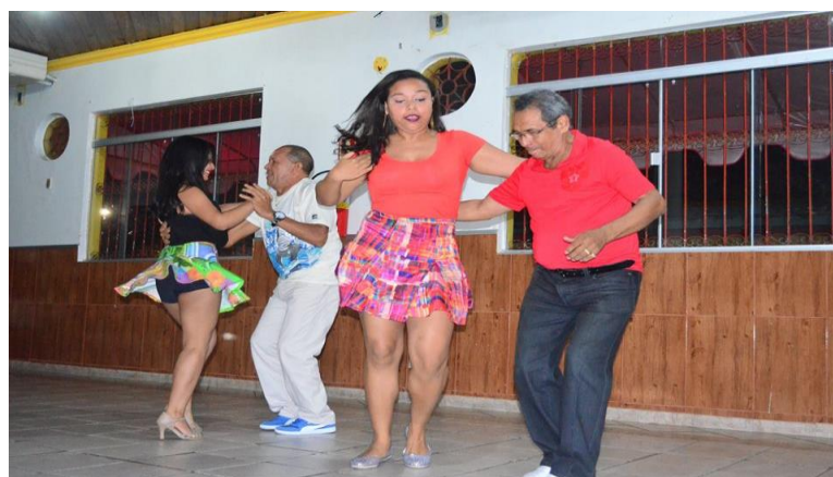
Fig. 6. Duas bolsistas com dois alunos, no concurso de merengue.

A realização dos bailes e dos concursos se transformam em uma grande festa, os alunos já contam com esta atividade. Este fato contribui para o melhoramento da técnica e mais vontade de permanecer dançando. Na imagem abaixo um dos momentos do concurso.