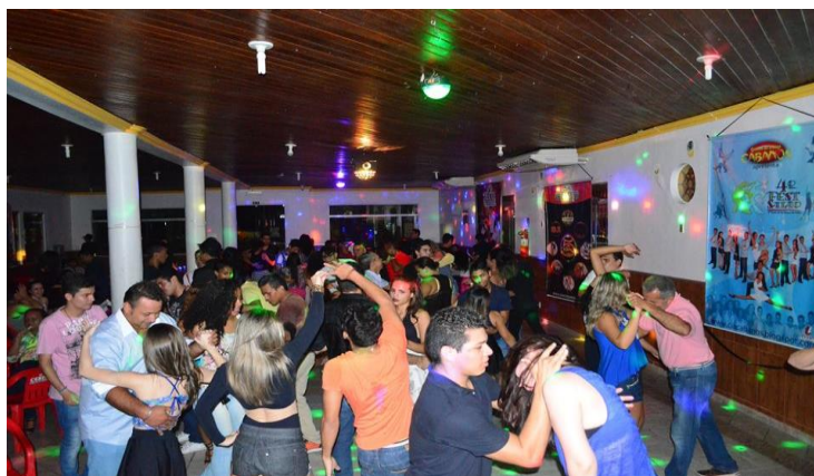
Fig. 4. Salão de festa do Clube Alegria.

No início do ano de 2015, o Rolon Ho teve a idéia de dar uma inovada nos bailes de salão, para isso, iniciou uma maratona de concursos que ficariam no lugar das apresentações que os alunos costumavam fazer no meio dos bailes. Estas apresentações foram durante um bom tempo a melhor forma que a academia encontrou de manter esses alunos bem mais próximo. Este contato se dava devido aos treinos, os quais não