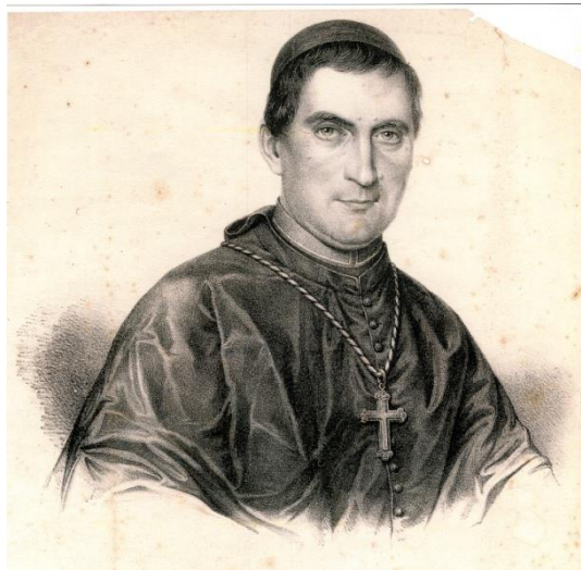
Figura 1 – Dom João Antonio Farina.