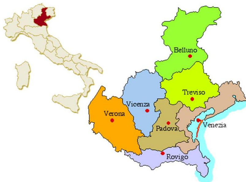
Figura 9 – Mapa da província do Vêneto

O projeto Educacional do Padre João Antonio Farina era fazer do seu instituto “um seminário de mestras para a educação popular” (SDVI, 2001, p. 20), os pedidos para abrirem casas chegavam e Farina, na medida do possível, respondia aos pedidos de abrir as