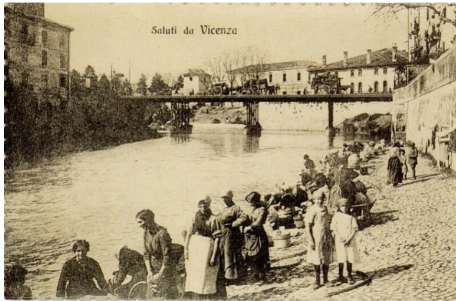
Figura 5 – Rio Bacchiglione.