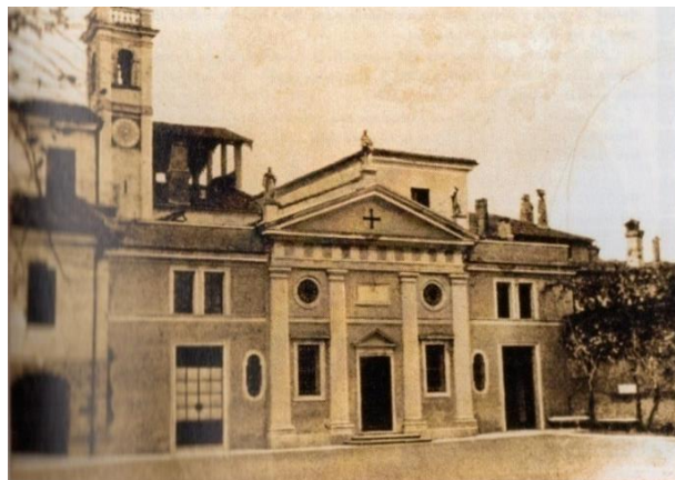
Figura 2 – Instituto Farina, no final do século XIX.