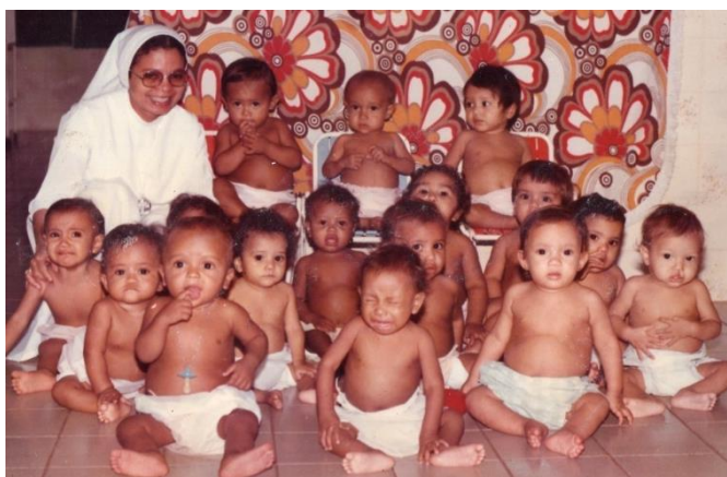
Figura 12 – Crianças da Creche, 1993.