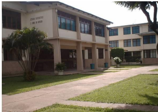
Figura 11 – Comunidade Santa Izabel da Hungria.

As informações encontradas no arquivo do Centro, em um livro chamado Matérias do Centro em Jornais , no qual encontra-se alguns fragmentos de jornais dos anos de 1970 em diante, que vão destacar a história do início das atividades da comunidade Santa Izabel da Hungria, e a transformação ocorrida na dimensão territorial e pastoral.