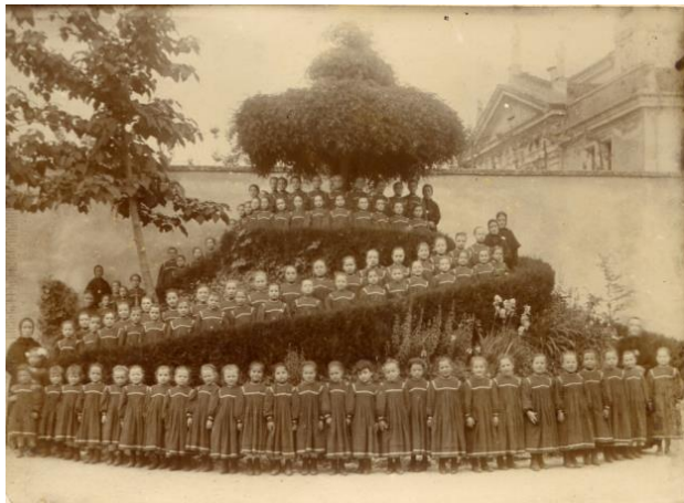
Figura 6 – Educandas do Instituto Farina.