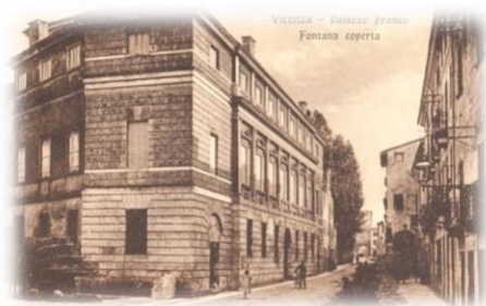
Figura 3 – Escola de Caridade, 1831.