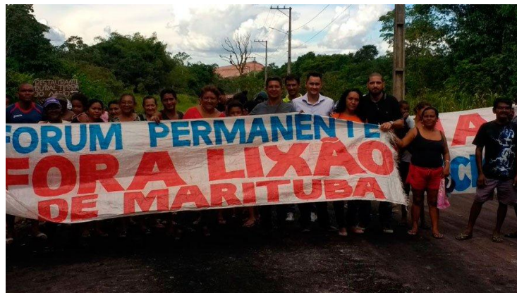
Imagem 3 – Moradores interditam acesso ao CPTR Marituba