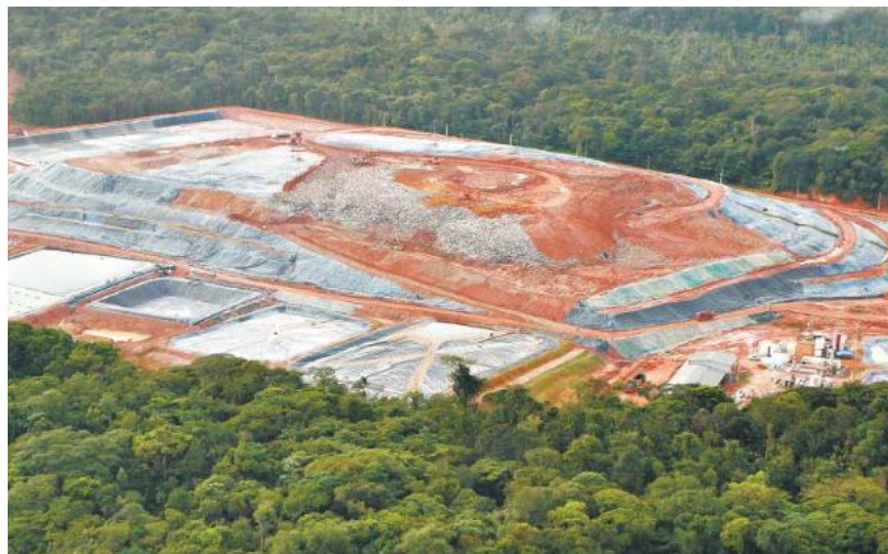
Imagem 5 – Vista Panorâmica da CPTR Marituba

Segundo Britto e Ferreira (2011), a Paisagem é o conjunto de forma que, num dado momento, exprime as heranças que representam as sucessivas relações localizadas entre o homem e a natureza, no entanto, as relações estabelecidas entre o homem e a natureza só podem ser percebidas se for feita uma imersão na paisagem para além do que se pode ver, assim, os seus significados podem são compreendidos.