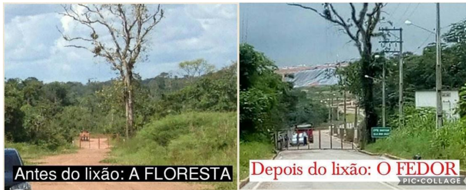
Imagem 4 – Antes e depois do “lixão”