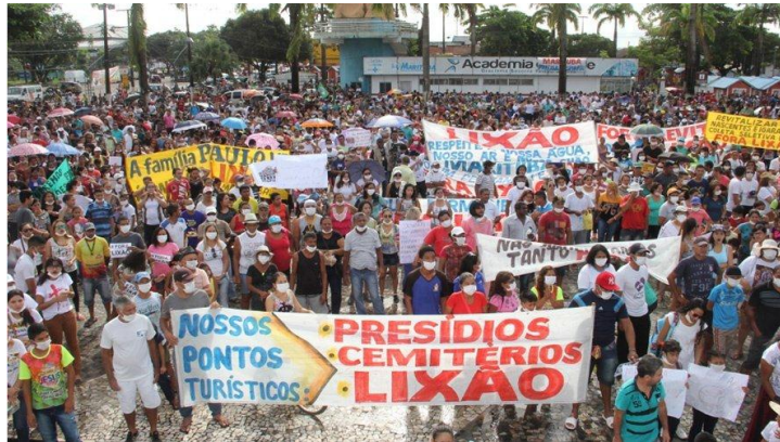
Imagem 2 – Moradores de Marituba protestam contra o “lixão”